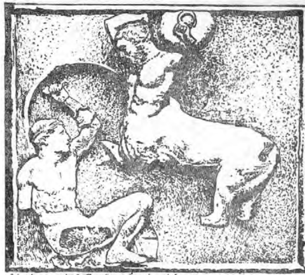
Metopa del festejon de Atenas existente en el Museo Británico.