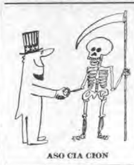
ASO CIA CRON