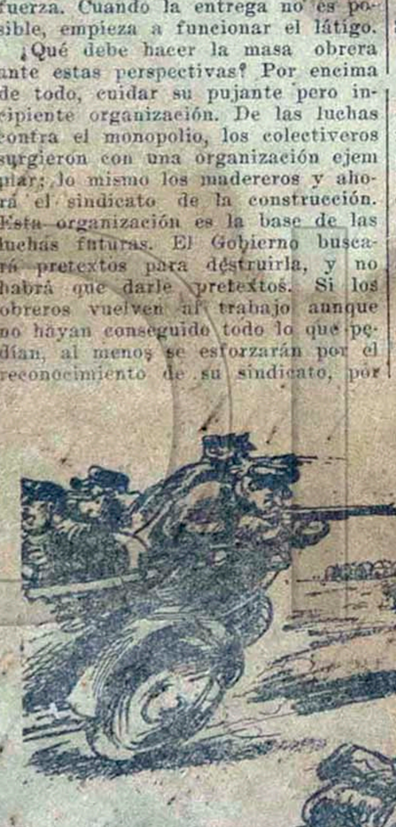
(De New Masses) DIBUJO DE PHILIP REISMAN

Siempre se mantiene dentro de un salario de ochenta a ochenta y cinco pesos. Pero, el gobierno, Orden Social y la Sección Especial quieren acabar con todo el movimiento obrero del país. Hasta ahora contaban con la complicidad abierta de las centrales obreras vendidas a la Casa Realada, pero en adelante esa complicidad se hace cada vez menos factible, pues la masa obrera ha abierto sus dos ojos a la realidad y al momento que vivimos. Esas poderosas organizaciones se están salvando aceleradamente de la influencia del "gremialismo puro", para entrar de lleno en la concepción de la lucha de clases. El gobierno, a medida que cuenta con menos garantía entre los oficialistas que aún restan, no ve otra salida que la represión por la fuerza. Cuando la entrega no es posible, empieza a funcionar el látigo.