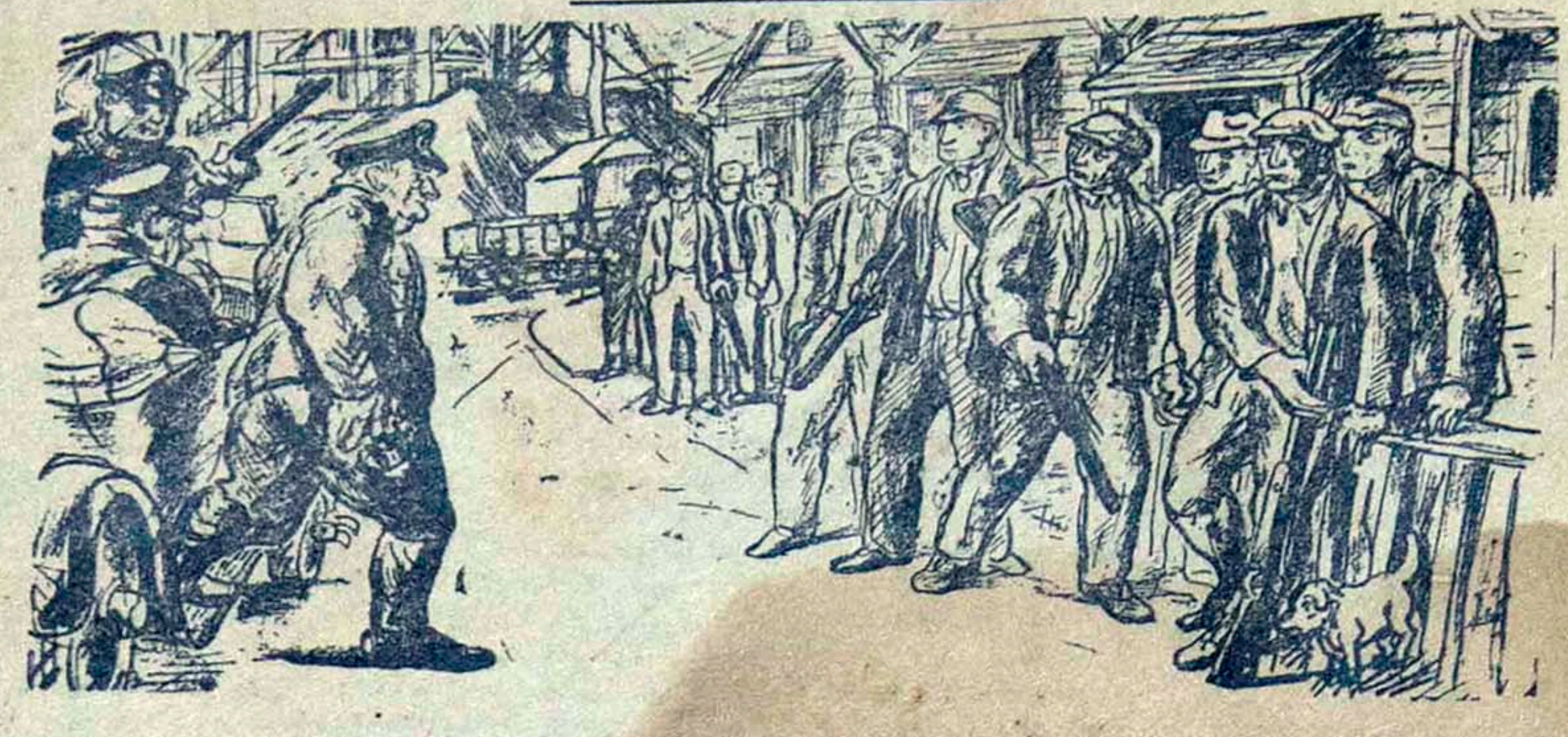
(De New Masses) DIBUJO DE PHILIP REISMAN

La ciudad paralizada; la población solidaria con la huelga; el gobierno y la burguesía con un miedo terrible. No creíamos en esto, con feo el jefe de policía. El miedo lo hizo torpes, comenzando por querer reprimir el movimiento con balas, de funciones por centenares y la intervención argentina del ejército nacional. Entonces vieron las autoridades que tenían ante sí una organización poderosa, que indicaba el resurgir de la combatividad obrera a través de las luchas precedentes y a través del mismo cambio en la dirección de la C. G. T., por la presión de las masas hastiadas de entrega y traición permanentes. La C. G. T. tiene una gran deuda con la masa obrera: veremos como trata de cumplir el actual Consejo Central. En la última huelga, escamoteó otra vez su solidaridad.