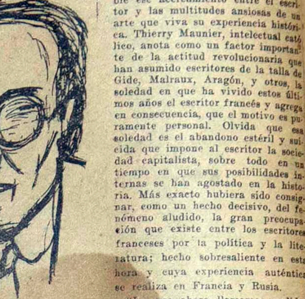
ANDRÉ GIDE

le lleva a afirmar que la salvación del hombre sólo es posible en función de la comunidad. André Gide ha resuelto el gran problema del escritor actual, sosteniendo que si hay un arte que verdaderamente necesita del contacto con la realidad ese arte es la literatura.