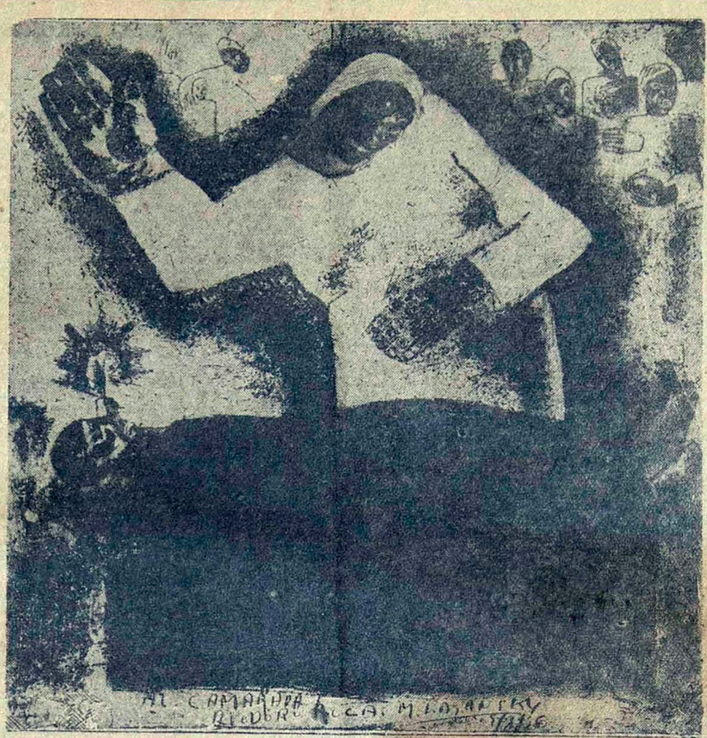
L A S A N S K Y