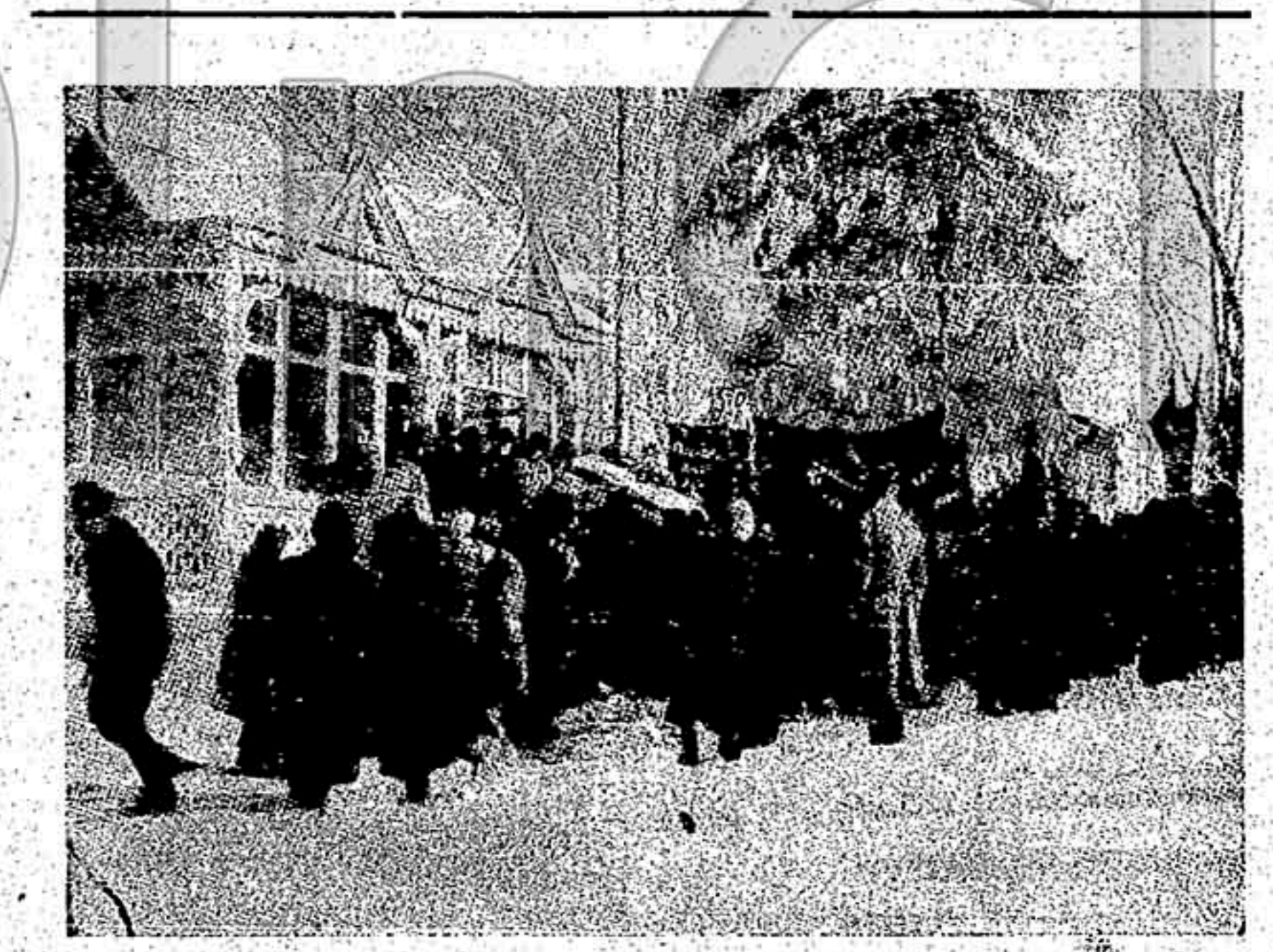
Camaradas sacando el ataúd de la casa de Kropotkine.

económica de Rusia. Todo eso, en su conjunto, nos sirve de clave principal para la solución del problema. En cuanto a todo lo que tuvo ocasión de ver y de vivir en Rusia, todo eso confirma plenamente la excelencia de esa clave.