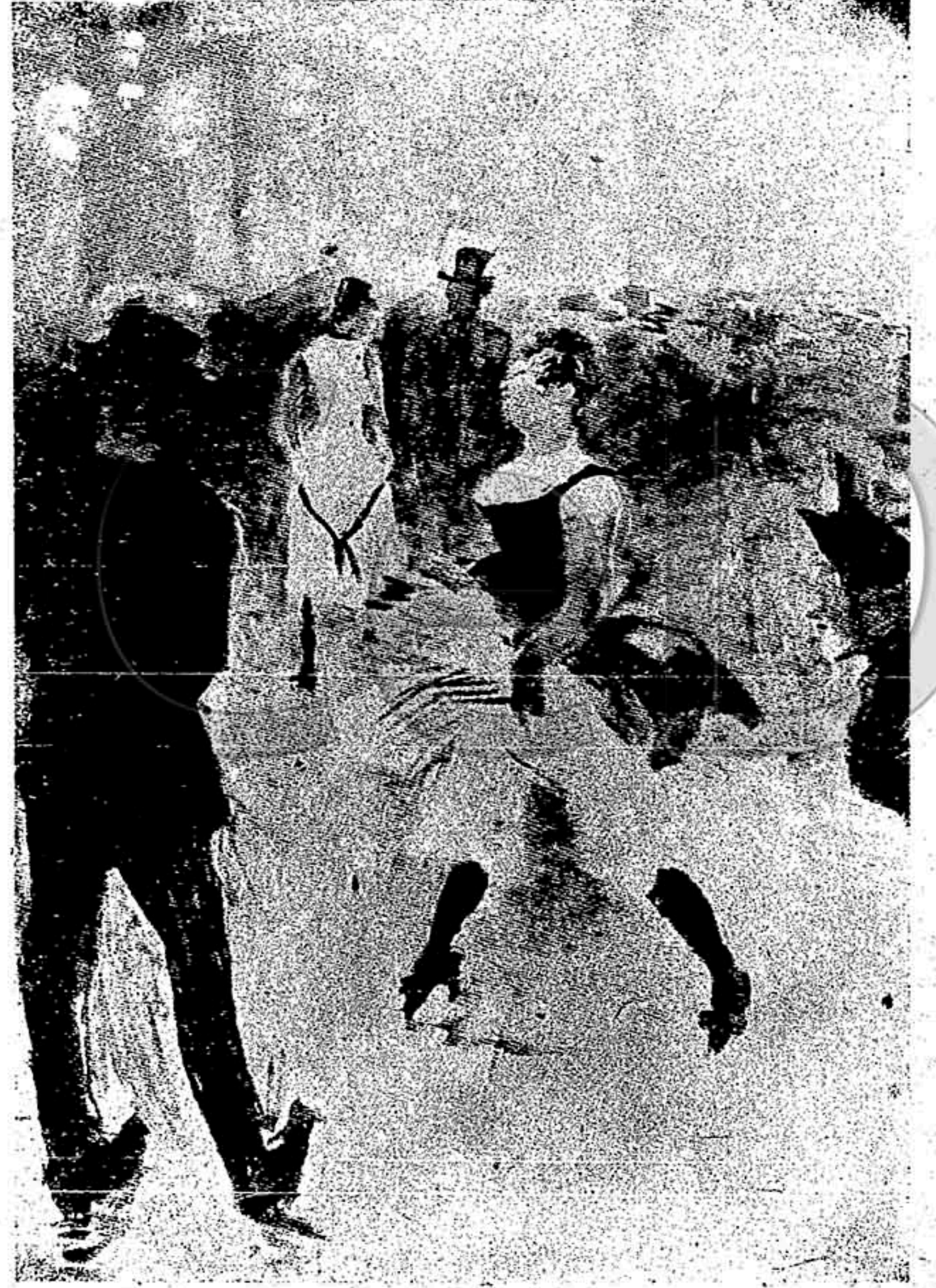
EN EL MOULIN-ROUGE

(bajo el pabellón "comunista") las raíces de un capitalismo de Estado sufrió una derrota completa y se demostró absolutamente infructuoso. (Tendremos, más tarde, ocasión de hacer resaltar que ese ensayo no puede generalmente dar frutos).