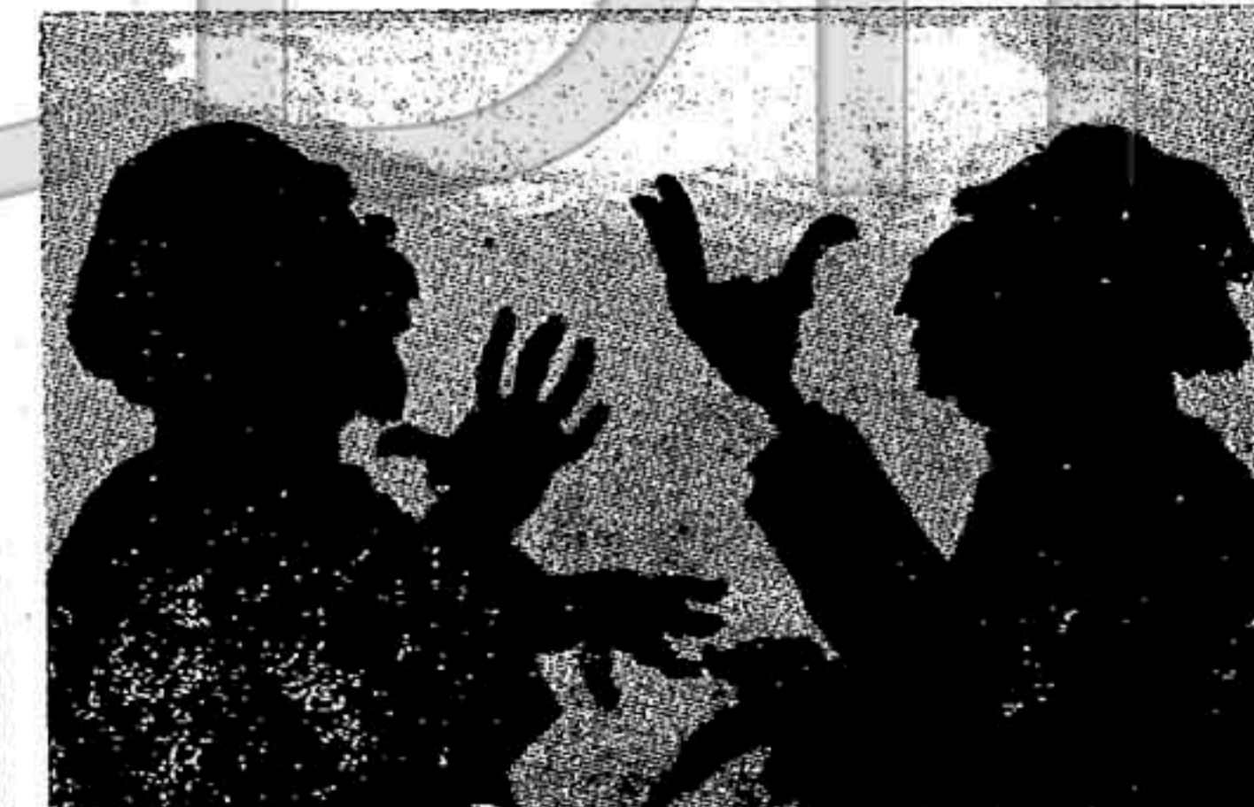
Y, tras el telón, los arreglos amistosos