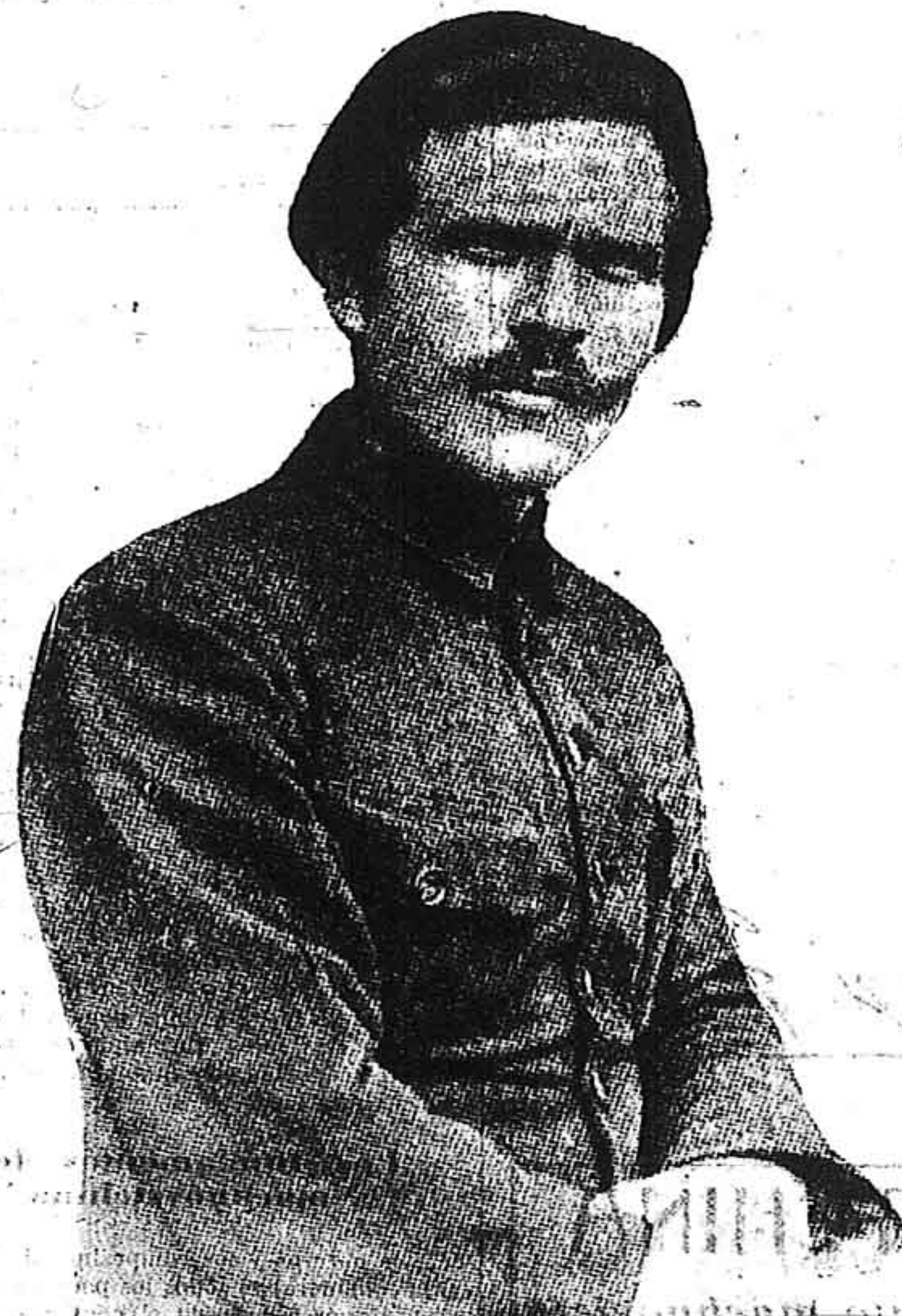
NESTOR MACHNO (Preso en Polonia)

1918 dió a la energía revolucionaria de los campesinos y de los obreros una dirección un poco específica.