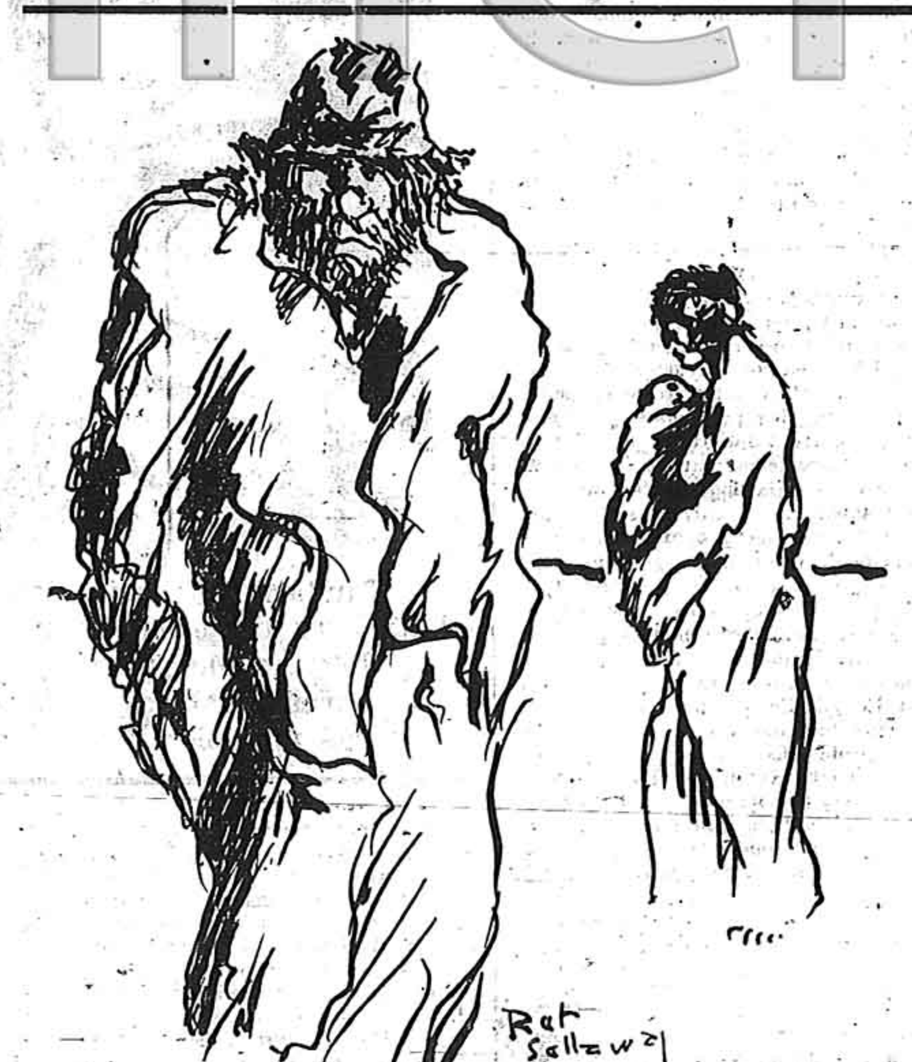
EL FILÓSOFO: — ¡Un nuevo hijo de proletario! Futura carne de fábrica o condenado a arañar la celda.

Le sucederá como al perro de referencia: mientras aquel es un "tigre" que ladra y guarda el gallinero, éste será un "león" que sale al picadero a darse de