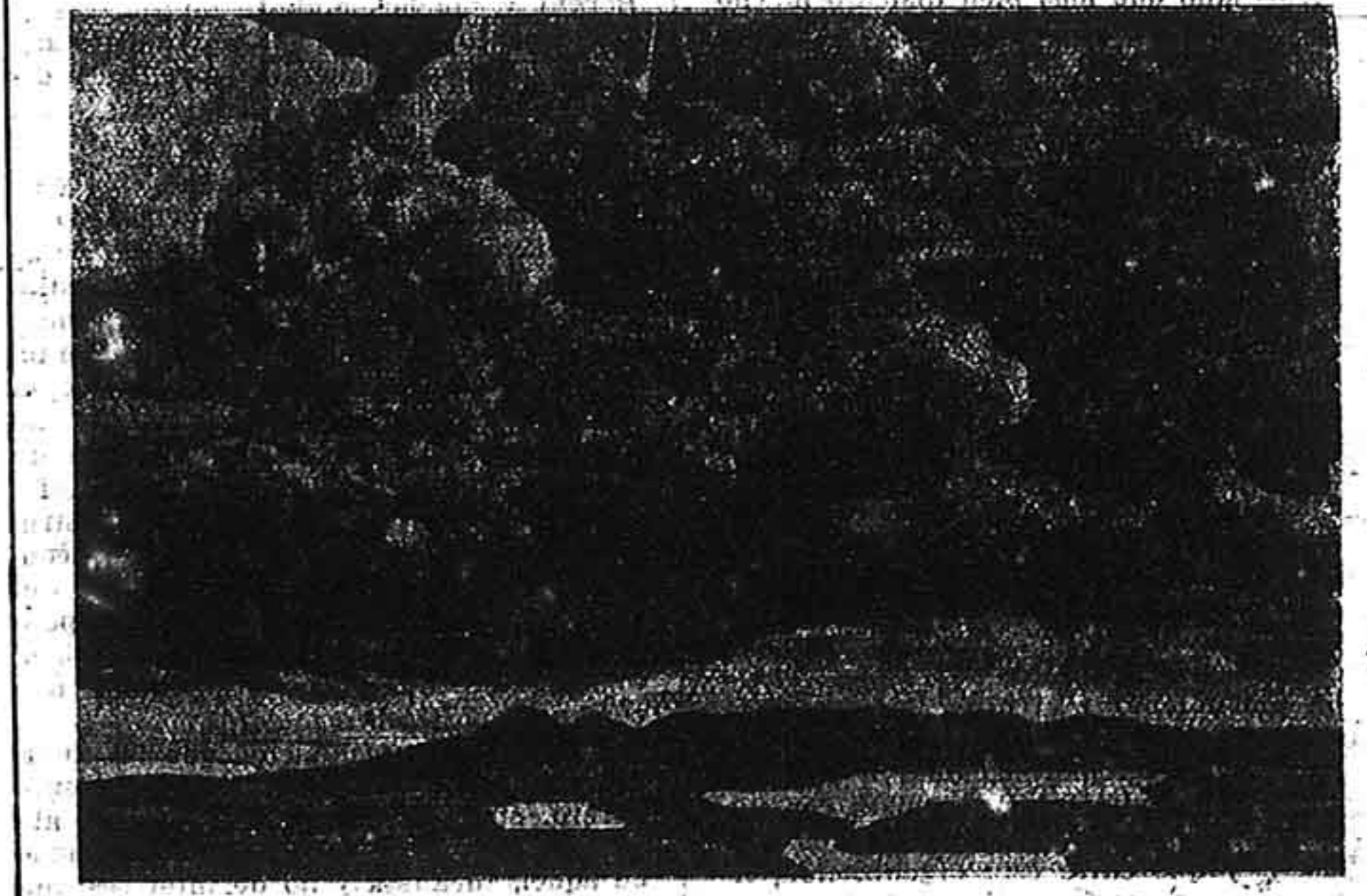
ROERICH — Batalla en nubes

Si en Roerich se encuentra un arqueólogo y un sabio, en el fondo de su obra es el paisajista el que prima. La escuela de paisajes en Rusia es una de las más in-