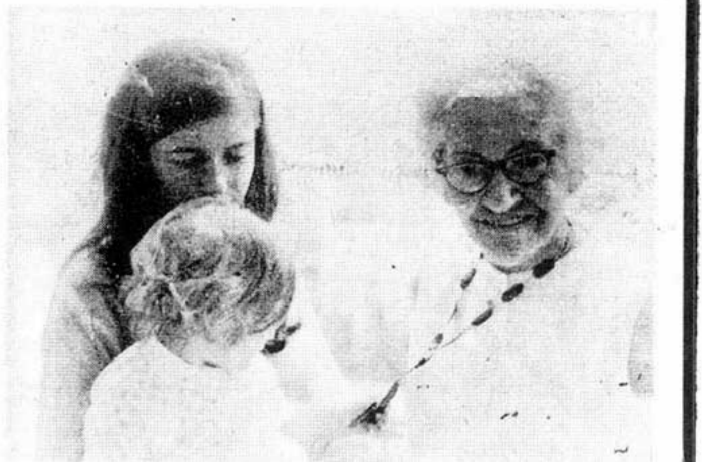
La Directora de Cristianismo y Revolución, con su hija y la madre de Camilo Torres

En cinco años de existencia, Cristianismo y Revolución editó 31 números y creció desde la irregular aparición en tiradas de mil ejemplares hasta su periodicidad mensual con tirajes de más de 20.000. Este hecho, su influencia, —su arriesgada defensa de las luchas del pueblo— fue demasiado para la tolerancia del Gran Acuerdo Nacional; de allí la clausura, los procesos, la prisión.