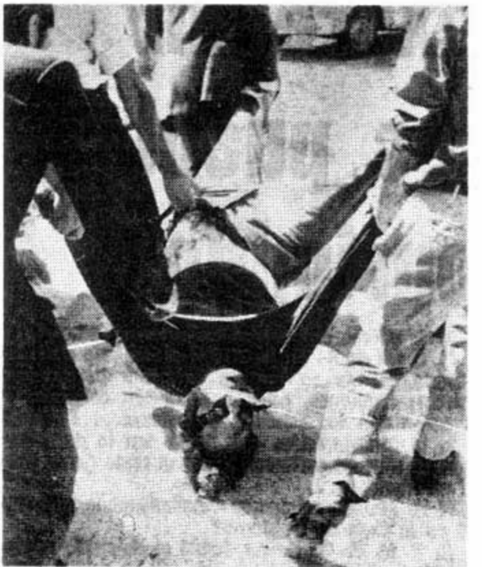
mentan estas reacciones—, se puede deducir de este hecho que la generalización de cordobazos y mendozazos en el país, se da a través del trabajo de base.