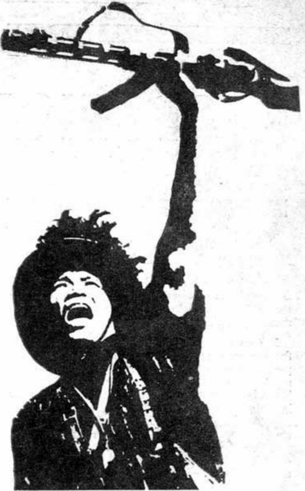
El 22 de abril, día Internacional de Solidaridad con Vietnam, se celebra en todo el mundo con eco de victorias y triunfos revolucionarios en la península indochina.

El pueblo vietnamita, con sus hermanos de Laos y Camboya, emprende los pasos finales en su larga guerra contra la agresión imperialista de los Estados Unidos, destruyendo el mito de la "vietnamización" y redoblando sus combates, con mayor decisión que nunca.