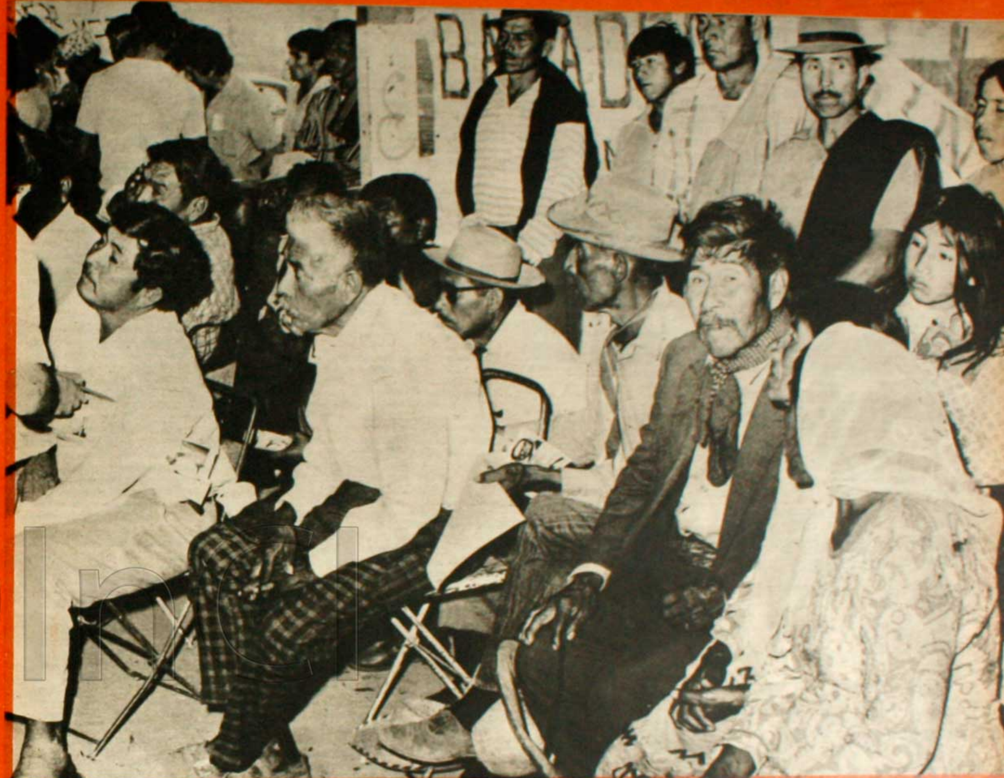
Campeños pobres de las colonias aborígenes vinieron en masa al V Encuentro después de una decisión tomada en reunión de caspique.