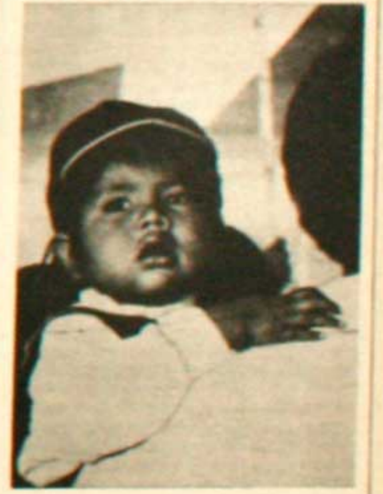
Un chango hacia el hombre nuevo

tura de nuestros hijos, pensamos que nuestros hijos hagan su cultura para poder defender su propia razón y derecho, pero con su cultura, también necesita más hospitales con médicos permanentes y también los medicamentos gratuitos. Compañeros, en el campo donde los aborígenes viven aunque quizás haya una escuela pero no han tenido útiles para nuestros hijos, pero nuestros hijos no han podido asistir a la escuela cumpliendo con su de-