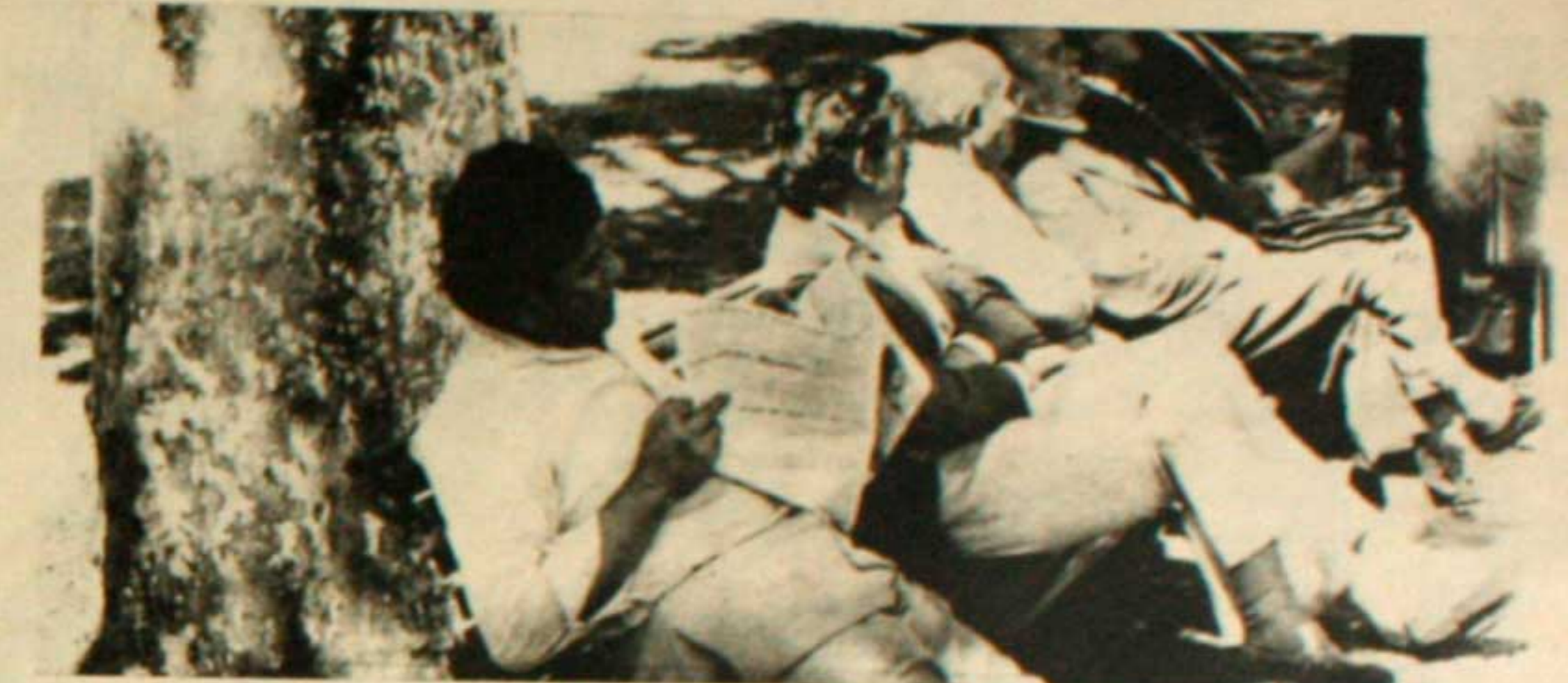
La bronca de rajar los tamangos

En esta nota analizaremos solamente los problemas generales de la desocupación y sus derivaciones. La cita incluida más allá de los distintos intereses firmantes del documento, y de ser emitida en plena campaña electoral, es un