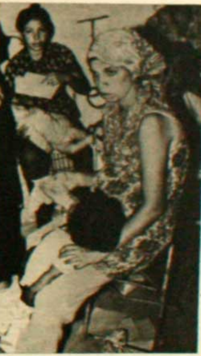
"Che Guevara, los pibes se preparan"