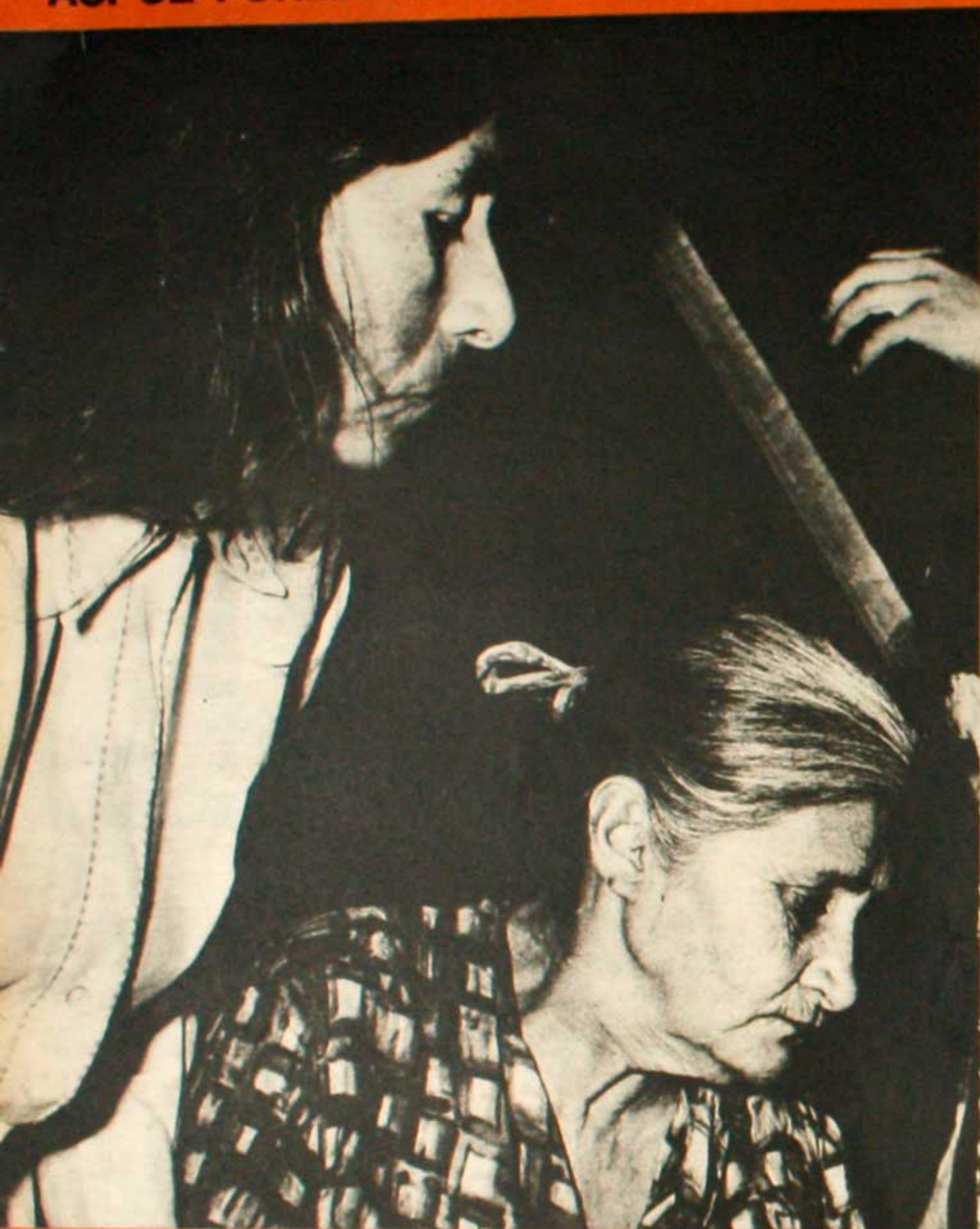
Mujeras solteras en el FAS.