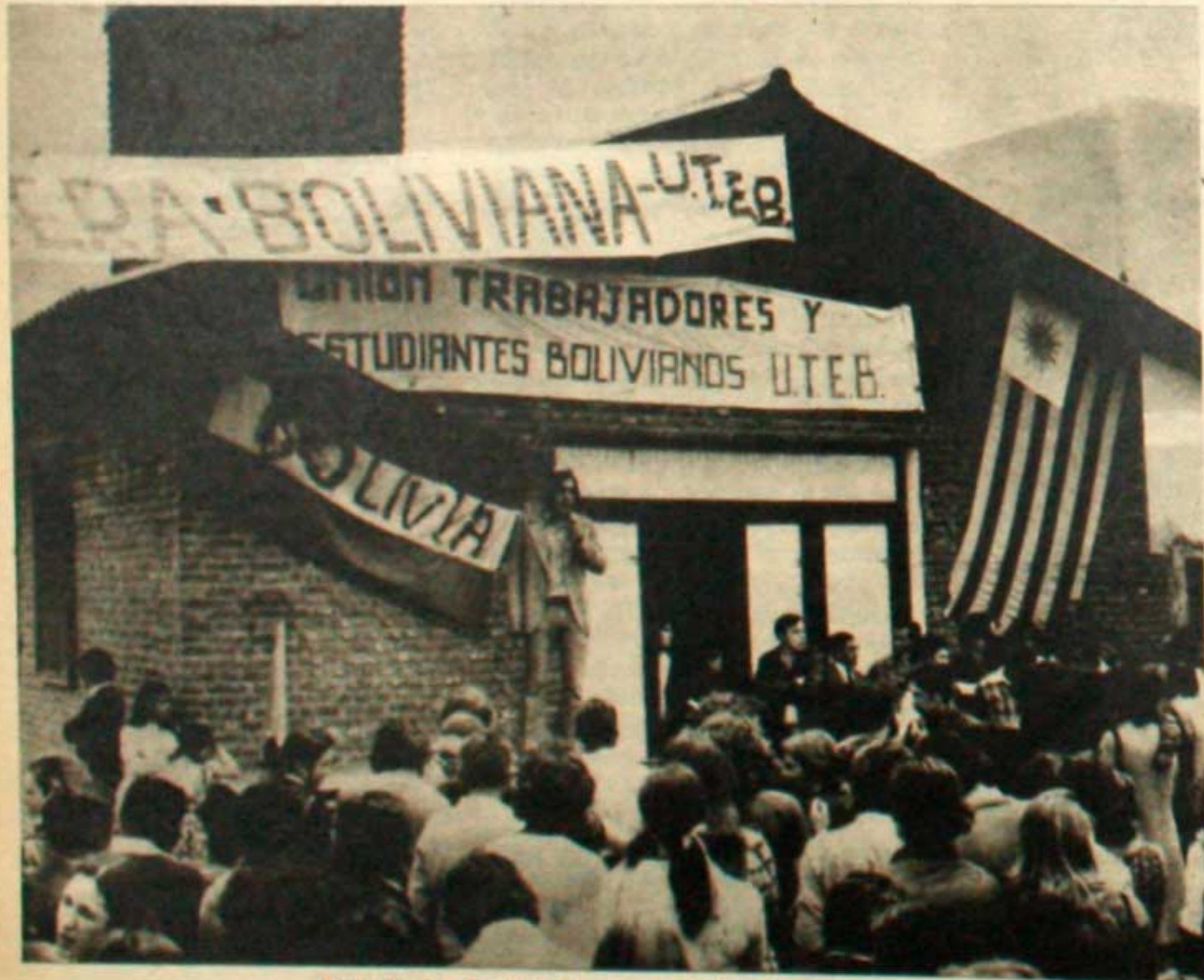
Repudio al fascista Banzer en Villa Comunicaciones.

Por supuesto que el plan del Ministerio de Bienestar Social (denominados Alborada, 17 de Octubre, etc.), está amañado para que los villeros no participen ni en el control ni en la dirección de las obras. Y lo que es peor, ni siquiera los villeros tendrán la posibilidad de habitar las casas.