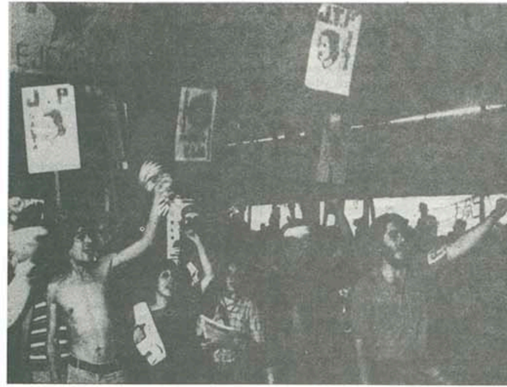
La juventud de todo el país con el FAS.

Entonces, compañeros, ése es el sentido de nuestra palabra, de nuestro mensaje, de nuestro saludo, a este quinto congreso del Frente Antimperialista por el Socialismo. Compañeras, nuestras tareas deben ser la unidad revolucionaria, la organización revolucionaria para la lucha revolucionaria, en base a la verdad revolucionaria, a la razón revolucionaria, y a la moral revolucionaria (aplausos). (Se sienta, se sienta, así se forma el Frente). Compañeros, quedamos entonces en que ése es el sentido de nuestro mensaje: El presente es de lucha y el futuro es nuestro: ¡Patria o Muerte... Vencemos!!!