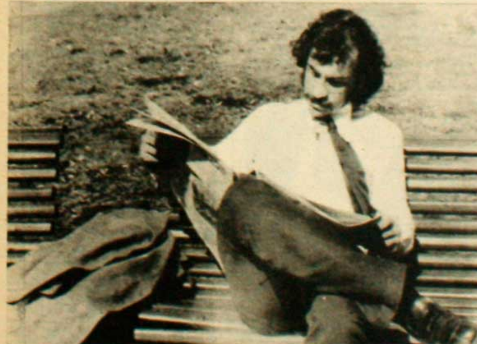
Desocupado en la búsqueda desesperada.

Es evidente que este aspecto de la "cuestión social" constituye quizá la muestra más clara del grado de pauperización y de explotación social que deben soportar la clase obrera y la mayoría de los asalariados en nuestra patria. A su vez, es la prueba más evidente de la irracionalidad capitalista: el derroche de fuerzas productivas (recordemos que la principal fuerza productiva es el trabajo humano vivo) tanto de las reales como de las potenciales.