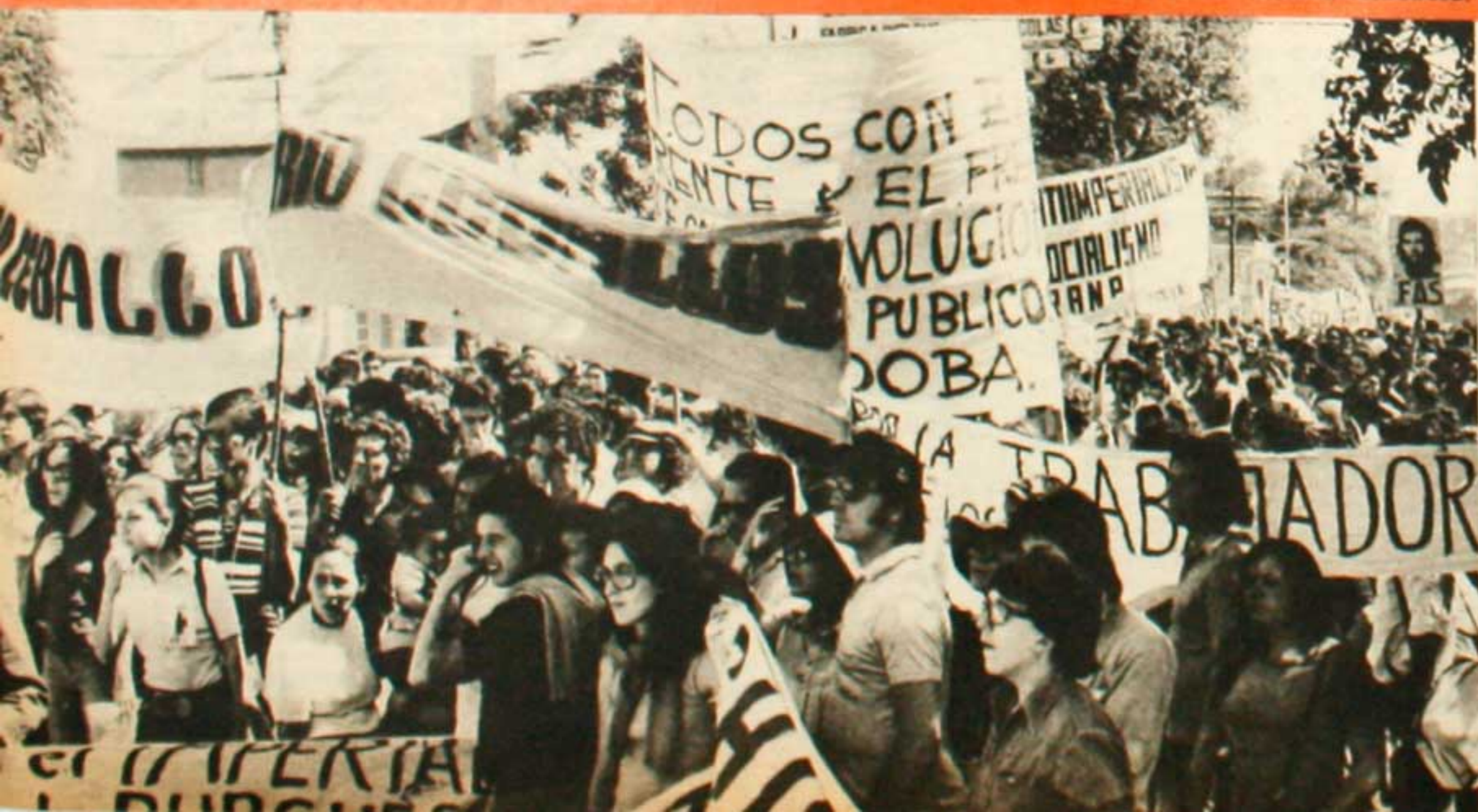
Parte de la columna cordobesa.