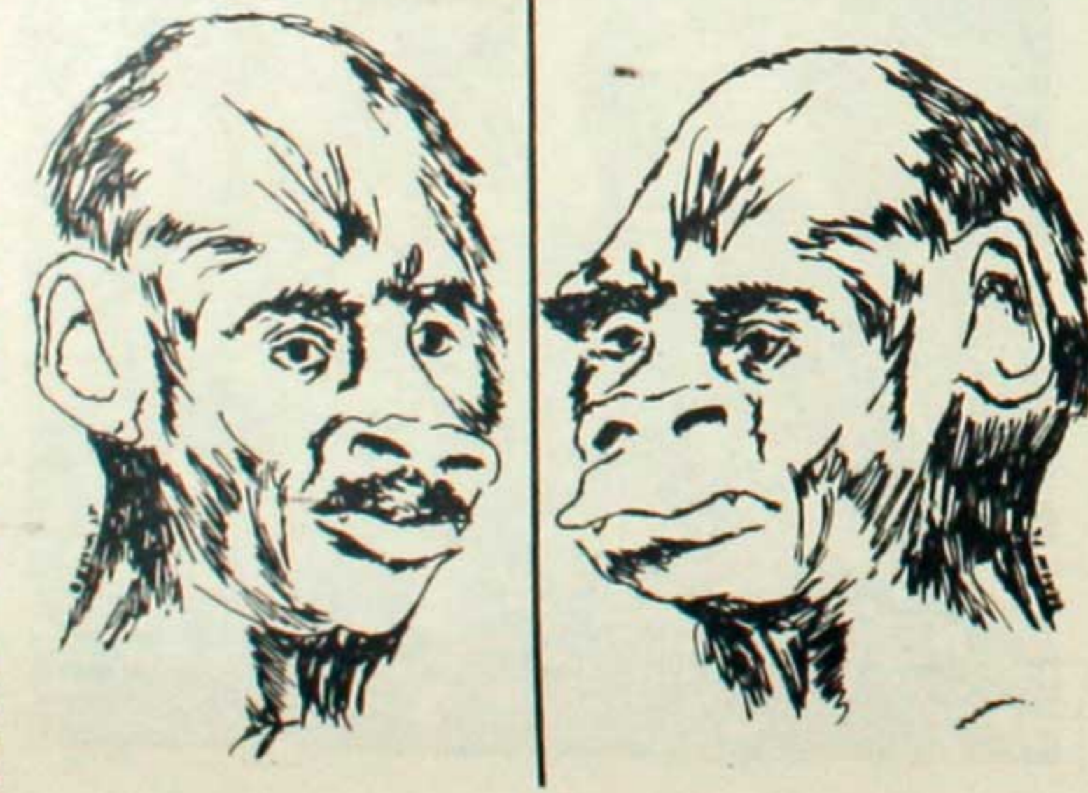
Gen. Hugo Banzer Suárez

lidos por las tropas al mando de Villarroel quien, al dirigirse a la multitud, amenaza con utilizar las armas "ante cualquier acto de violencia". Y así lo hizo, cayendo ese día las primeras víctimas obreras.