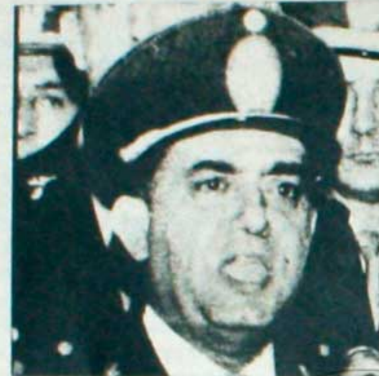
Cáceres: Uno de los más impopulares jefes policiales argentinos.