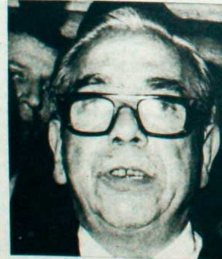
Iniguez: más que policías argentinos seremos argentinos policías.

bien claro que solo habrá paz para los que ejercen el sometimiento a la paz. Desgraciadamente, en el poco tiempo en que yo he tenido que participar de alguna manera en sus actividades, en numerosas oportunidades he debido asistir al sepelio de algunos de los integrantes de la policía caídos en la lucha contra el delito. De esta manera, es fácil criticar desde afuera, pero debemos advertir lo que es el esfuerzo de la policía. Eso lo pongo a consideración de todos mis conciudadanos y espero que la colaboración de todos haga más fácil la tarea de reconstrucción en la que todos, nos guste o no, estamos empeñados. Nuevos hombres ocuparán los puestos que por obra de la intemperancia de unos pocos quedan vacíos en la policía. Ellos también llevarán adelante el proceso de paz y seguridad dentro de las orientaciones y órdenes de la superioridad".