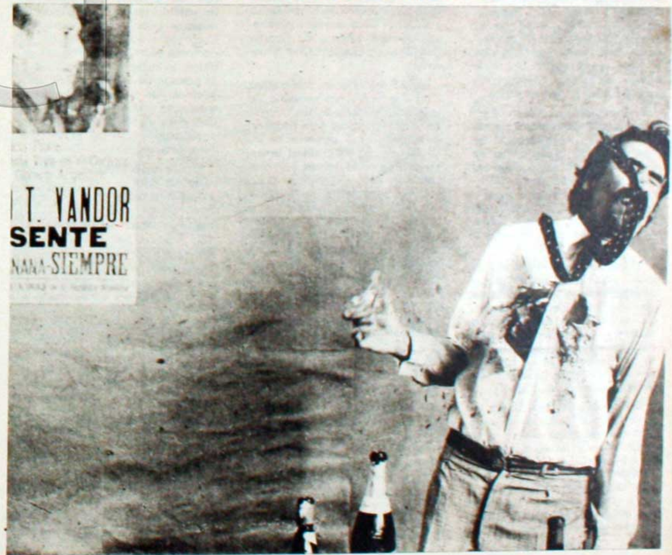
La muerte de Barrera, el burócrata sindical de la película "Los Traidores".