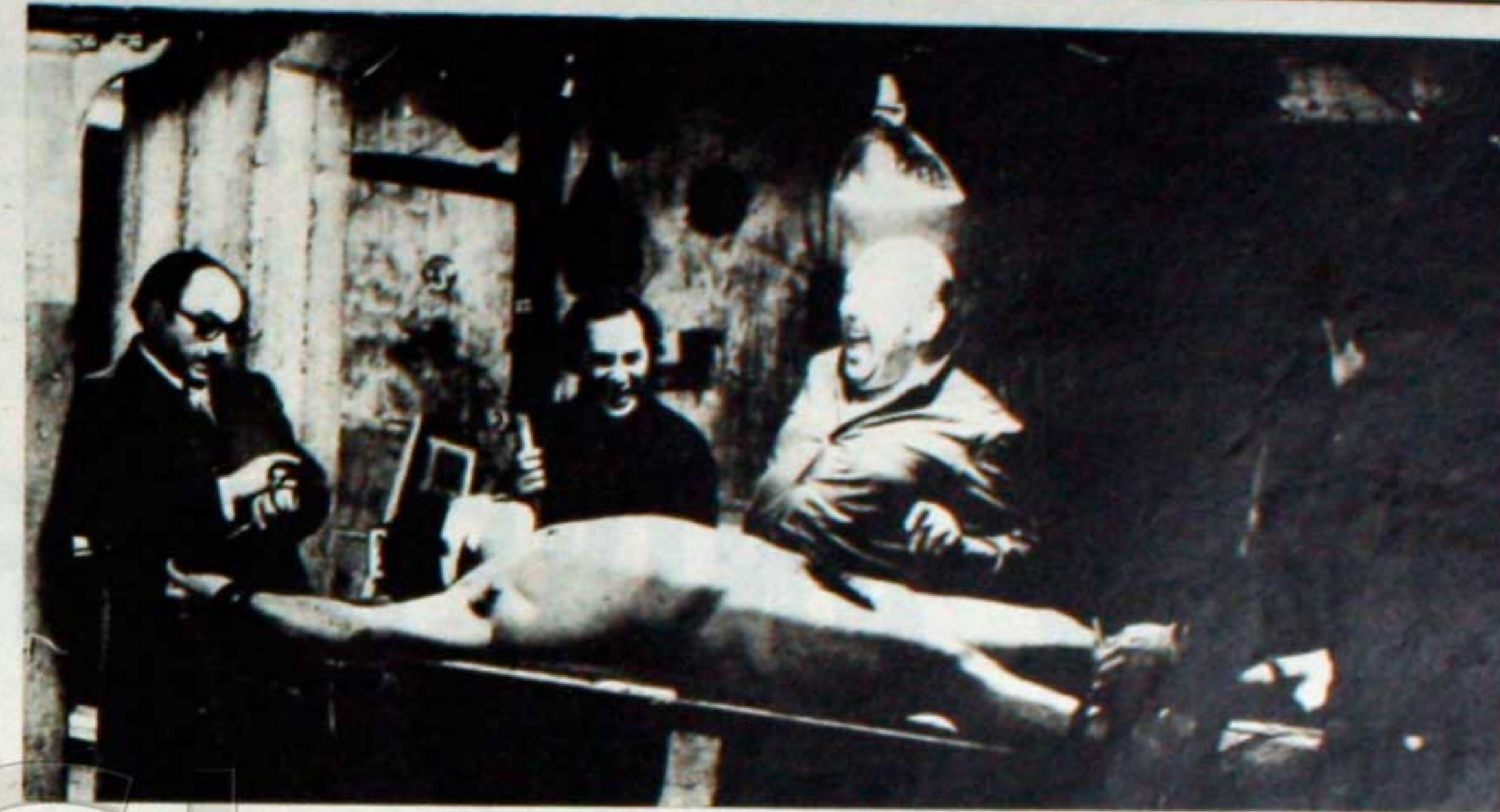
La tortura es una realidad que sufre el pueblo, reflejada por el cine en "Los Traidores"