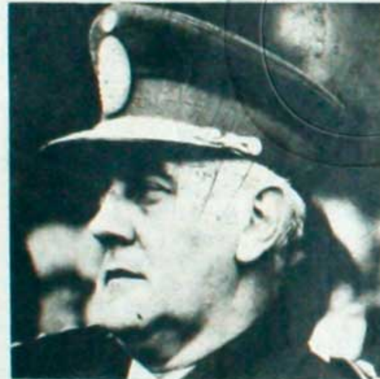
Lanusse: Confundía la paz con el sometimiento total del pueblo.