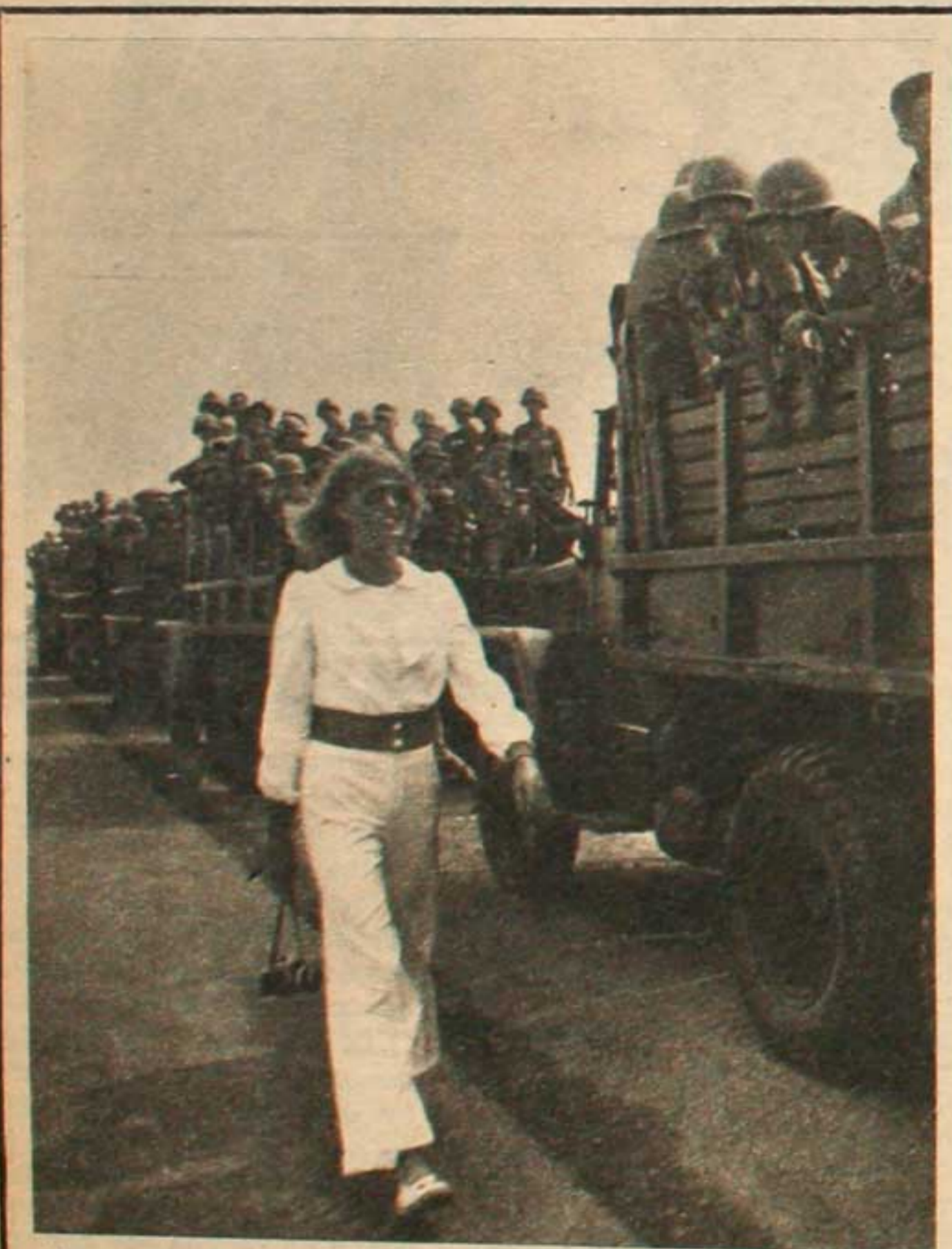
La paz que nosotros queremos es aquella que organice la clase trabajadora en el poder. Y sin la necesidad de beber ningún estimulante alcohólico como necesita la burguesía para diluir su ansiedad de consumo impuesta por el capitalismo.

Para consuelo de Vázquez, que nos regala sus "creaciones", con tanto vocación militante de camiseta, para encontrarse con la incompreensión popular, le decimos que tal vez lo que suceda, es que al pueblo no le alcanza el sueldo que le pagan "los buenos que no lo pueden demostrar", para comprarse un televisor y encontrarse al fin con la genuina ideología de la "caridad cristiana", que tan "honestamente" practican Vázquez y su maestrillo.