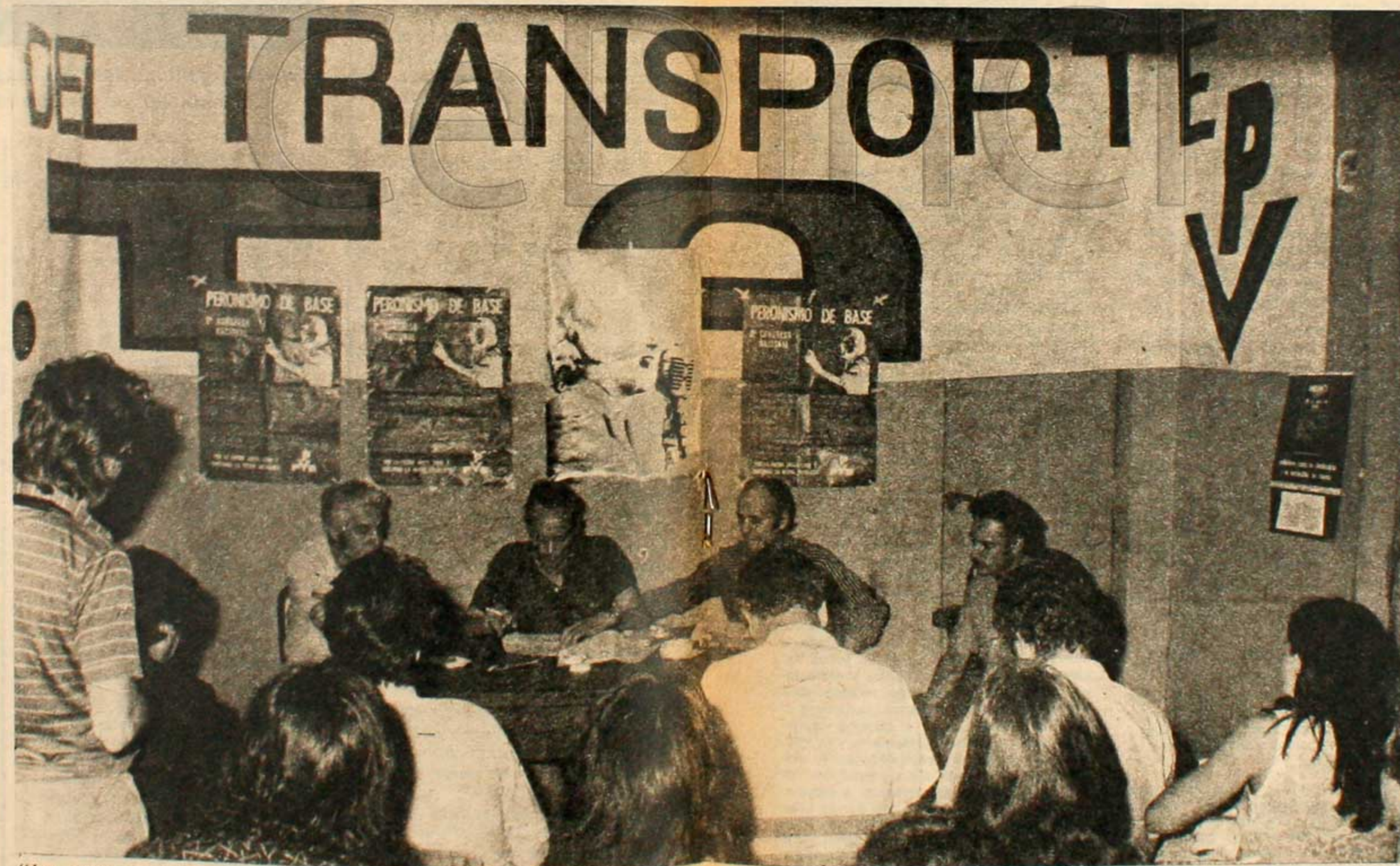
"La actual política del gobierno es la implementación del proyecto de renegociación de la dependencia que venimos denunciando con anterioridad al 11 de marzo de 1973."

Nosotros hemos dicho y así lo asumimos, que el PB no es la con-