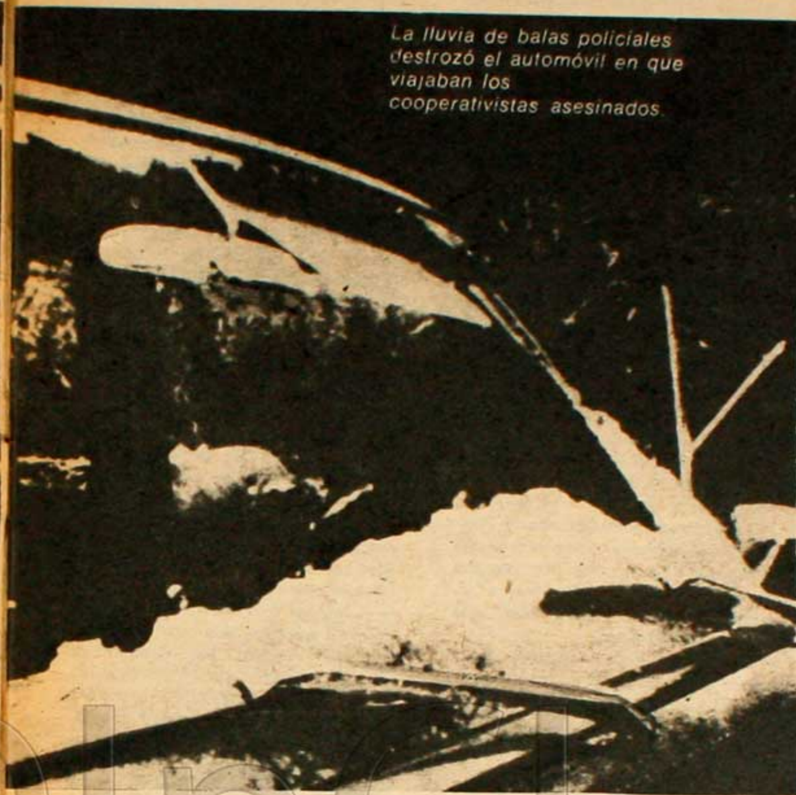
La lluvia de balas policiales destruyó el automóvil en que viajaban los cooperativistas asesinados.