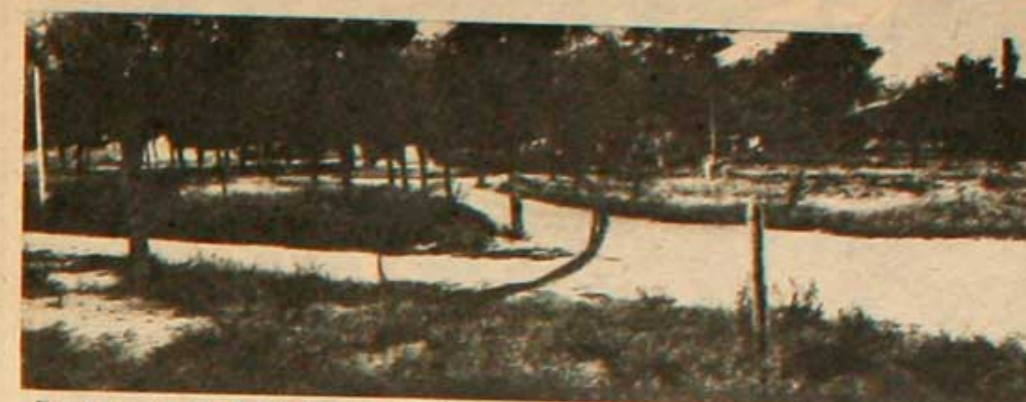
En el lugar señalado por el círculo se produjo la masacre de los cooperativistas e manos de la policía.