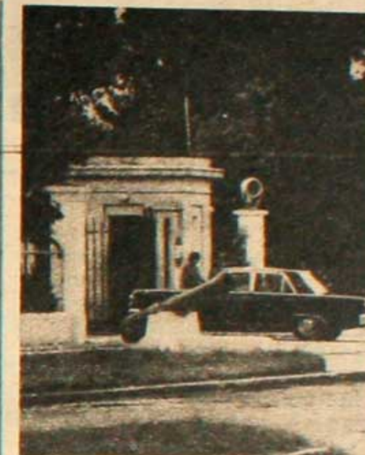
Grupo 1 de Artillería Blindada, Azul.