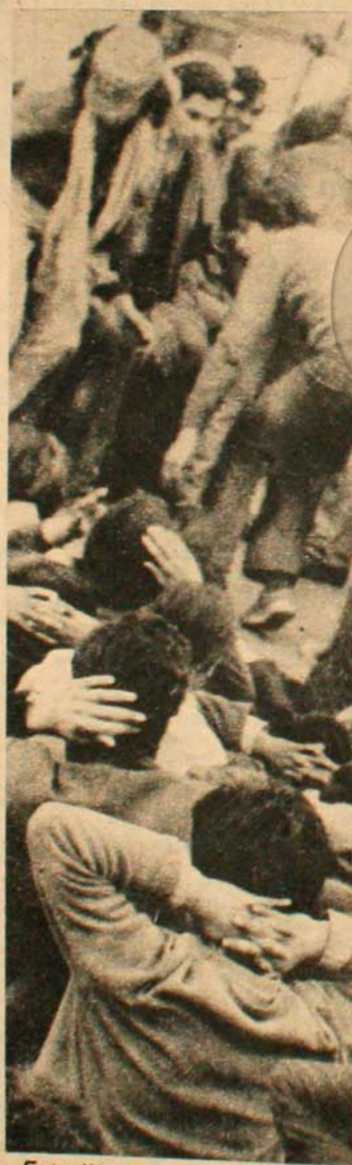
Estudiantes son asesinados y encarcelados.

Esto sucede con las carreras técnicas sociales (ingeniería, medicina, arquitectura, etc.), donde la deformación se produce no en la ciencia en sí, sino en