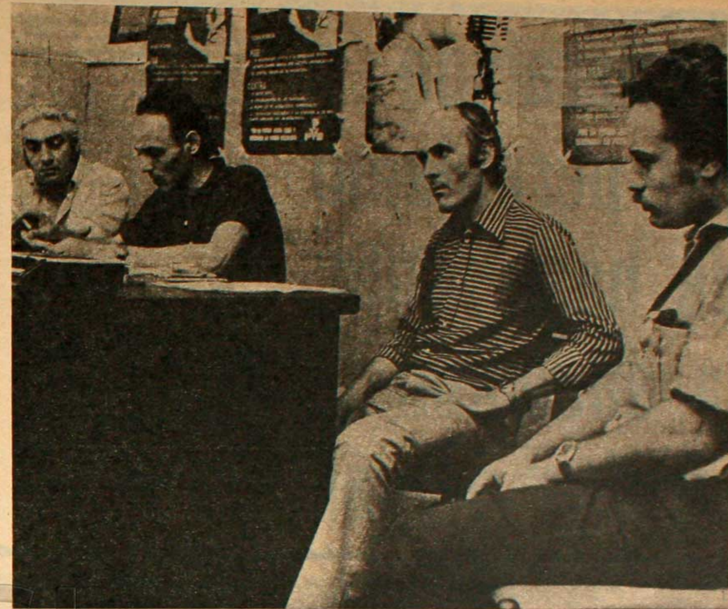
“En la Argentina, las 100 empresas como la DUPERIAL son las que gobiernan. Esta es la realidad”, expresan los dirigentes del PB ante la situación política actual.

to Social y nos morimos de hambre o luchamos contra el Pacto Social y contra el hambre. Además de dejar señalado con esto de algún modo el por qué cuando decimos que el proyecto de liberación nacional que supuestamente se pretende desarrollar es inaplicable en la Argentina. Porque en la Argentina las cien empresas como la Duperial, son las que gobiernan el país, esa es la realidad y con este pequeño ejemplo tratamos de demostrarlo. Duperial puede paralizar el país y no va a atentar contra el Pacto Social durante treinta días en la Argentina. Además después venderá el polietileno al precio que mejor le convenga, y como eso los cigarrillos, etcétera.