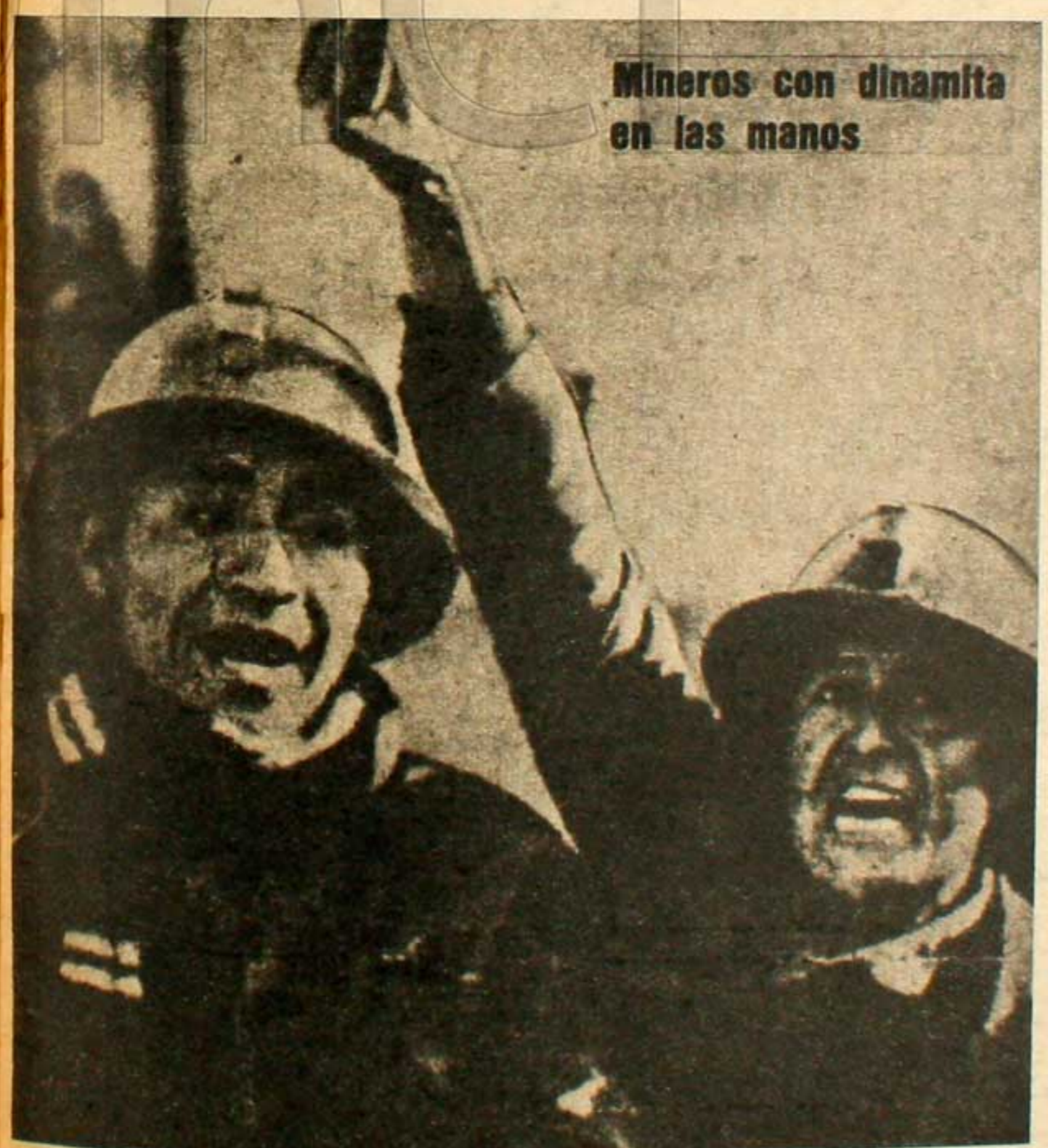
Mineros con dinamita en las manos

sin vacilar por los lacayos del imperialismo yanqui como "agitación extremista manejada desde el extranjero". Los pueblos en América latina, para estos señores, son extranjeros en su propia tierra. El capitalismo cada vez más desgastado apela a su intento extremo cuando las papas queman: el fascismo. La represión violenta es la única institución que lo respalda y lo resguarda de su verdadero enemigo: la conciencia cada vez más alta y la organización cada vez mayor del pueblo. Banzer habla de exterminar a los agitadores comunistas" pero se allanan las chozas de los campesinos y, también, son campesinos los muertos. Los remanidos slogans antiextremistas no engañan hoy a las masas desposeídas, que cada día que pasan en el hambre y la miseria, ubican mejor quién es su enemigo fundamental: la burguesía aliada al imperialismo. Si bien en estos momentos Bolivia parece retornar a la "normalidad", después de casi dos semanas de violentas movilizaciones populares, persiste un clima de tensión y se esperan nuevas manifestaciones de la lucha popular, ahora no sólo por las medidas económicas decretadas, sino como respuesta contra la nueva masacre cometida por el gobierno fascista de Banzer.