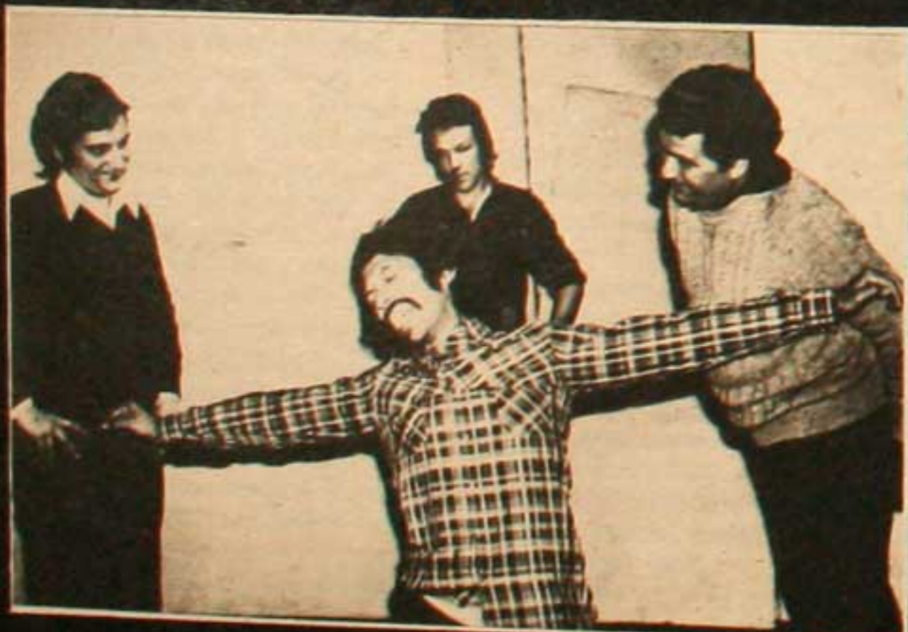
GRUPO DE ARTE "A PROPOSITO"

A PROPOSITO DE LA LUCHA, es un espectáculo que basado en una propuesta anti-burocrática, uno de los ejes por donde pasa la lucha en nuestro país, propone una nueva forma de organización para la clase obrera. Organización ésta que se basa en una auténtica democracia a través de la participación colectiva del proletariado en la discusión y ejecución de las medidas de lucha. "Hasta allí llega el planteo de la obra. Lo que hace que básicamente coincida con la mayoría de las tendencias políticas, permitiendo así que cualquiera de ellas capitalice nuestro trabajo, para desarrollar una discusión política que profundice las propuestas".