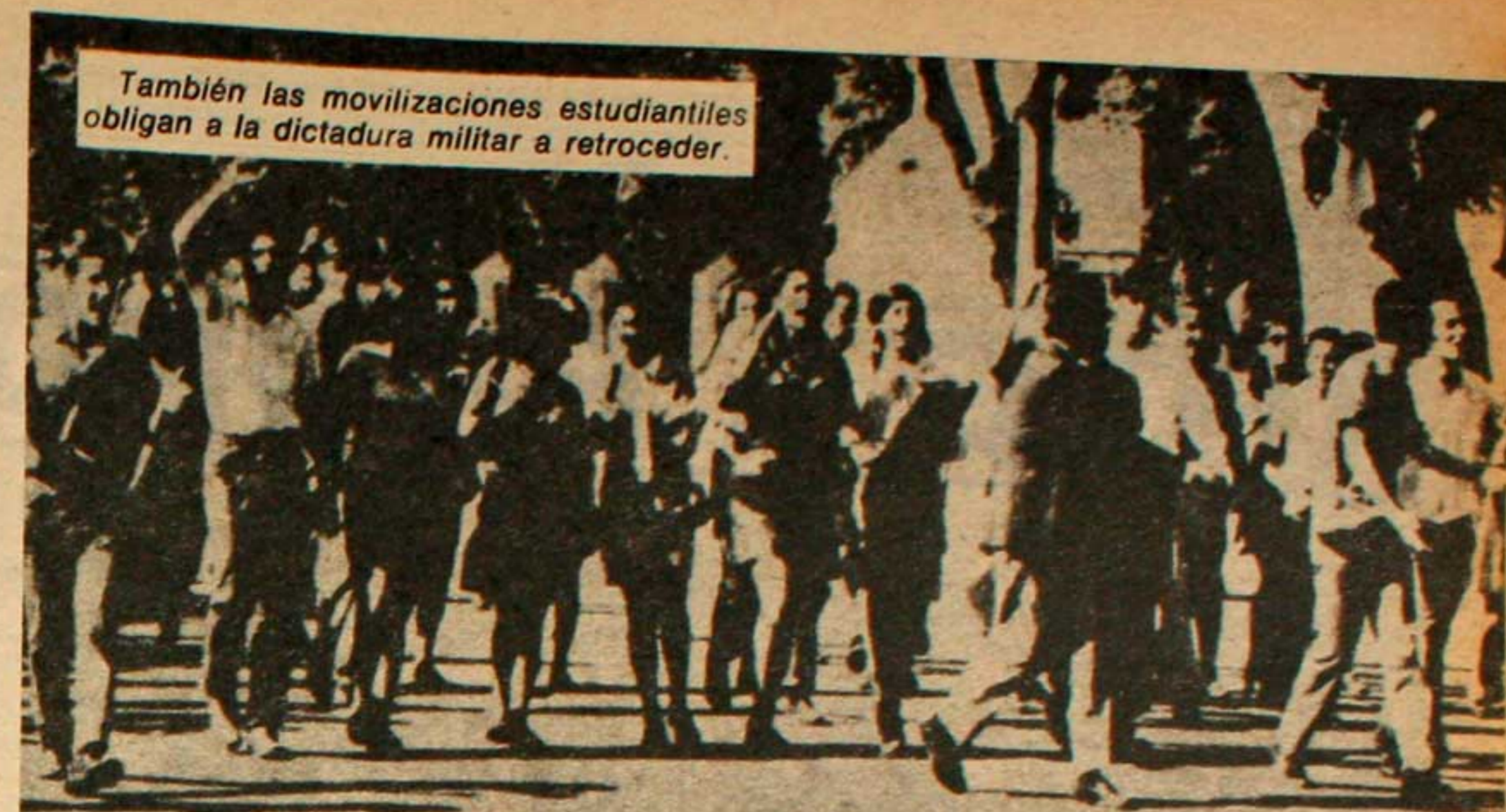
También las movilizaciones estudiantiles obligan a la dictadura militar a retroceder.

Para concretar su plan el poder militar-imperialista intervino la Universidad, barrió con la autonomía, eliminó la libertad académica, cesanteó a cientos de profesores progresistas, impidió la participación estudiantil en el gobierno universitario, disolvió los centros estudiantiles, prohibió todo tipo de actividad política, estructurando judicial-