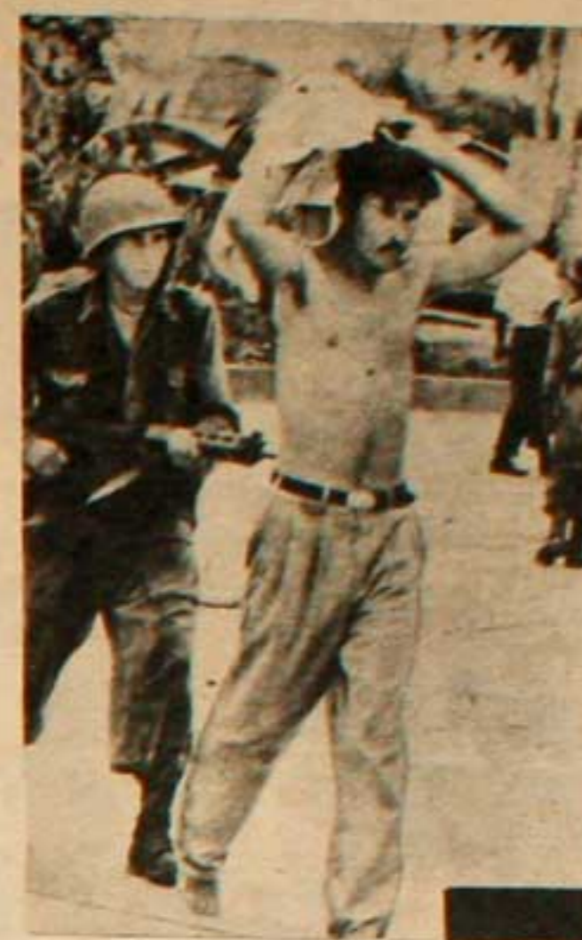
ra en la región. El otro es Brigada Campesina de Ajudiciamiento del Partido de los Pobre, comandada por Lucio Cabañas, principal líder guerrillero del país.

Coherente con la lucha que está librando el FRELIMO, se ha organizado un Frente de Liberación Nacional de Angola, de carácter anticolonialista. Evidencias de esta organización son el reclutamiento de angoleños y una intensiva preparación militar con miras a asestar un duro golpe al colonialismo portugués, el cual poco a poco comienza a replegarse a causa de la ininterrumpida y larga guerra revolucionaria del pueblo africano.