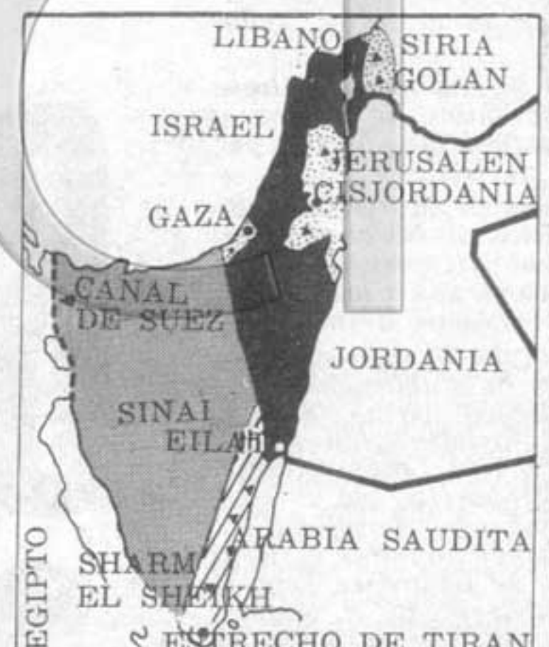
Concesiones máximas de Israel: las zonas punteadas autónomas, pero con presencia militar israelí, el Sinaí desmilitarizado, restituido a Egipto (en gris en el mapa), excepto una faja que va de Eilat a Sharm el Sheikh (zona rayada). Jerusalén seguiría en manos de Israel.

cuartelazo "procomunista". Las cabezas del golpe no logran hacer pie luego de las primeras 24 horas, que apenas alcanzan para proclamar una "república popular independiente". Luego, Hashem al Atta y Babakr al Nour son liquidados, el primero en la capital Khartoum y el segundo en Benghazi (segunda ciudad libia), en donde es detenido al obligarse a descender al jet que lo trae de su exilio londinense. Destruído el dúo Atta-Nour, el reemplazo Nimeiry encarcela y termina colgando a Abdel Khalek Mahgoub, secretario general del PC sudanés. El drama ha concluido y el señor Nimeiry telefona al presidente egipcio Anwar al Sadat y al efervescente Gaddafi de Libia para agradecerle el apoyo prestado. En cambio, Khartoum rompe relaciones con Irak, que había sido el