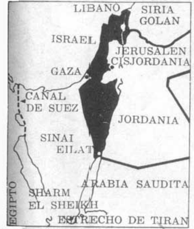
El Medio Oriente en 1949, luego de la primera guerra árabe-israelí. Los países árabes reclaman hoy que los israelíes se retiren a la zona marcada en negro; de tal modo Israel tendría asegurada su integridad y su reconocimiento.

Si de esta breve historia, mil veces repetida en el pasado inmediato, falta el eco de las multitudes, se sabe ya que no es olvido del cronista. Entre tanta maniobra, entre tanto ir y venir a y desde palacios inaccesibles, no sobresalen sino coroneles prepotentes y generales con cara de malos. Al Medio Oriente no hay que tomarlo en broma, pero el hartazgo y la rebelión que estructuran la conciencia revolucionaria parten de la descripción