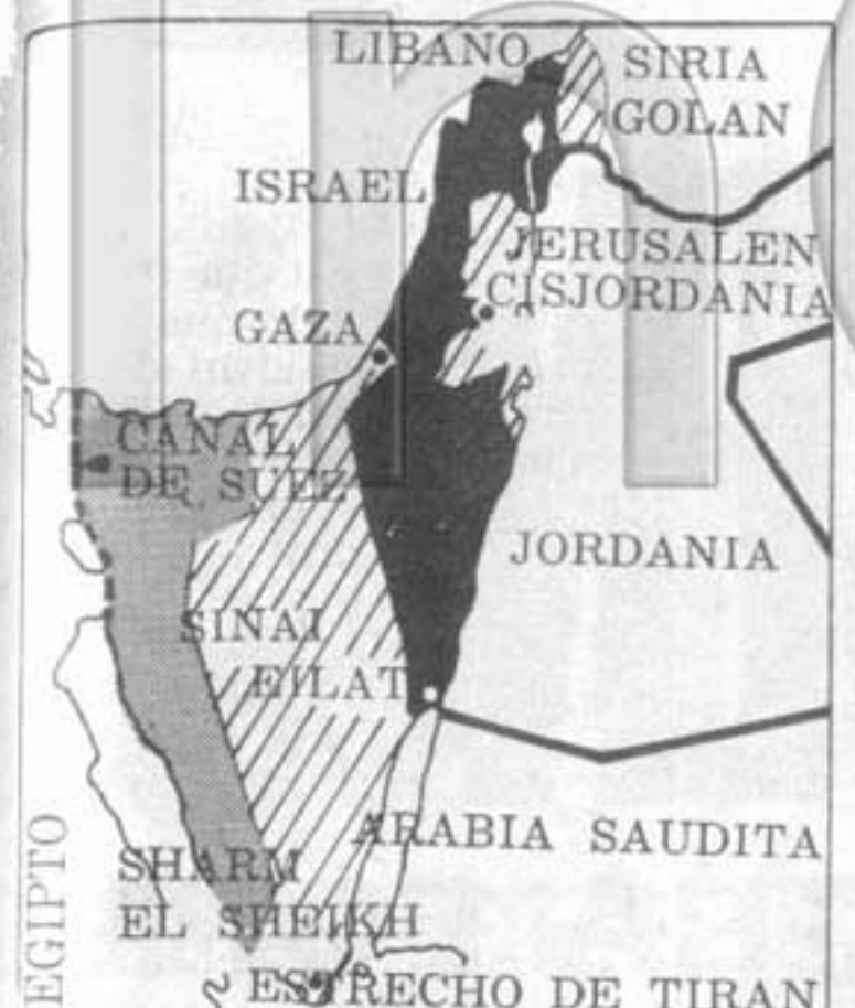
Máximas reclamaciones de Israel: anexión de parte del Sinaí, de Golan, Gaza, Jerusalén y Cisjordania (rayadas en el mapa), cesión de una parte del Sinaí (en gris) a Egipto, apertura del Canal de Suez y del estrecho de Tiran.