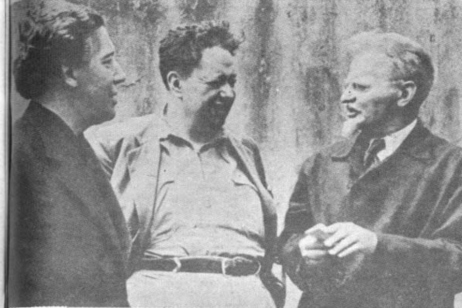
(En 1938, el poeta surrealista André Breton realizó un viaje a Méjico, donde se puso en contacto con León Trotski, al que admiraba desde hacia tiempo, y el cual permanecía como huésped en casa del pintor Diego Rivera. Exaltados por la similitud de ideas, lanzan un manifiesto donde invitan a unirse en una perspectiva emancipadora a todos los artistas revolucionarios del mundo).

¿Cómo se concilia la creación artística con la finalidad de una lucha por la liberación del hombre? ¿Cual ha de ser la forma de una cultura de vanguardia frente a las "culturas" oficiales caducas? Estas preguntas cobran hoy enorme vigencia ante la realidad insurgente que estalla en toda América Latina. El "Manifiesto por un arte revolucionario independiente", los textos de León Trotski sobre cultura y revolución, su correspondencia con el poeta André Breton, la carta abierta redactada por este último (y otros intelectuales) en defensa del líder revolucionario ante el sistemático ataque de que era objeto por parte del estalinismo y de la reacción, así como los textos del mismo Breton, tienen el valor por encima de la personalidad de sus protagonistas, de contribuir como aporte histórico, como datos de una época donde ya, intelectual y revolución socialista comenzaba a ser un tema de cuestionamiento. Hoy, tal vez con menos ilusión que la que reflejan estos textos, podemos encontrar en los mismos, fundamentales antecedentes para el actual nivel de discusión.