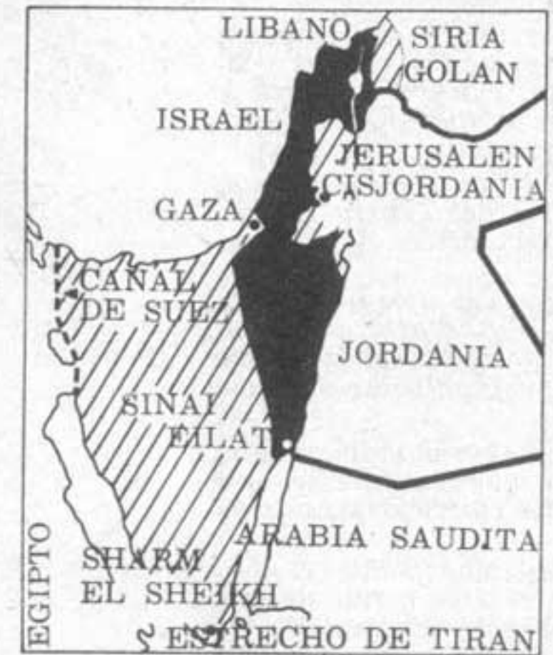
Luego de junio de 1967, las zonas ocupadas por los israelíes, rayadas en el mapa, son: Sinaí, Gaza, Sharm el Sheikh, Tiran (todas de Egipto), Cisjordania (de Jordania) y las alturas del Golan (de Siria).