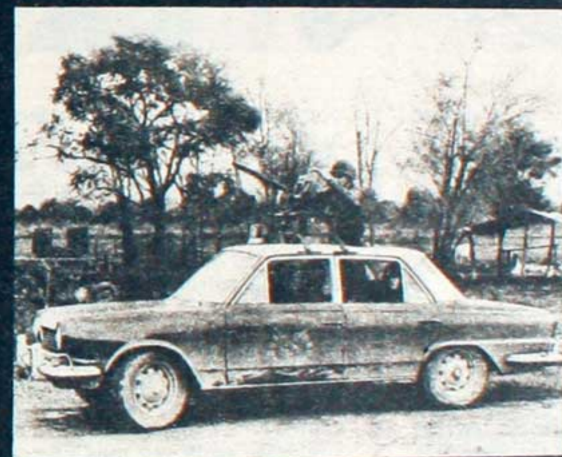
Las armas prontas a actuar, demostraron que en el "gobierno popular" se ataca a la clase trabajadora y a su vanguardia.

Obrera de Avanzada, Partido Revolucionario de los Trabajadores y el Movimiento Sindical de Bases.