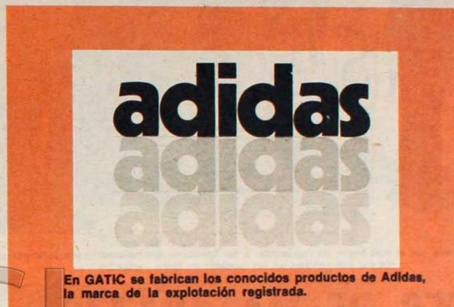
En GATIC se fabrican los conocidos productos de Adidas, la marca de la explotación registrada.

Ante el intento de este gobierno de sentar en el banquillo de los acusados, por delitos que tienen de 5 a 15 años de prisión, no a los oligarcas que nos explotan y entregan al imperialismo, sino a los trabajadores que son los productores de toda la riqueza, nos acercamos a los compañeros de la fábrica en San Martín, Provincia de Buenos Aires, para hacerles llegar nuestra solidaridad e informar mejor de su lucha.