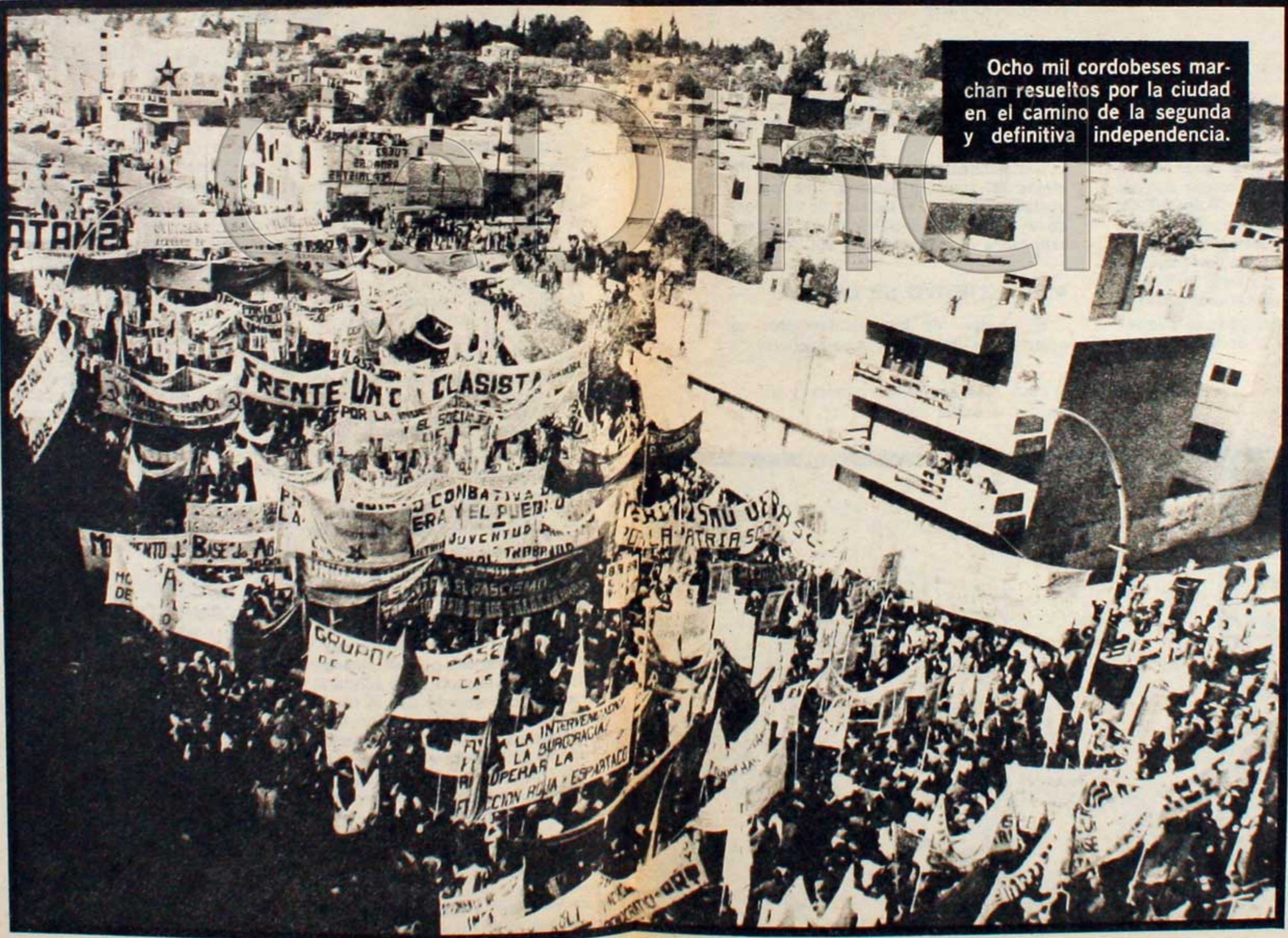
Ocho mil cordobeses marchan resueltos por la ciudad en el camino de la segunda y definitiva independencia.

Y después de finalizado el acto y ante una manifestación de 3.500 personas, que recorrió distintos puntos de la ciudad, se reveló en nuevas detenciones, golpes, corridas y disparos de balas, hasta herir a un compañero, que estuvo varios días entre la vida y la muerte. Una vez más, podemos ver la verdadera cara de este gobierno que, ante el empuje de las masas en las calles, responde recurriendo a todo su aparato represivo, sin detenerse a mirar que esa gente en la calle son padres de familia, obreros, estudiantes y niños que, movidos por reivindicaciones concretas y por la necesidad de vivir en una sociedad más justa, sale a defender sus derechos. Pese a todos los obstáculos que se le puso al pueblo de Córdoba, éste acudió en forma combativa, revolucionaria, demostrando el verdadero estado de ánimo de las masas, desmintiendo de esta manera la propaganda burguesa, populista y reformista que, de una u otra manera, trata de justificar sus errores de concepción y sus verdaderos intereses de clase a costa de las reales aspiraciones del pueblo argentino.