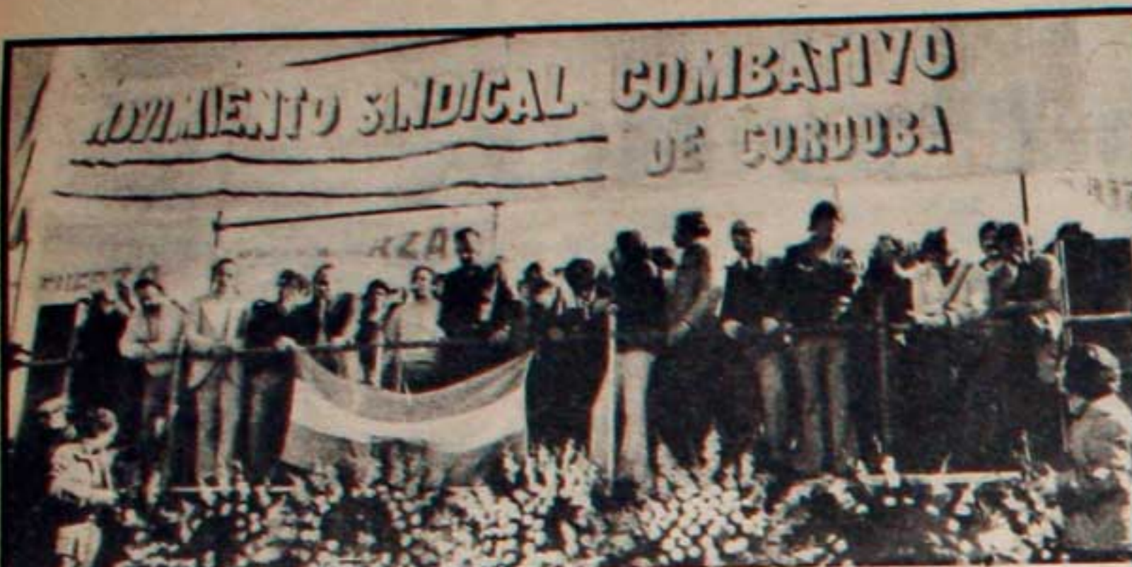
El ejemplo combativo del compañero Mena se transformó en la voluntad de un pueblo que se mueve decidido por otro 29.