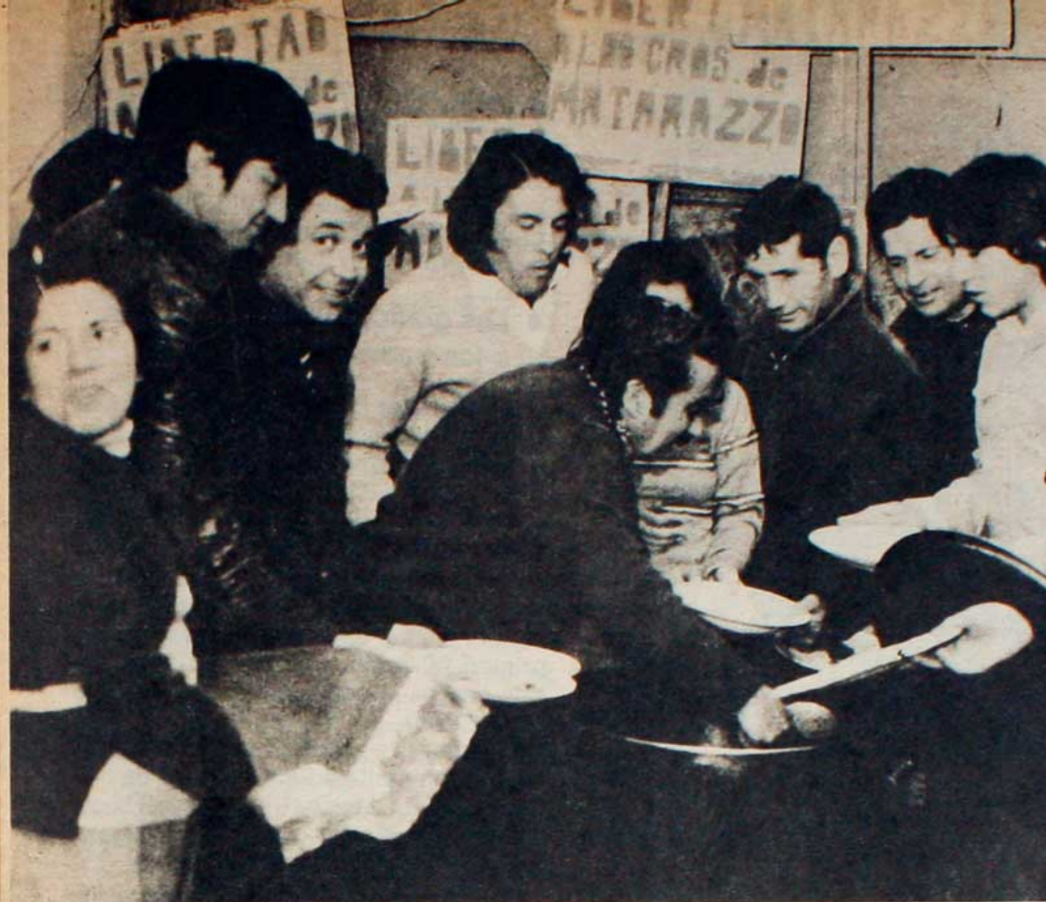
Los obreros de Matarazzo durante la olla popular. Unidad y combatividad contra la patronal, la burocracia sindical y la represión que se vale del nuevo Código Penal.

ta en que la asustadiza patronal concede casi todo lo que con justicia reclaman los compañeros (aumento de salarios, categorización del personal, guardería, etc.). Pero pronto la empresa trata de recuperar lo perdido y se niega a cumplir el convenio. El lunes 13 cuando los compañeros se dirigieron a su fuente de trabajo, se encontraron con el artero "lock-out" dispuesto por los Matarazzo, con la seguridad de que encontrarían apoyo en la burocracia traidora del Ministerio y de la CGT. Entonces, en las inmediaciones de la planta y rodeados de policías, los trabajadores se reúnen en una asamblea en la que irrumpen los agentes del desorden para detener a 12 trabajadores, de los cuales 6 permanecen aún hoy encarcelados a la espera de que el juez Luque considere si les es o no aplicable la aberrante reforma del código penal que llega a castigar una movilización activa como la de Matarazzo con penas que os-