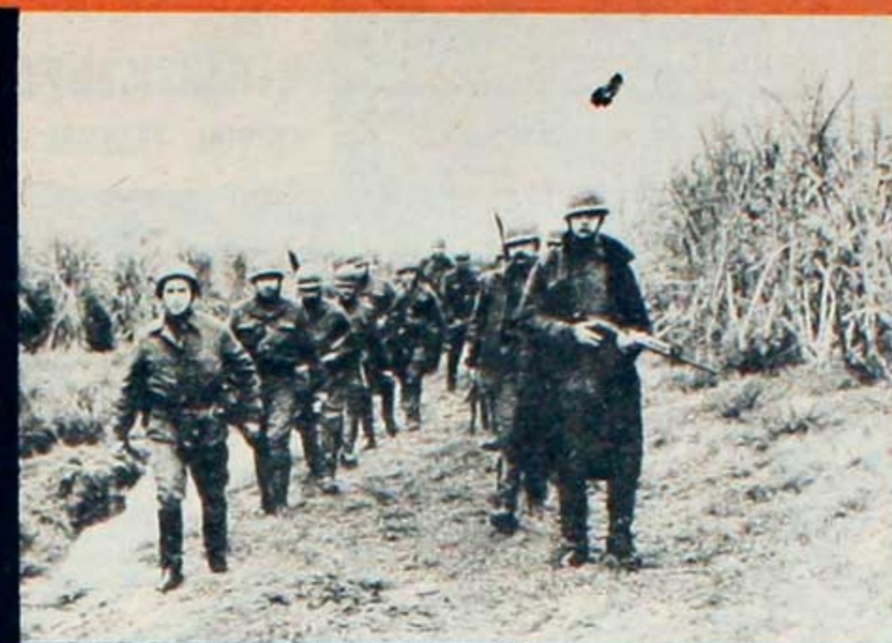
Las fuerzas represivas sobre el territorio tucumano arrasando, golpeando y encarcelando al pueblo.

Cuando se realizó el "Operativo Dorrego" en el que intervinieron conjuntamente FF.AA. y siete regionales de JP, NUEVO HOMBRE en su número 50 decía: "Solo cabe preguntarnos si seguimos entregados a la "ilusión reformista" que nos hace tener confianza en nuestros enemigos y desconfiar de nuestros amigos. De esos enemigos que están destinados a ser nuestros enemigos no solo porque ellos lo quieran así, sino por las fuerzas de las cosas, por las contradicciones objetivas de la realidad —la contradicción entre el capital y el trabajo—, y esos amigos que no lo son porque quieren serlo, sino por las fuerzas de las cosas, por la coincidencia objetiva de intereses que existen en el campo del pueblo. La experiencia de Chile está a nuestras puertas. El ejército "pro-