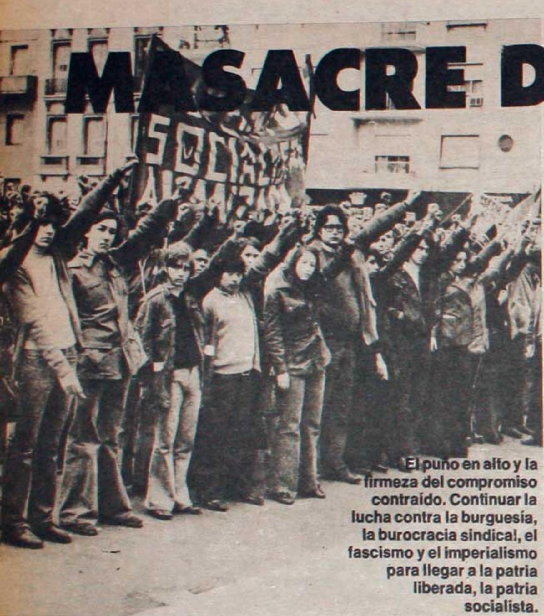
El puño en alto y la firmeza del compromiso contraído. Continuar la lucha contra la burguesía, la burocracia sindical, el fascismo y el imperialismo para llegar a la patria liberada, la patria socialista.