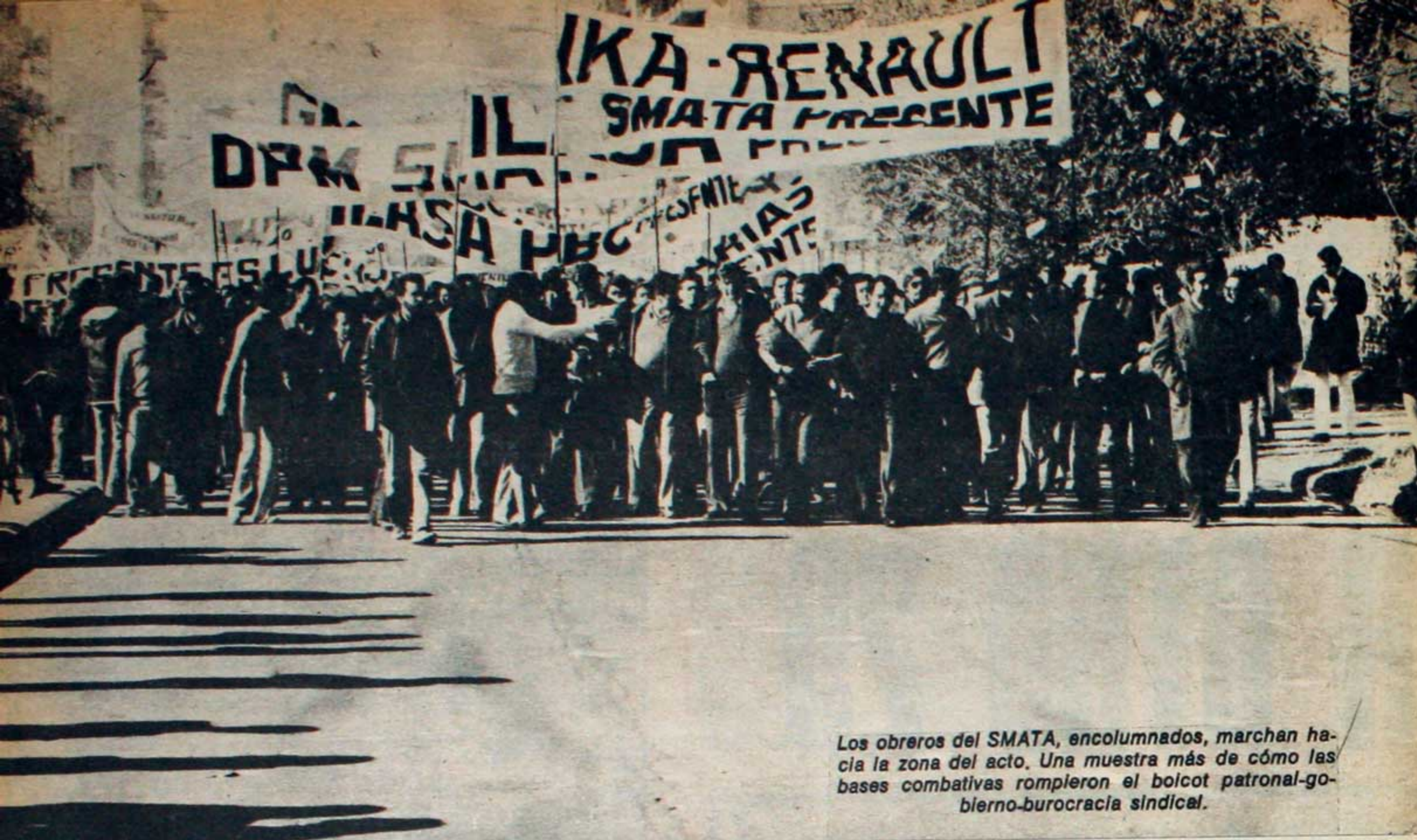
Los obreros del SMATA, encolumnados, marchan hacia la zona del acto. Una muestra más de cómo las bases combativas rompieron el boicot patronal-gobierno-burocracia sindical.

Dándole el carácter combativo al acto del 29 de mayo, una vez finalizado éste, se desprendió de la multitud una columna de 3.500 trabajadores que se dirigieron a la cárcel para exigir la libertad de los presos políticos. Los compañeros fueron recorriendo las calles de Córdoba al son de consignas combativas. Hablaban con la gente que en su conjunto apoyaban la marcha, de distintas formas, aplaudiendo, sumándose a la columna, comprando los periódicos revolucionarios, levantando las banderas argentinas con la estrella roja del socialismo, convidando agua a los integrantes de la columna y