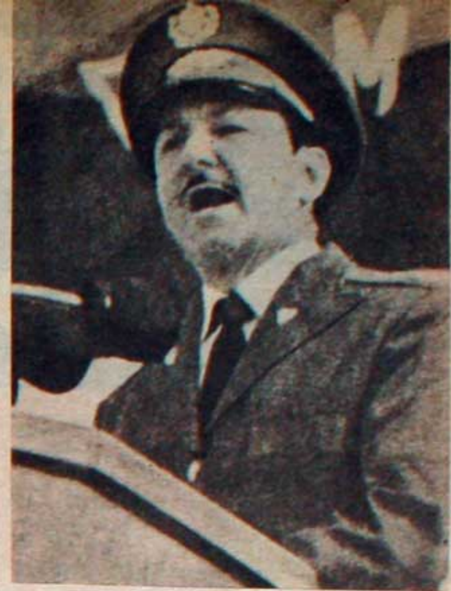
Comandante Raúl Castro

Expresión inequívoca de esta nueva situación es la derrota de los Estados Unidos en Viet Nam y su inevitable fracaso en toda Indochina; los acuerdos firmados entre la URSS y los Estados Unidos en junio del año pasado y que constituyen un triunfo de las posiciones del socialismo; la firma del acuerdo cuatripartito sobre Berlín Occidental; los tratados suscritos por varios países socialistas con la RFA que refrendan los resultados de la Segunda Guerra Mundial y del desarrollo de la posguerra; la organización de negociaciones en torno a la contención de la carrera armamentista y los problemas del desarme; el reconocimiento jurídico internacional de la República Democrática Alemana; la ayuda y el apoyo a los pueblos árabes que combaten al agresor israelí. El reconocimiento del status colonial de Puerto Rico y de los legítimos derechos de varios pueblos africanos por parte de las Naciones Unidas; el re-