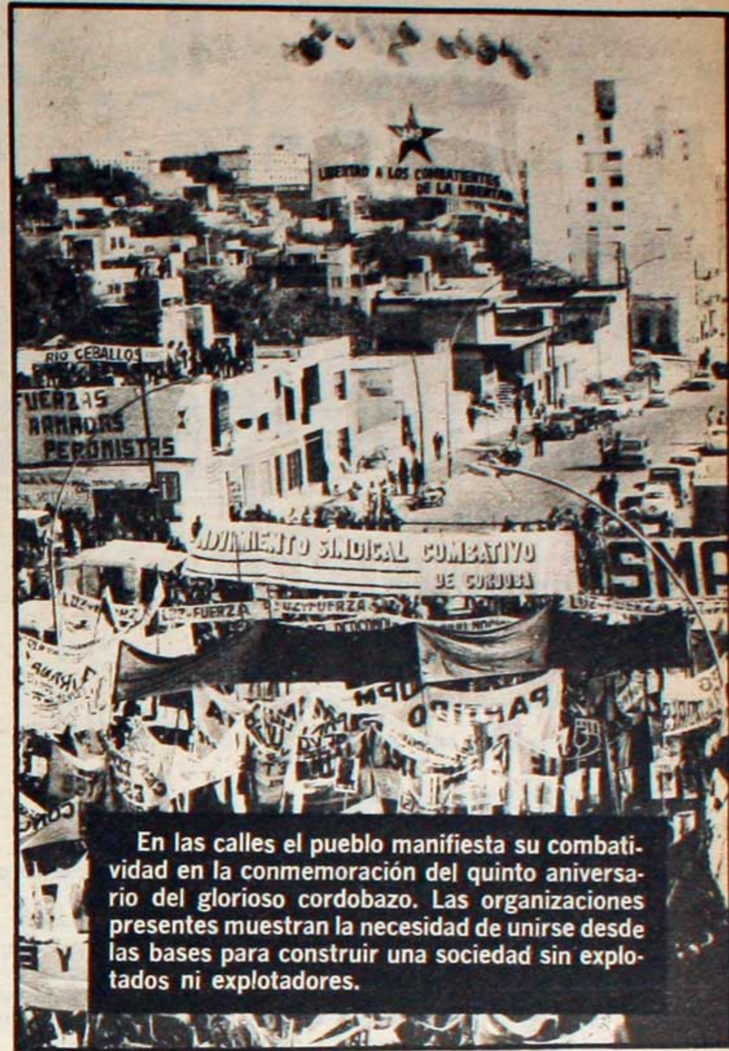
En las calles el pueblo manifiesta su combatividad en la conmemoración del quinto aniversario del glorioso cordobazo. Las organizaciones presentes muestran la necesidad de unirse desde las bases para construir una sociedad sin explotados ni explotadores.