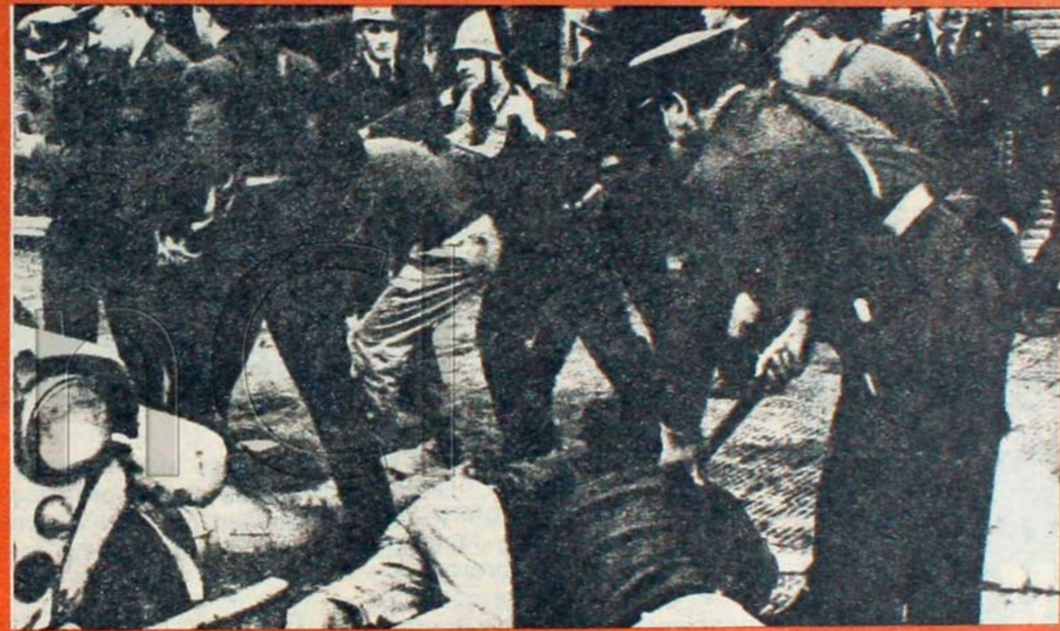
Esto ocurrió a un año del devotazo: represión a la JP en las cercanías de Devoto.

El 25 de mayo dos sectores del campo popular salieron separadamente a la calle para reclamar la libertad de los nuevos presos políticos, los del gobierno peronista. Uno fue convocado por COFAPPEG en Congreso, bajo consignas de unidad. El otro, organizado por la Juventud Peronista, sufrió alternativas y vacilaciones en su convocatoria, como producto de la desconformidad de los compañeros que no intervinieron en su organización con la consigna secretaria de Libertad a los Presos Peronistas lanzada inicialmente, que al día siguiente fue transformada por la de Libertad a los Presos Populares. Pese a esto, las movilizaciones no llegaron a unificarse.