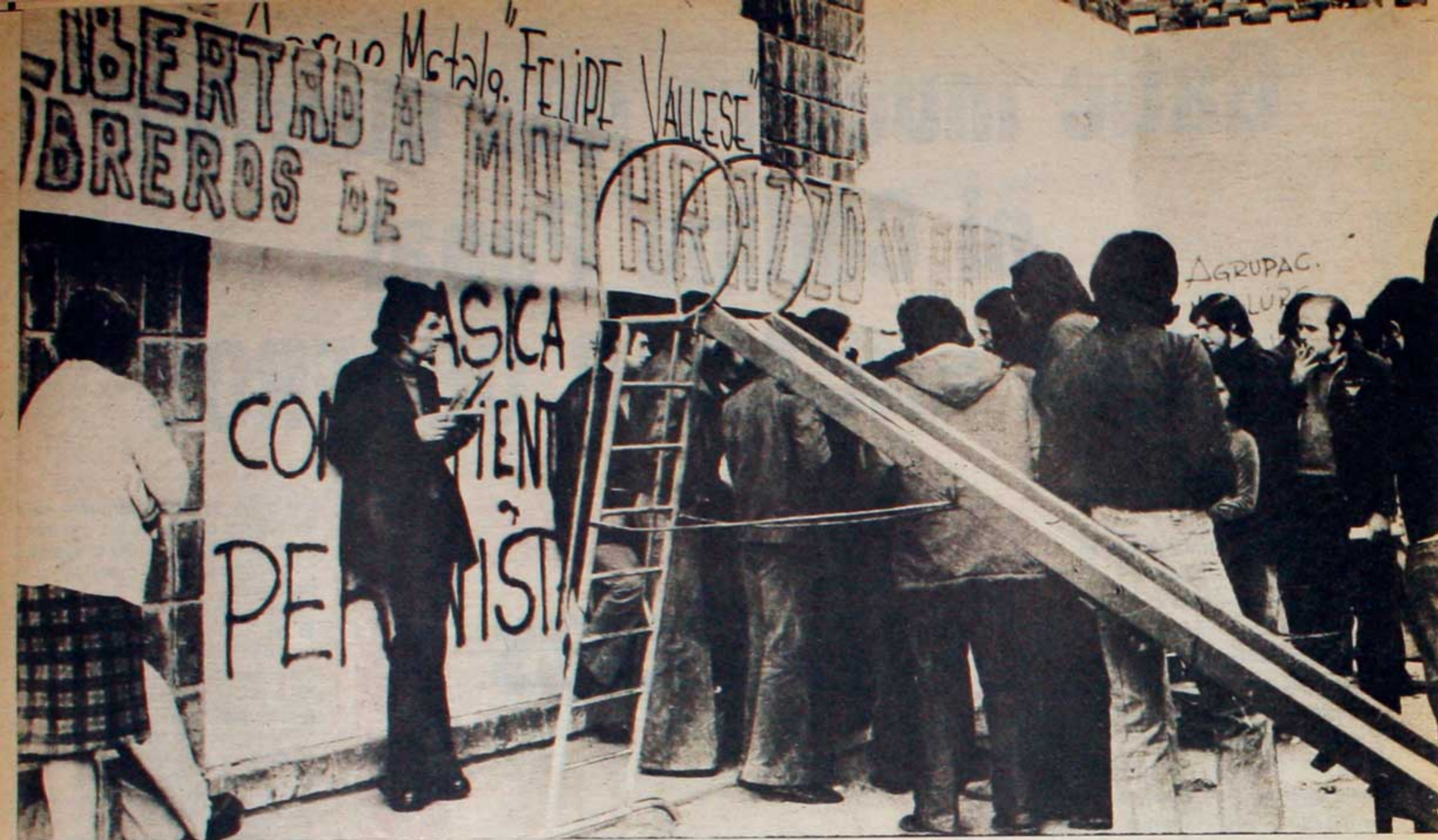
La libertad de los obreros de Matarazzo, prisioneros por el solo hecho de representar a las bases, no ser traidores y combatir por sus derechos indiscutibles, fue la consigna de sus compañeros, en las medidas de lucha realizadas.