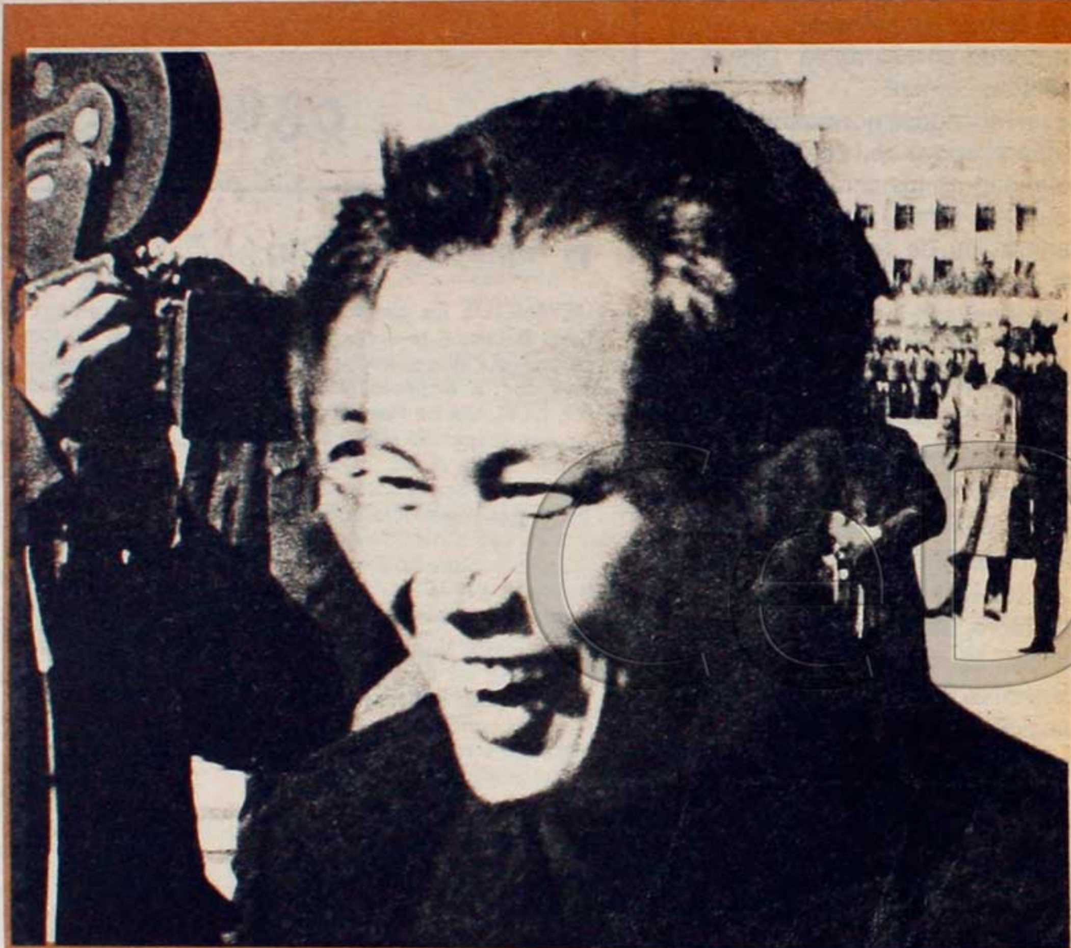
Khieu Samphan, a su llegada a Pekín, para participar en la cumbre camboyana.

Ellos son reconocidos por todo el pueblo camboyano como intelectuales revolucionarios que consagraron su vida a la liberación de la patria. El triunfo de las fuerzas pronorteamericanas en las elecciones parlamentarias de setiembre de 1966 permitió que el declarado anticomunista general Lon Nol —el mismo que actualmente quiere arrojar la toalla— se encargara de formar gobierno en Camboya. Como primer acto de gobierno, Lon Nol lanzó una tenaz persecución contra toda la intelectualidad de izquierda y los sectores progresistas. La situación de terror y violencia desencadenada por la derecha gobernante obligó a las fuerzas populares a pasar a la clandestinidad y comenzar desde