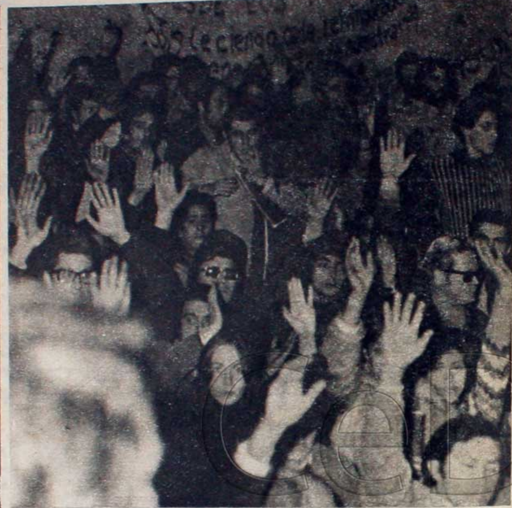
Compañeros gráficos dicen NO al pacto social.