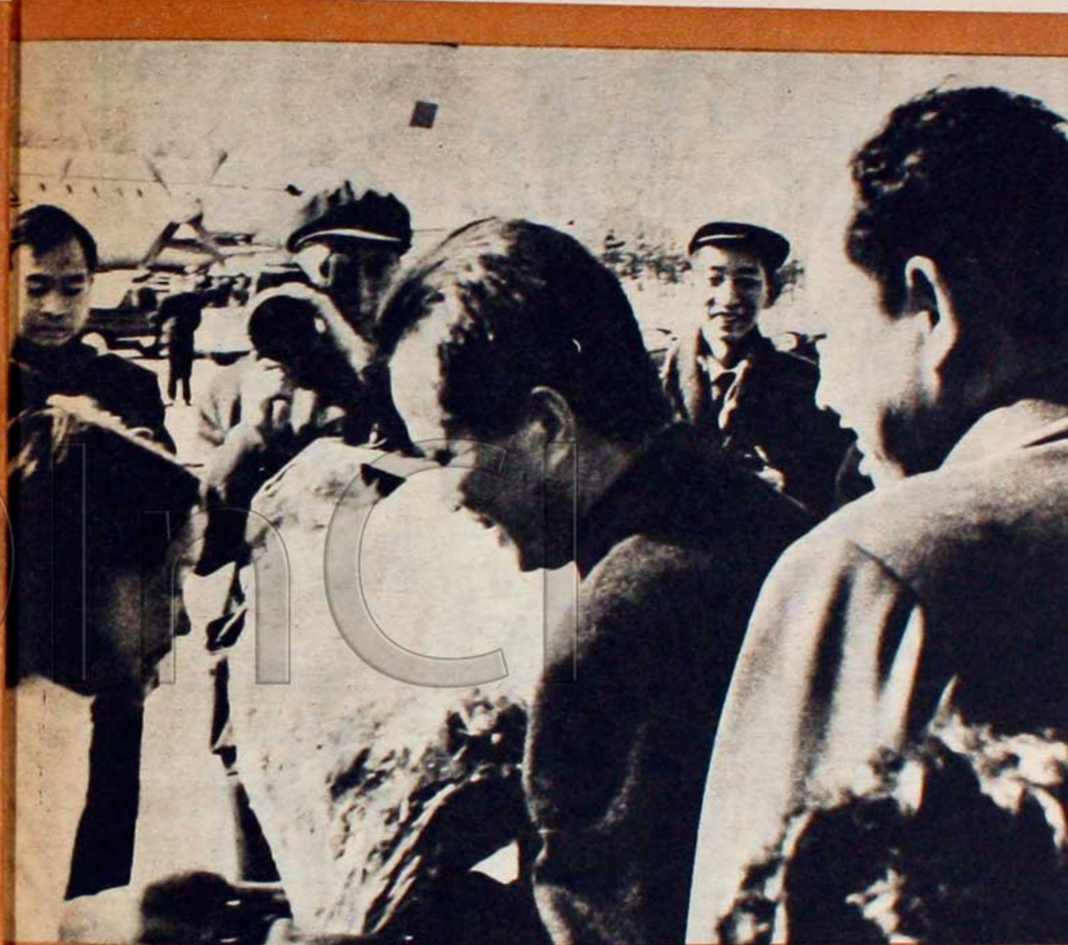
Samphan, y el enviado especial del interior, Ieng Sary, reciben flores de una niña camboyana a su llegada a Pekín.

En mayo de 1970, al proclamarse la formación del Frente Unido Nacional de Camboya y el Gobierno Real de Unión Nacional de Camboya, los tres luchadores figuraron