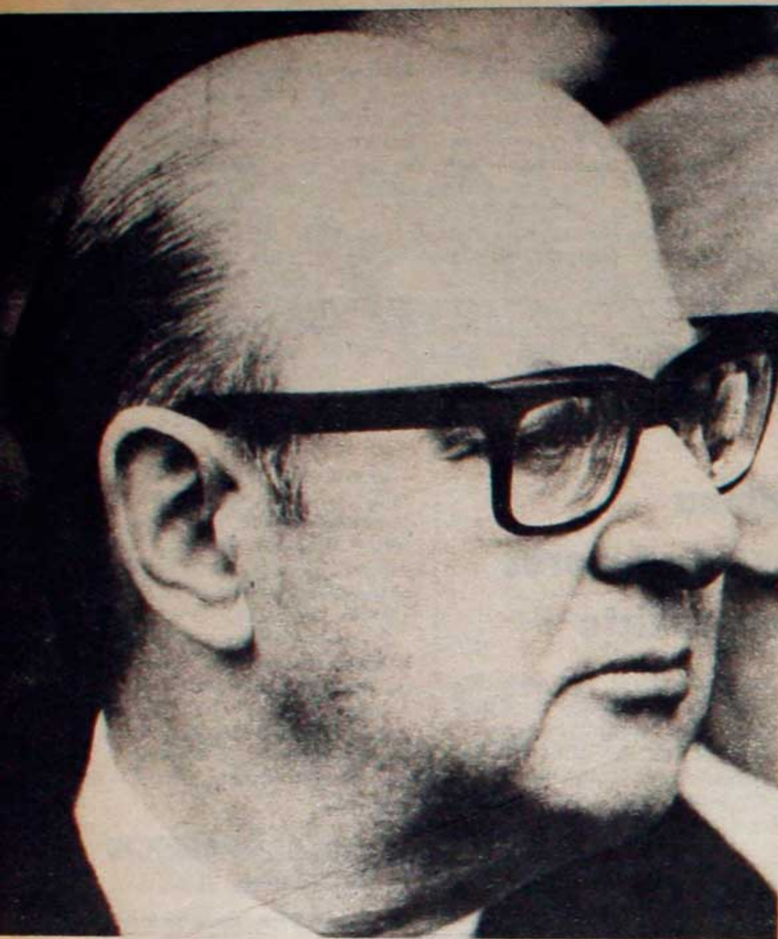
Mor Roig instrumentó el GAN para salvar a la burguesía. Ministro de la represión en la dictadura militar.