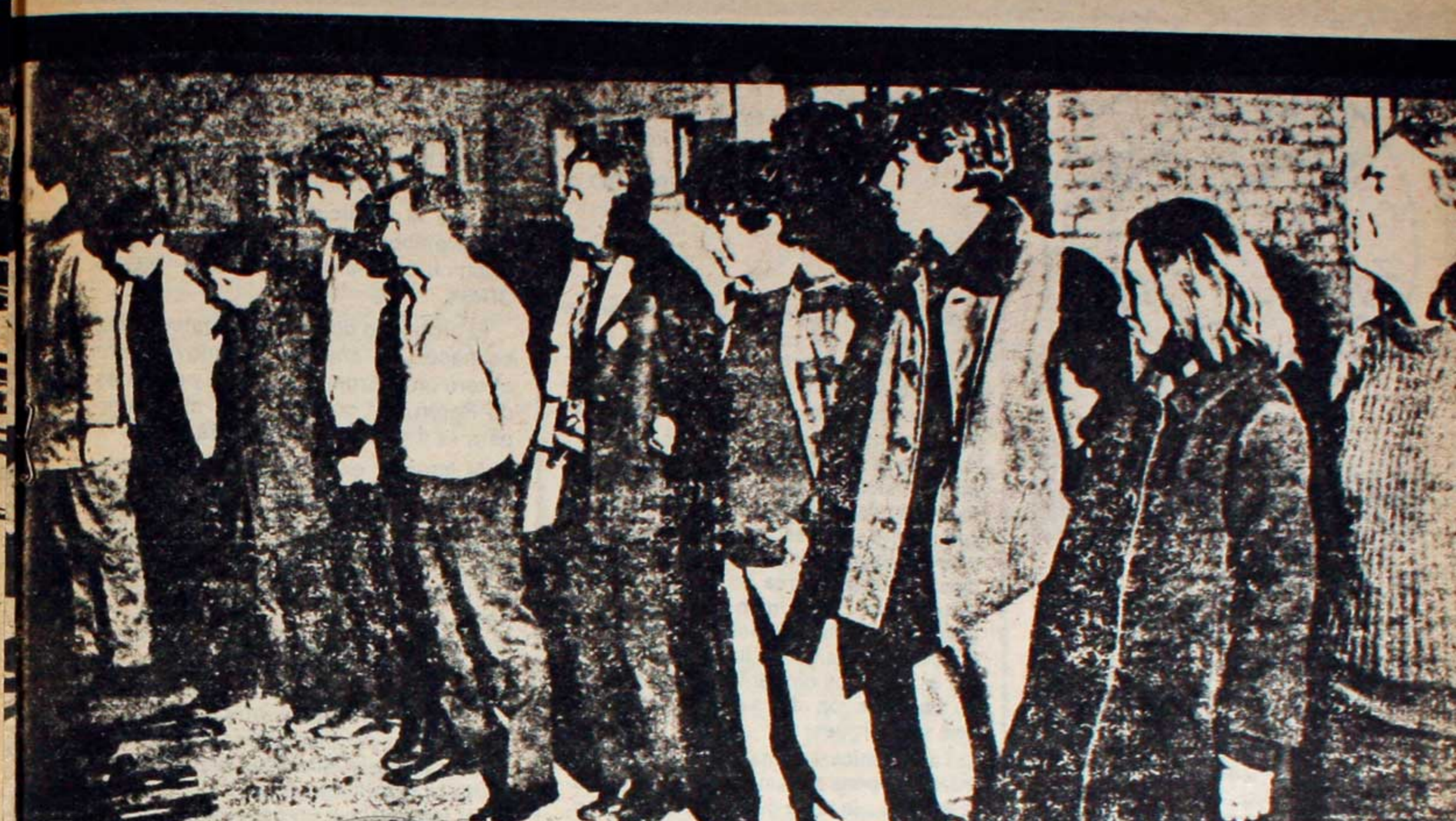
Militantes del pueblo fusilados durante la dictadura de Lanusse. Mor Roig tuvo activa participación.