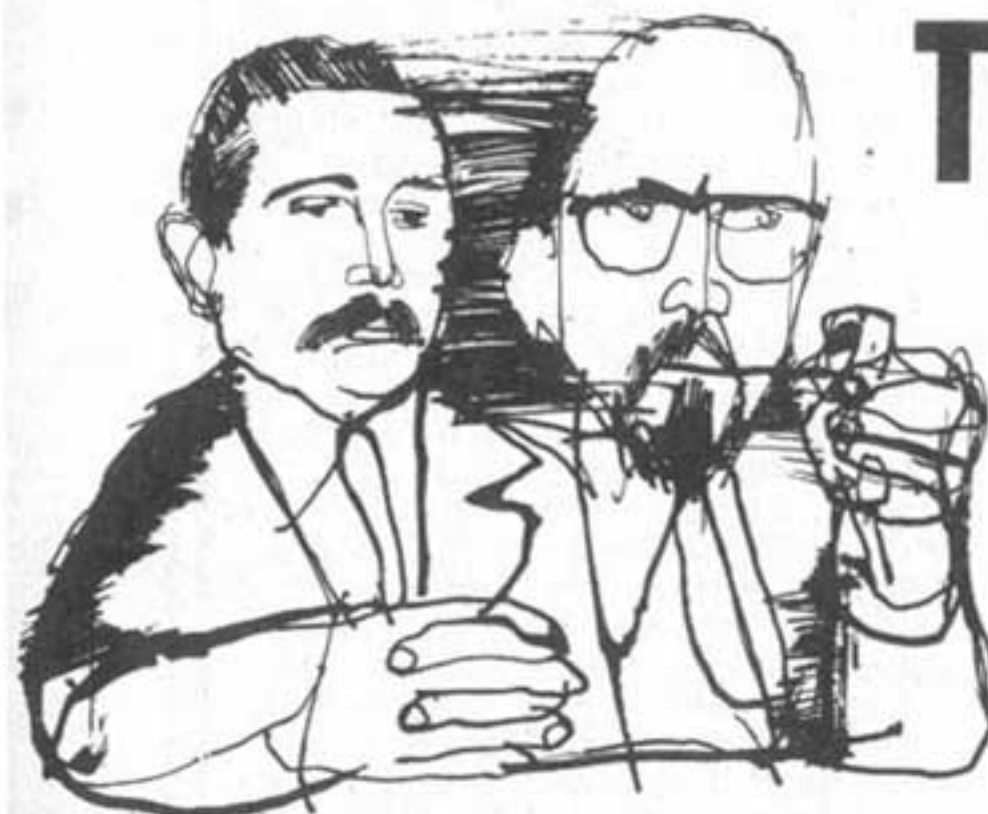
por EDUARDO L. DUHALDE y RODOLFO ORTEGA PEÑA

El general sintió el tirón de paracaídas y una serie de imágenes se sucedieron en su conciencia interna, tal como lo había leído en "Selecciones del Readers". Iban desde la infancia, pasando por Magdalena, llegando rápidamente hasta la toma del Arzobispado.