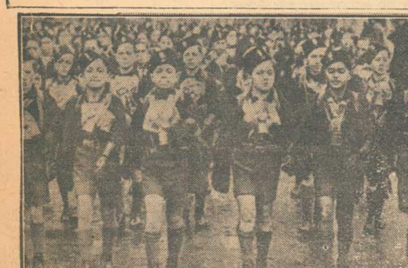
Balillas italianas, desfilando en Roma, provistos de sus instrumentos fascistas de educación y cultura: careta contra los gases asfixiantes