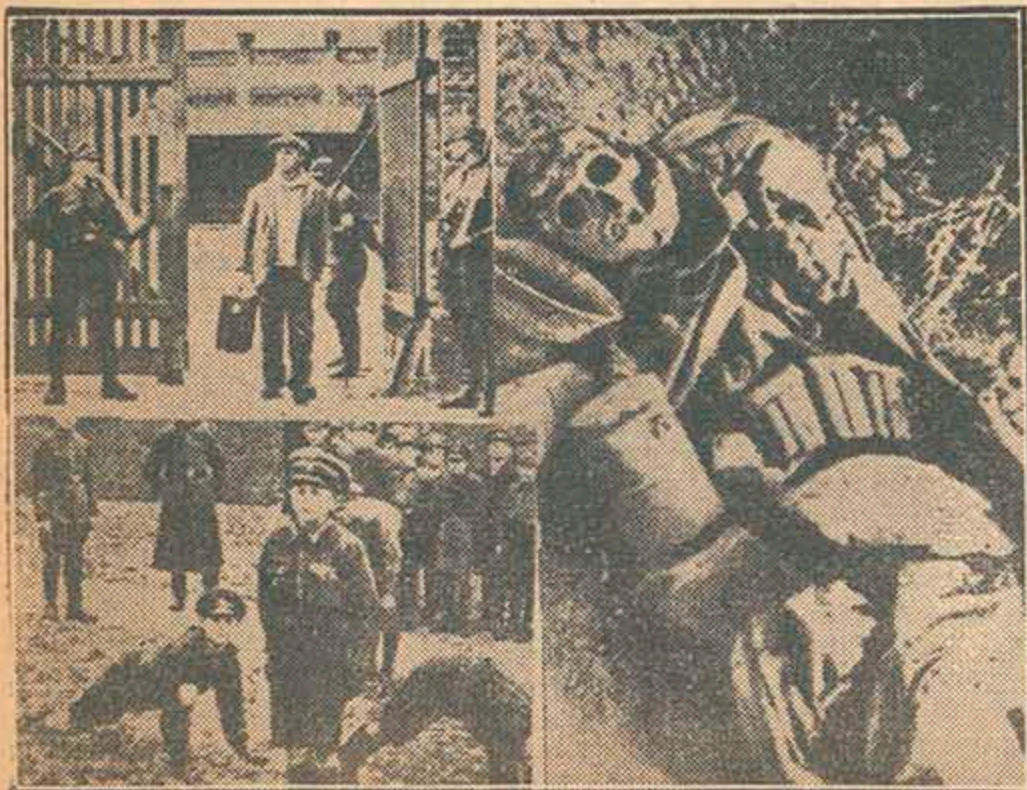
Aunque al revés. (Véase página 1)