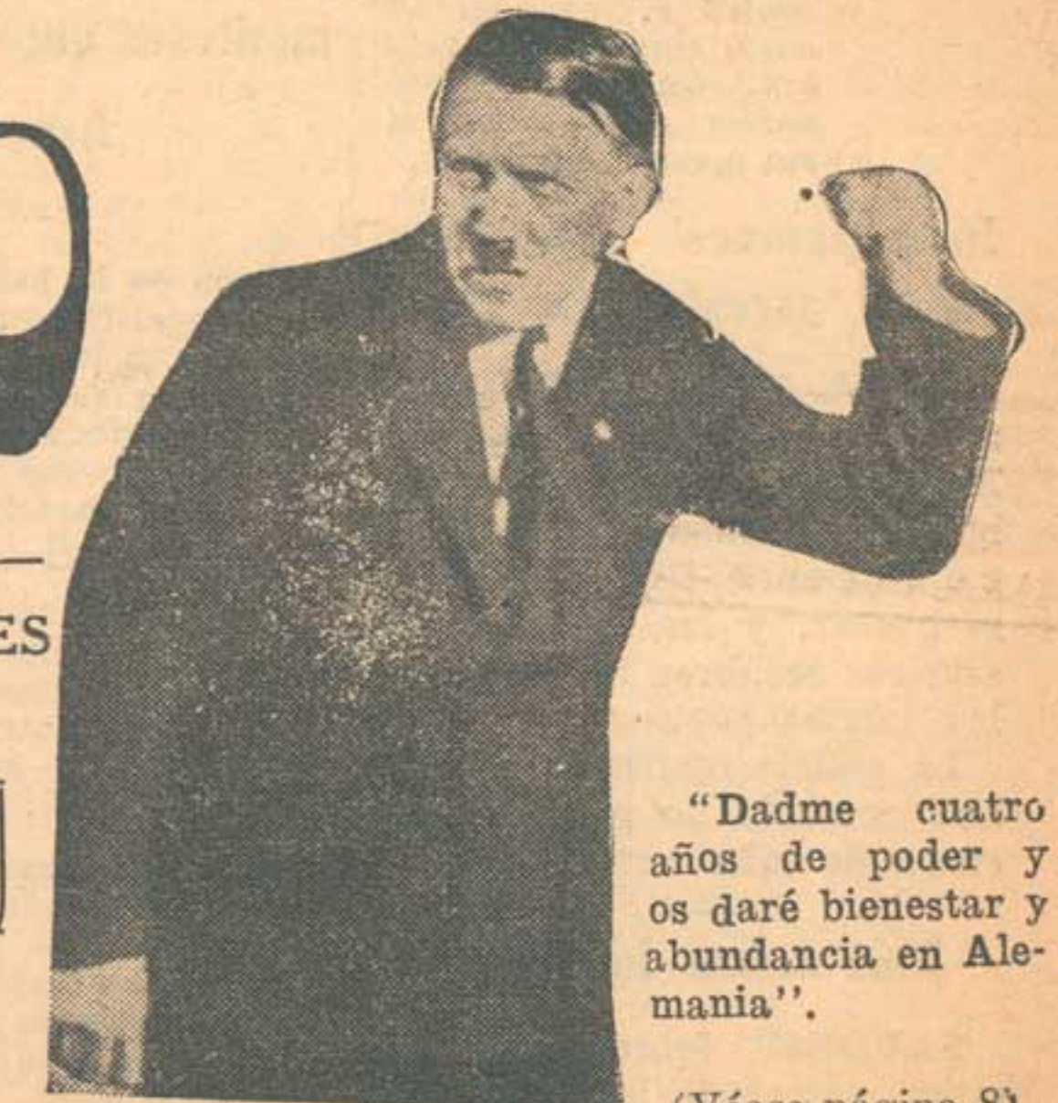
"Dadme cuatro años de poder y os daré bienestar y abundancia en Alemania".