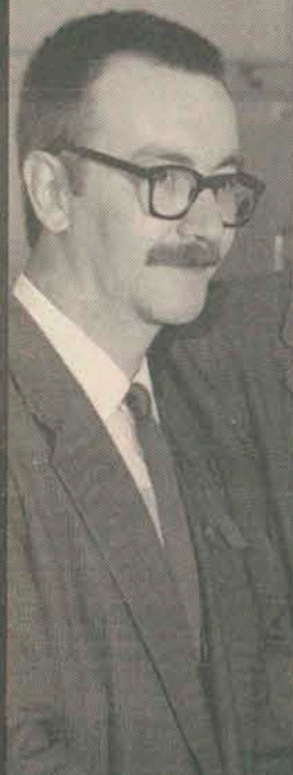
Te Llevamos a Todas Partes