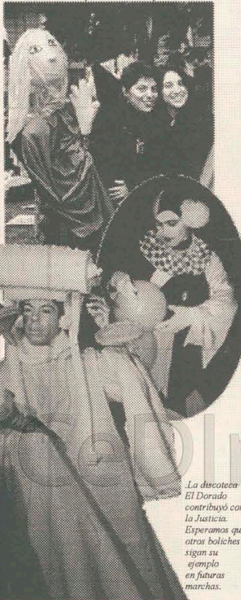
La discoteca El Dorado contribuyó con la Justicia. Esperamos que otros boliches sigan su ejemplo en futuras marchas.

Las delegaciones amigas de Córdoba, Neuquén y Rosario estuvieron presentes ayudándonos