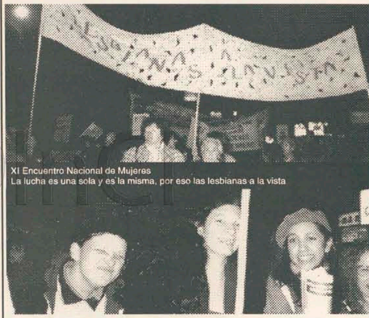
XI Encuentro Nacional de Mujeres La lucha es una sola y es la misma, por eso las lesbianas a la vista

Finalmente, en el cierre se leyeron las conclusiones de los talleres y se eligió como próxima sede para el Encuentro Nacional de Mujeres, que se realizará el año que viene, a la provincia de San Juan.