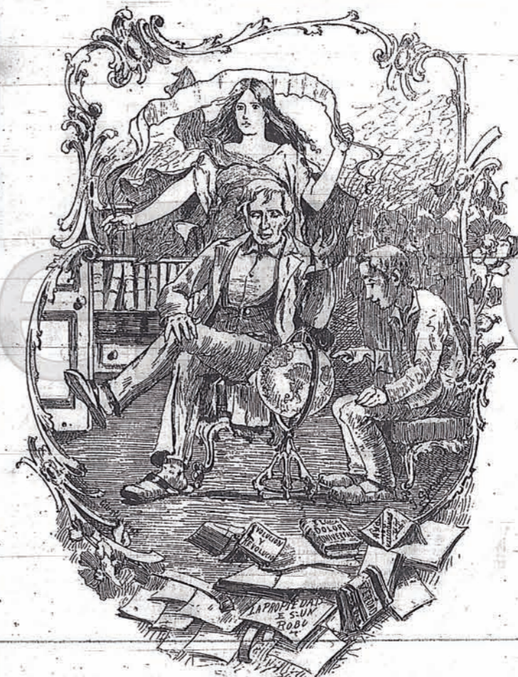
La educación va encaminada hacia el porvenir. El dogmatismo escolástico desaparece, se hunde ante la práctica nueva. La ciencia y el ideal, trazan en el ambiente moderno la senda de luz, por la que debe encaminarse la generación nueva.

Con violencia no se llega al parlamento, donde los halagos del poder hacen hablar a muchos de los que no trepidan en llamarse vándalos. Es mucho más conveniente decir al pueblo que se inscriba en los registros cívicos y que olijen diputados que todo lo han de lograr por la lenta apropiación del poder, a emplear los métodos de la violencia que si bien llevan al pueblo hacia el terreno de su