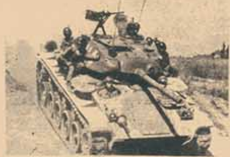
Las tropas tanquistas son adiestradas en los campos de Somagahara.

Debe tenerse en cuenta que éste y otros factores que pueden causar el empeoramiento de la balanza internacional de pagos y cobros, son fatales para el plan del primer ministro Ikeda. La médula del programa para duplicar la renta nacional es un gigantesco plan de inversiones. Esto, desde luego, resultaría indudablemente en un aumento de las importaciones. Y para balancear esta salida de divisas extranjeras creadas por el aumento de importación, el país tendría que mantener un elevado nivel de exportación continua por muchos años. Los planes de la Agencia de Planificación Económica prevén un aumento anual de un 10 por ciento en las exportaciones, mientras que estima el promedio de aumento en el mundo de un 4½ por ciento anual. Como claramente lo indican estas ci-