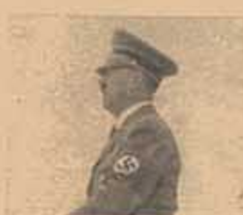
Hitler Crece en U. S. A.

Recientemente se efectuaron elecciones en el Irán. Las mismas ratificaron el extraordinario avance de un partido que no figura en los resultados del comicio: el Frente Nacional, agrupación izquierdista nucleada alrededor de Mohamed Mossadegh. El Frente ordenó la abstención, señalando que los comicios serían fraudulentos. RESULTADO: EN TEHERAN, CAPITAL DEL REINO, ESTABAN REGISTRADOS 600.000 VOTANTES, PERO SOLO 65.000 LLEGARON A LAS URNAS. EN OTRAS PALABRAS, CASI EL 90% DEL ELECTORADO SE ABSTUVO DE EMITIR SU VOTO. Después del complot que derrocó a Mossadegh, en 1953, a raíz de la nacionalización del petróleo dispuesta por éste, Irán se transformó en un recinto de la voluntad imperialista, del que la prensa internacional sólo recoge los devaneos romántico-biológicos del Sha. Pero parece que en Irán pasan otras cosas.