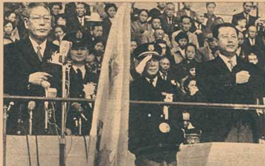
El primer ministro Ikeda (extremo izquierdo) y el Jefe de la Agencia de Defensa, Masumi Esaki (extremo derecho) pasan revista al reorganizado ejército del Japón.

El embajador de Estados Unidos, Douglas Mac Arthur hijo, (último a la derecha) presencia un desfile. Los norteamericanos han rearmado a Japón.