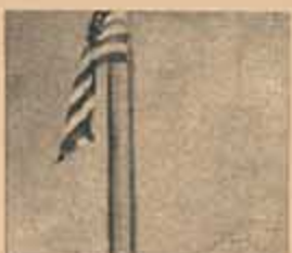
Dime a Quien Mandas...

La agencia telegráfica "Kioto" informa desde Nagasaki que ha muerto, a las 24 horas de haber nacido, una criatura sin cerebro. Los médicos informaron que la anomalía se debía a que los padres, 15 años atrás, estuvieron expuestos a las radiaciones atómicas. El hecho renovó un tema que para el Japón mantiene su duro dramatismo. Los diarios dieron estas pavorosas estadísticas: EN LOS PRIMEROS NUEVE AÑOS POSTERIORES AL LANZAMIENTO DE LA BOMBA SOBRE UN TOTAL DE 30.150 NIÑOS NACIDOS, 4.282 RESULTARON CON TARAS MENTALES (ES DECIR, CASI EL 15%); 1.046 PRESENTABAN DEFORMACIONES EN EL SISTEMA OSEO; 420 NACIERON CON DEFECTOS DE OLFATO O AUDITIVOS; 254 CON DEFORMACIONES EN LA LENGUA O EN LOS LABIOS; 243 CON DEFORMACIONES EN ORGANOS INTERNOS; 47 CON EL CEREBRO DEFORMADO; 25 SIN CEREBRO Y 8 SIN ORBITAS.