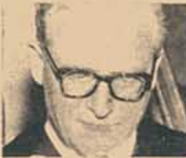
CON EL ENI BAJO EL PONCHO

Paradójicamente, Aramburu está interesado en mantener el clima de inminencia golpista. No sabemos si personalmente o por emisarios, ha hecho saber a Toranzo Montero —muy metafórica y sibilina— que está de acuerdo con su actitud. Esto parecería no condecir con sus manobras neointegracionistas y su acercamiento a Frondizi. Y sin embargo condice. Porque su peso político dentro de los manejos integracionistas del Gobierno depende de que, habiendo intranquilidad militar, él cobra indudable importancia frente al Ejecutivo, como dique a los estallidos insurreccionales. En el clima de las crisis es invariablemente Aramburu el "hombre de consulta" o el salvador de la legalidad, tras un regaño paternal. Pero sin crisis no hay salvador. De allí su aparente acercamiento a Toranzo y sus presiones para que cambien a Fraga y lo sustituyan por un hombre bajo su influencia.