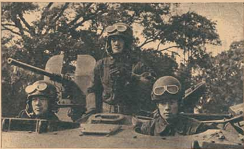
Tanques en el desfile.

1960 fue, para el Japón, el año de las masas. Grandes manifestaciones populares exteriorizaron la crisis que atraviesa el país tras una década de dominio conservador.