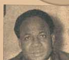
Parando el Carro