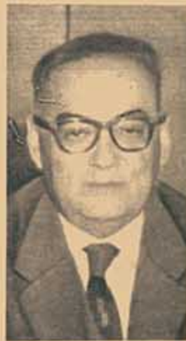
Por ALEJANDRO GOMEZ

LOS episodios de la última crisis militar, la alocución del Cardenal Caggiano y las declaraciones del presidente a la prensa yanqui, evidencian una ofensiva común destinada a plantear ante el pueblo el dilema del comunismo o del anti-comunismo. Para los señores Frondizi, Caggiano, Rojas, Toranzo Montero, etc., el gran problema nacional es atacar y extirpar al comunismo mientras se alinea la República en la más estrecha alianza con los Estados Unidos, país que se adjudica el liderazgo de la lucha anti-soviética. Para otros argentinos, que se llaman Alfredo Palacios, Santiago del Castillo, Alberto Casella, Alberto Gandiotti, Néida Balgorria, etc., el gran problema argentino es el de la soberanía de la patria y la mejora cultural y económica de su pueblo, a todo lo cual se opone la depredación económica y la penetración cultural extranjera que se conoce con el nombre de imperialismo.