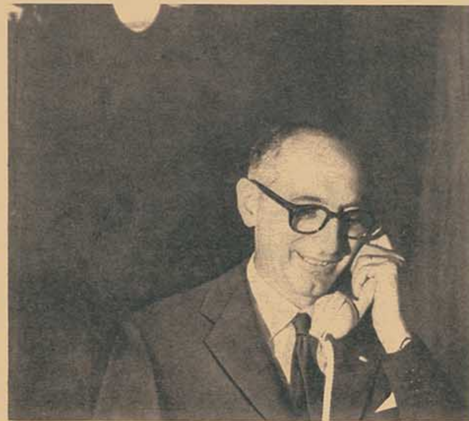
AQUI Y EN CUBA