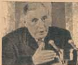
Colonialismo Franco Alemán

En los Estados Unidos aparecen más de 500 periódicos fascistas, leídos por una cifra que supera mensualmente los cinco millones de norteamericanos. El tiraje de los principales voceros del fascismo es el siguiente: "COSMOS SENSE" 300.000 EJEMPLARES; "THE DEFENDER" 100.000; "CROSS AND THE FLAG" 25.000; "NEWS BEHIND THE NEWS" 12.000. El fascista más prominente es George Lincoln Rockwell, presidente del Partido Nazi norteamericano. El centro de su prédica consiste en señalar que los judíos traman un complot secular para controlar el mundo. PARA EVITARLO SOSTIENE LA APLICACION DE CAMARAS DE GAS Y AFIRMA QUE DE TAL MODO "LOS JUDIOS SE ACABAN EN EL 72". James Madole es otro notorio nazi norteamericano, director del "National Renaissance". MADOLE JUZGA A HITLER COMO EL WASHINGTON DE EUROPA.