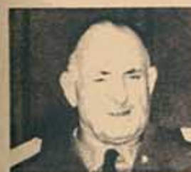
COBARDES INTRIGANTES Y GOLPISTAS

Los toranzistas afirman que la aparente fuerza actual del gobierno es sólo el producto de una calculada campaña psicológica. Según esas fuentes Frondizi tendría a su servicio un oficial francés especialista en dichas tareas —se menciona el apellido Invernet— quien, rodeado de un eficaz y misterioso equipo, difunde rumores, inventa golpes y frustraciones de golpes y mantiene a la opinión pública rodeada de un ambiente de constantes contradicciones políticas. A este equipo atribuyen los toranzistas la difusión en los medios políticos, gremiales y parlamentarios de una violenta declaración de 40 indignados coroneles. Campaña psicológica o no, lo cierto es que las tres carillas mimeografiadas que atacan rudamente a Toranzo Montero y a varios generales más han llegado a puntos neurálgicos de la vida nacional.