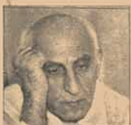
El Irán Detrás del Romance