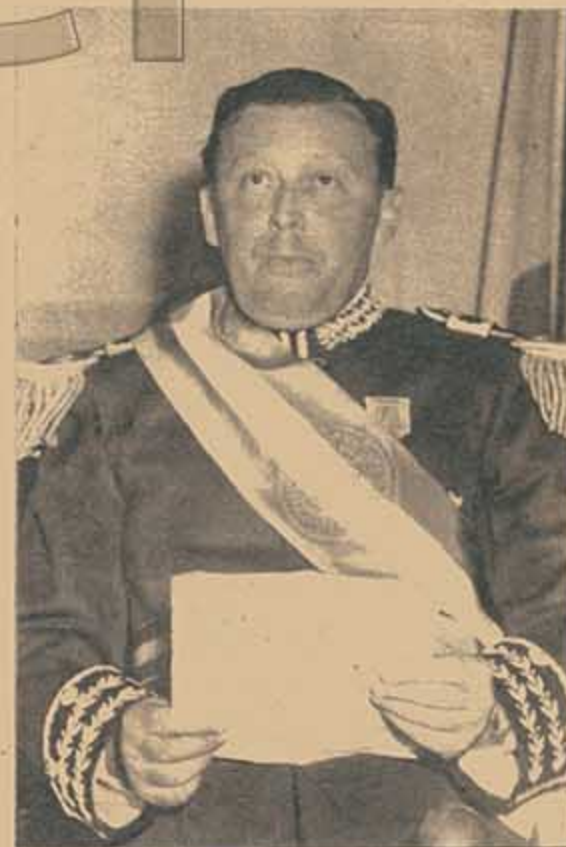
El general Stroessner, dictador de turno en el Paraguay. El departamento de Estado parece querer desembarazarse de él y suplantarle por otra figura menos desgastada. Pero a la "Operación Cordura" se le contraponen el fantasma de la guerra de guerrillas.