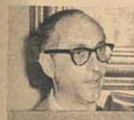
HOMBRE DE PSICOLOGO LLEVAR

Los toranzistas afirman que la aparente fuerza actual del gobierno es sólo el producto de una calculada campaña psicológica. Según esas fuentes Frondizi tendría a su servicio un oficial francés especialista en dichas tareas —se menciona el apellido Invernet— quien, rodeado de un eficaz y misterioso equipo, difunde rumores, inventa golpes y frustraciones de golpes y mantiene a la opinión pública rodeada de un ambiente de constantes contradicciones políticas. A este equipo atribuyen los toranzistas la difusión en los medios políticos, gremiales y parlamentarios de una violenta declaración de 40 indignados coroneles. Campaña psicológica o no, lo cierto es que las tres carillas mimeografiadas que atacan rudamente a Toranzo Montero y a varios generales más han llegado a puntos neurálgicos de la vida nacional.