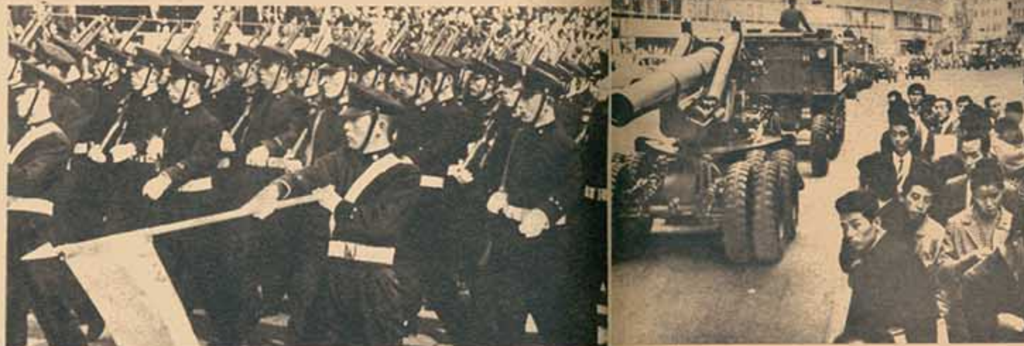
Desfilan estudiantes de la Academia Militar.

Colocando sobre la balanza los dos cursos diametralmente opuestos, encontramos que ésta se inclina a favor del último. Y entre los muchos factores que se necesitan para llegar a esta apreciación, hay dos fundamentales: la existencia de la República Popular China como un gran vecino, cuya cooperación económica mantendría a la industria japonesa en operación a toda capacidad con sólo mantener el Japón una actitud de amistad, y la fuerza creciente de los movimientos del pueblo japonés por la paz, la independencia, la democracia y el progreso social, demostrada durante las históricas luchas de este año contra la alianza militar con los Estados Unidos.