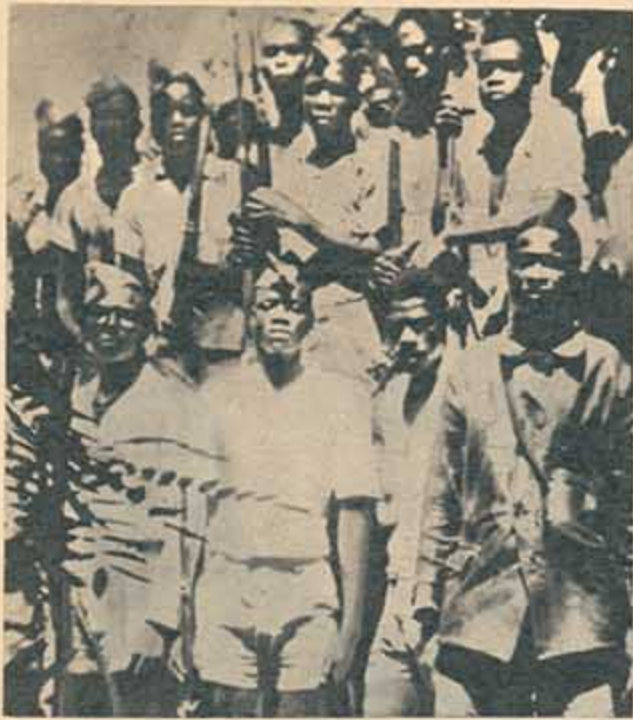
— Guerreros rebeldes angoleños.