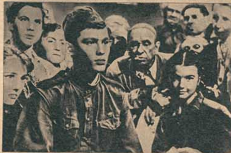
LA BALADA DEL SOLDADO