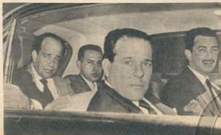
Goulart abandona París, rumbo a la gran diáspora: entregar o defender el Brasil.