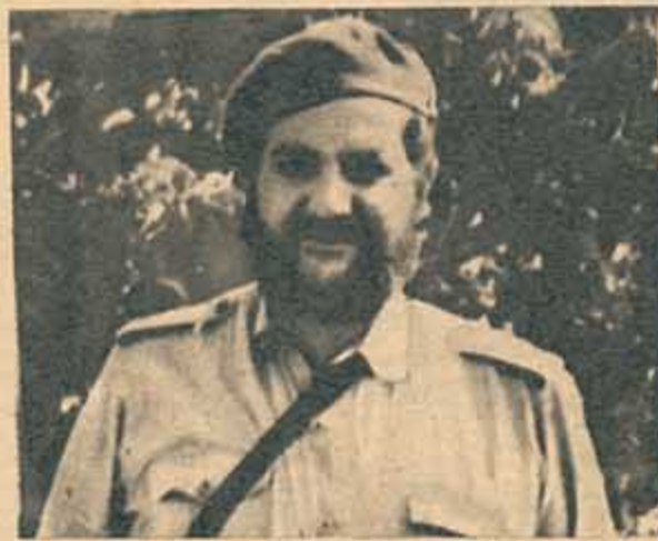
Peronismo y fidelismo en la vida de Cooke