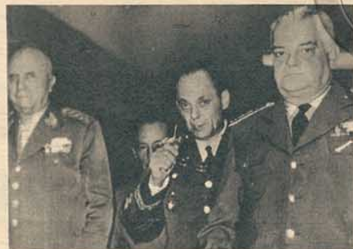
Los tres ministros militares, Odílio Denys (Guerra), Grun Moss (Aeronáutica) y Silvio Meak (Marina), se dirigen al palacio presidencial el día 29 de agosto, en momentos en que el golpe estaba en su apogeo.