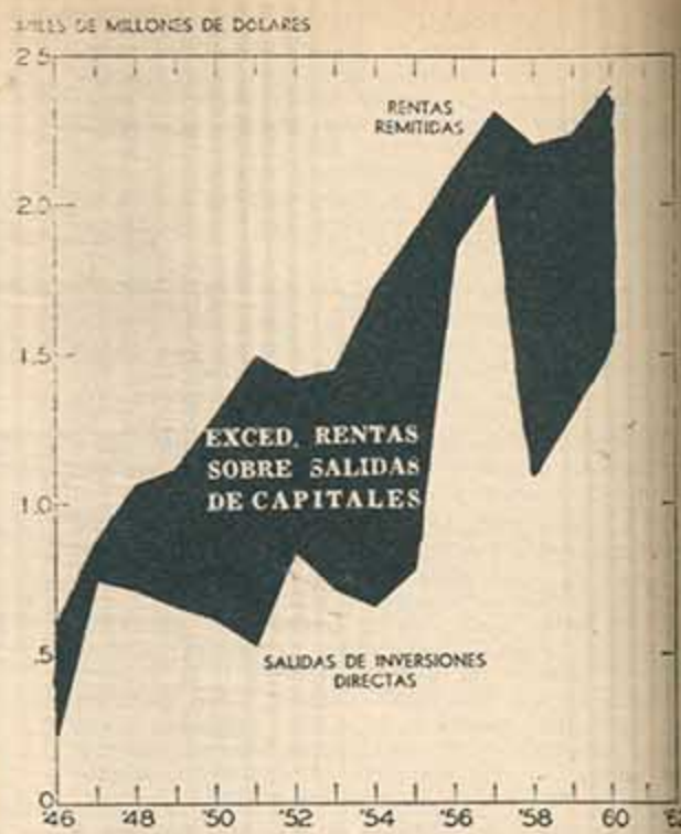
Inversiones directas de los Estados Unidos en el exterior y corriente de regreso de rentas al país

Durante la última década, las rentas provenientes de inversiones extranjeras privadas excedieron en u$s. 7.800 millones a las salidas de capital a largo plazo para inversiones directas", y a continuación: "Las inversiones extranjeras son —después de las exportaciones— la fuente de rentas más importante por sí sola en la balanza de pagos de Estados Unidos". Y en otra parte expresa que: "El establecimiento y la explotación de una fábrica en un país de ultramar significa, típicamente mayores exportaciones de maquinarias y otros productos estadounidenses". Aparte de todo esto, aumentan los capitales en el exterior a base de ganancias retenidas. "El Departamento de Comercio calcula que las ganancias retenidas durante el decenio 1951-60 ascendieron a unos u$s. 9.000 millones". Como se ve, el negocio de la exportación de capitales y de