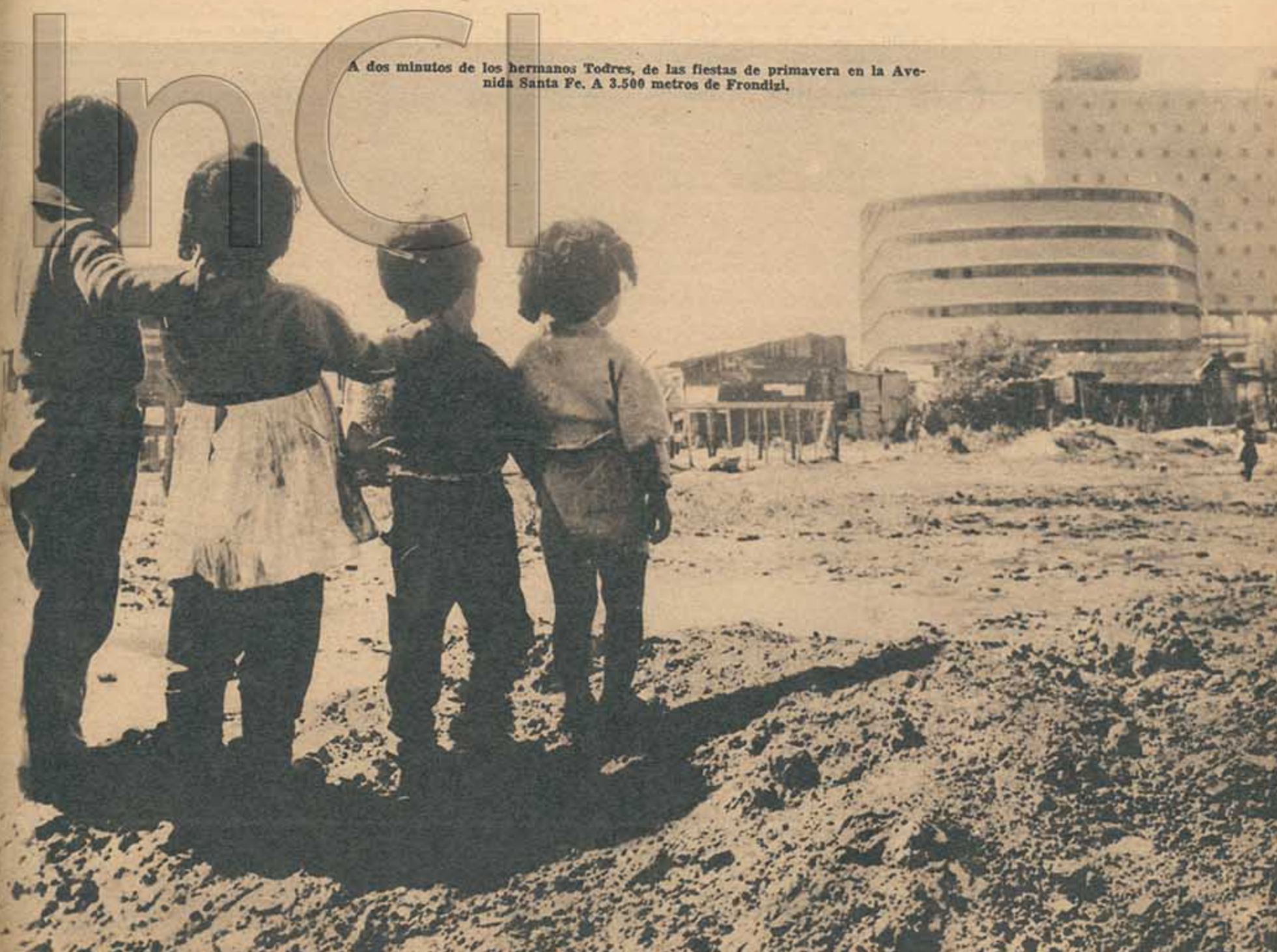
A dos minutos de los hermanos Todres, de las fiestas de primavera en la Avenida Santa Fe. A 3.500 metros de Frondizi.

El gobierno sólo tiene para sus habitantes cachiporrazos y sesiones de picana eléctrica