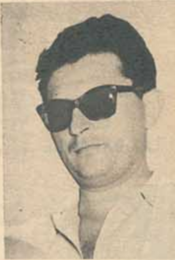
GUILLERMO LEON ANTIOCH: PUSO LAS COSAS EN CLARO

"Alias Gardelito" fue considerada por la prensa mayoritaria de la crítica nacional e internacional como una de las más importantes películas argentinas. Señalaron su calidad cinematográfica y su autenticidad como sus más evidentes atributos.