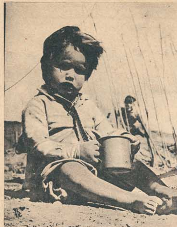
El presidente de la república donde vive esta niña, almorzó con el presidente de los Estados Unidos en el Waldorf Astoria.

Un colectivo —el 403— une en dos minutos Villa Comunicaciones con el centro. La duración del viaje hace increíble el cotejo de tanto cemento vertical, de tanto afiche insomne, de tanta "fuente del deseo" (para quienes ya no tienen deseos perdurables), con esta villa procreada por el trabajo y la necesidad y mantenida a fuerza de prepotentes ganas de vivir a pesar de todo. A un año ya de nuestro sesquicentenario —tan vuleado publicitariamente—, la realidad de esta villa abre un agudo interrogante sobre esa fecha "bluf" y sobre todos aquellos que han dado en negarla con su cipaya manera de atender el éxito de las taquillas extranjeras.