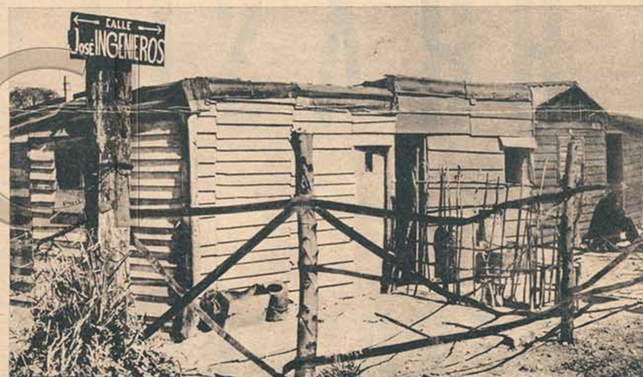
El pueblo siempre encuentra mejores nombres para las calles que la Municipalidad.