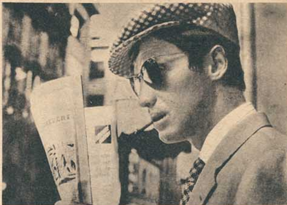
Jean Paul Belmondo en "Sin aliento".