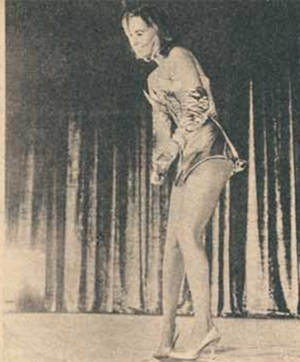
Lola Albright en "La mujer rendida".

Cualquier cosa que pueda decirse de realizadores como Valerzo o Godard, no impide reconocer que son artistas de nuestro tiempo, que expresan con un lenguaje actual su visión del mundo contemporáneo (o sus artistas). Menos admisible es observar a un realizador veterano como Lattuada, con buenos films en su haber, incurrir en la falsedad por incompreensión. Un tema interesante: el despertar amoroso de una adolescente (que después de todo ya había tratado sutilmente Colette hace cuarenta años), permite a Lattuada un estudio psicológico donde confunde lamentablemente las cosas. No es posible reflexionar sentimientos o ideas si no se las comprende; de tal modo el film cae continuamente en un convencionalismo psicológico (de diálogos, de situaciones y hasta modales) que tornan lo plausible en inverosímil. El tiempo no pasa en vano. Y es difícil renovarse.