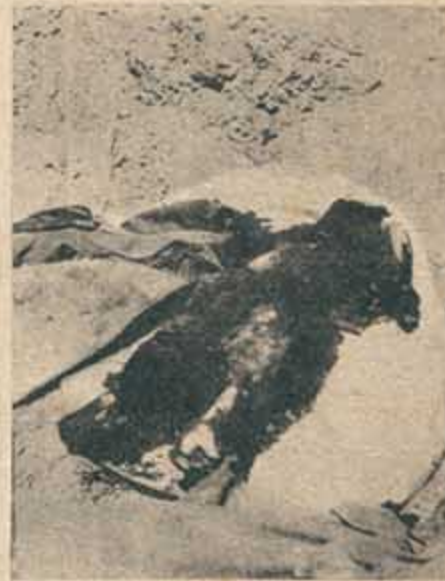
Otra "mancha", otro cadáver. Algo que horas antes era un hombre y que ahora es una acusación más contra la barbarie. Aviones, tanques, metralla. Y después: la operación limpieza: bayoneta y puñal.

TUNEZ. — Un hombre se inclina, levanta una sucia manta y el olor comienza a ser insoportable detrás de la precaria gasa húmeda de cloroformo que quiere servir de máscara contra la epidemia que todos temen. La situación es tan increíble que una mujer finlandesa, periodista, no confía en lo que será su relato y pide la fotografía junto a los cadáveres calcinados.