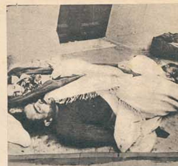
Toda una familia muerta en plena calle después de la "operación limpieza". Los cadáveres se pudrieron al sol y al sereno durante setenta y dos horas. Después, cuando se comenzó a temer una epidemia, se les enterró en un dantesco sepelio colectivo.

O esta otra, cuando se quiere conocer la opinión sobre el adversario: "Los militares tunecinos son buenos