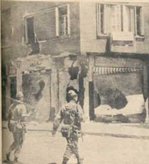
Un comando tunecino, instalado en una tintorería de 1.000 muertos y de fin de un imperio decadente.

En todo caso, es una mala imitación. Churchill pudo acuñar su "... sangre, sudor y lágrimas" en una situación de grandeza que lo hizo célebre. De Gaulle dice "... sangre fría, firmeza, buen empleo de mate-