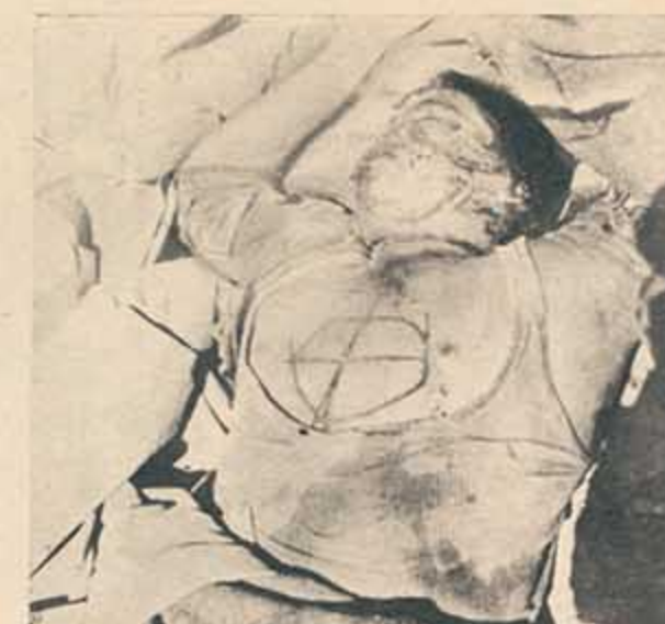
Este ya más que un cadáver, es un documento. Sobre el pecho de este tunecino asesinado, alguien —su verdugo— talló a punta de cuchillo o de bayoneta la cruz celta, depurada versión de la swástica nazi utilizada por el fascismo francés. Y el caso se repitió varias veces.

Pausas nocturnas, nuevos asaltos y horas después el diluvio de fuego había terminado. Ya no sirven el fusil