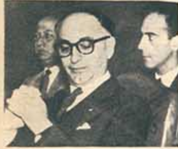
Frondizi: Será juez.