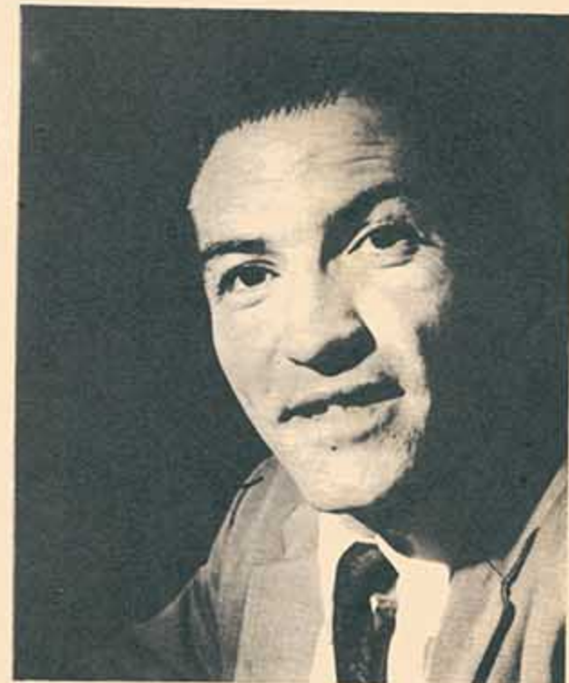
"Creo que todo hombre debe ser capaz de elegir..."