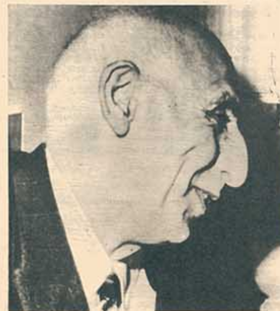
MOSSADEGH: VOCERO DE LA EMANCIPACION PERSA.

Las agencias internacionales de noticias se ocupan de mantener informado a todo el mundo sobre lo que consideran "hechos de interés" en Persia. Así supimos los atentos lectores que el Sha amaba a Soraya y si la dejó fue obligado por una esterilidad que amenazaba el trono. Luego nos enteramos del breve romance con Farah Diba y ahora llegan los insistentes rumores de que la joven madre de Ciro Palevi sufre en silencio el desamor de su marido.