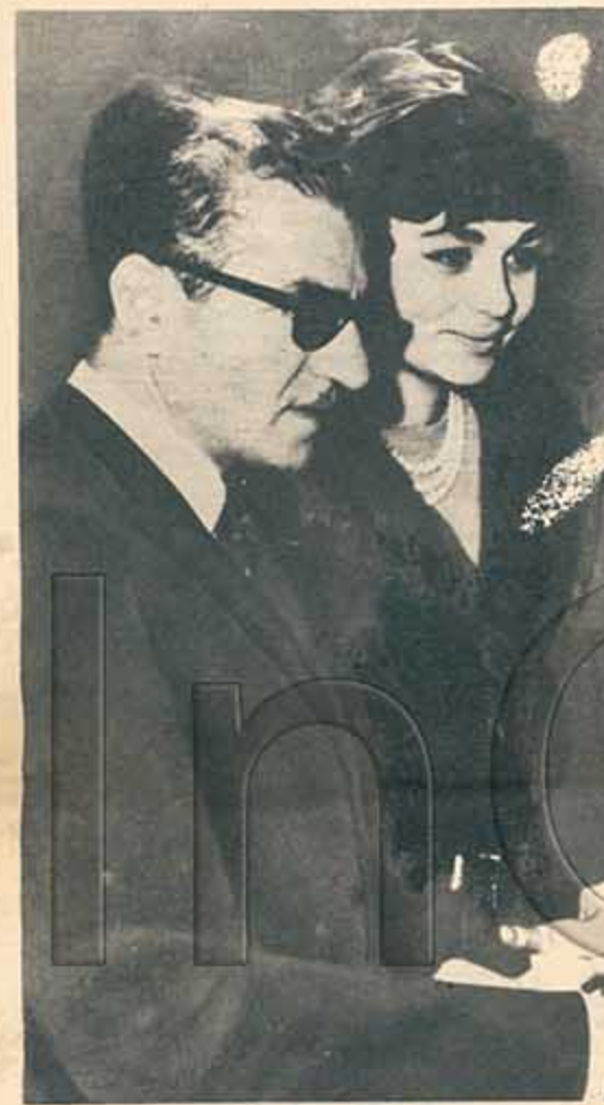
EL SHA CON FARAH DIBA: ESTA VEZ PUDO.