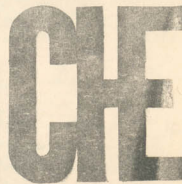
APARECE EL PRIMER Y TERCER MIÉRCOLES DE CADA MES