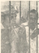
COLOMBIA CON LA BARBA

Se ha constituido en Bogotá el Frente Unido de Acción Revolucionaria (FUAR), que es el resultado de una larga y paciente labor de unificación de los sectores populares revolucionarios. El FUAR, que "no es un partido más, sino un esfuerzo serio para aglutinar alrededor de un solo objetivo común a las masas irredentas de Colombia", se formó mediante la fusión del Movimiento Popular Gaitanista, el Movimiento Nacionalista Revolucionario, el Movimiento Nacionalista Popular de la Costa Atlántica, el Movimiento Revolucionario Democrático, el Movimiento Popular Revolucionario de Antioquia, grupos campesinos e indígenas y dirigentes sindicales. La Conferencia Nacional de Fuerzas Revolucionarias, realizada en Bogotá el 1.º de abril, y de la cual surgió el FUAR, dio a conocer una declaración pública: "Nosotros sentimos depositarios de la verdad revolucionaria, ni pretendemos monopolizar el proce-