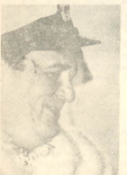
LA SEÑORA ALMIRANTE

Ha aparecido, circulando en forma más o menos clandestina, un misterioso librito llamado "Frigerio, esquema para un prontuario". Ya agotó su primera edición y empezó a distribuirse la segunda, corregida y aumentada. El libro figura editado por una desconocida editorial "Decencia" y no aparece el autor. Pero a pesar del siglo con que se imprimió, y el silencio sobre su autor, estamos en condiciones de suministrar a nuestros lectores unos cuantos datos interesantes sobre el sugestivo librito. La editorial "Decencia", por lo pronto, no existe. La obra fue escrita e impresa por una de las instituciones más indecentes del país: el SIN (Servicio de Informaciones Naval). Allí fue ideada y dificultosamente redactada por el capitán Rigal, jefe del servicio. Su objetivo no es, como pudiera parecer, el de destruir la temeraria figura de Rogelio Frigerio, sino, por elevación, el de arrojar sombras sobre el Ejército. Ya se sabe cómo son de unidas las tres armas. Concretamente, se