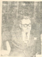
EL "SIN": ESQUEMA PARA UN PRONTUARIO