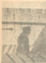
"SIE": ESQUEMA PARA OTRO PRONTUARIO