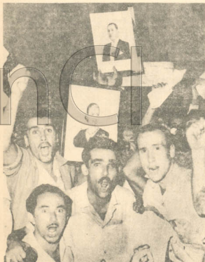
GIMO A LA IZQUIERDA: UNICA FORMULA DE LEALTAD A LA JORNADA DE OCTUBRE