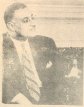
SOCIALISMO A ORILLAS DEL NILO