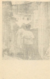
BASTA DE ESPERAR

la República Árabe Unida ha dado vigorosas brazadas hacia el socialismo. El Comité Preparatorio del reciente "Congreso de las Fuerzas Populares de la RAU" anunció el "aislamiento de los enemigos de la Revolución Popular, de la revolución socialista, y la expulsión de aquellos cuyos intereses están en divorcio con los del pueblo en la fase actual de la edificación socialista". Este aislamiento político abarca, ante todo, a los grandes latifundistas, a la burguesía grande y media (es decir, todos los afectados por las reformas agrarias de 1952 y 1962), a los que fueron procesados por los tribunales revolucionarios, a los afectados por la nacionalización y secuestro de bienes, a los miembros de la familia real destronada por la revolución y otros. Al referido Congreso asistieron 1.750 delegados elegidos en el mes de febrero pasado, de la siguiente forma: 375 por los campesinos, 300 por los obreros, 150 por los capitales nacionales, 225 por las asociaciones y organizaciones de profesionales, 135 por las em-