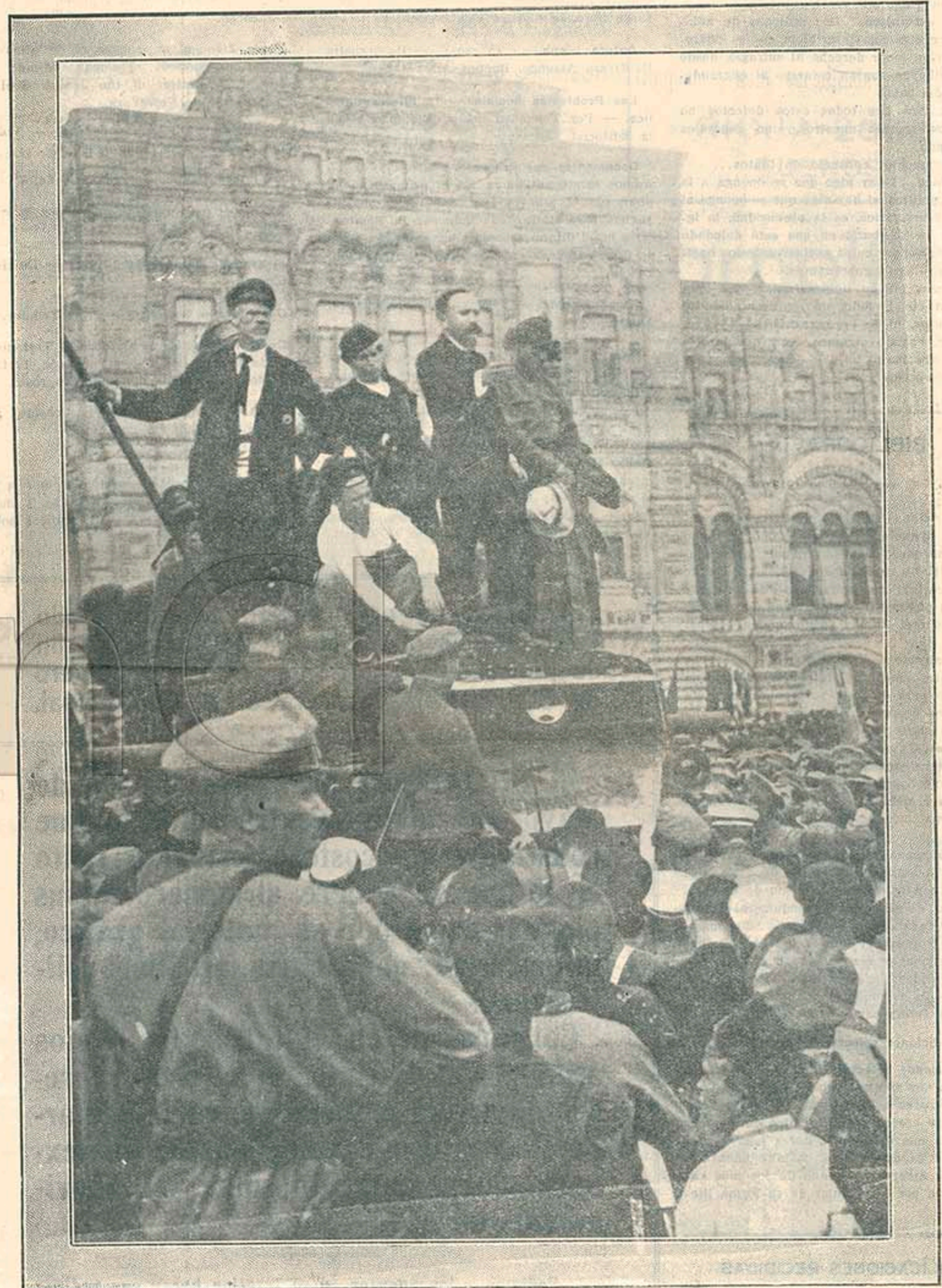
Kameneff, presidente del Soviet de Moscú, dirigiendo la palabra al pueblo, desde un tanque