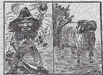
al anarquismo y al socialismo