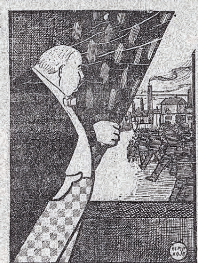
A pesar de todo, siguen trabajando para mí

Verdaderamente resulta pueril y ridículo ese afán de confundir sin tener federados, sin tener a quien.