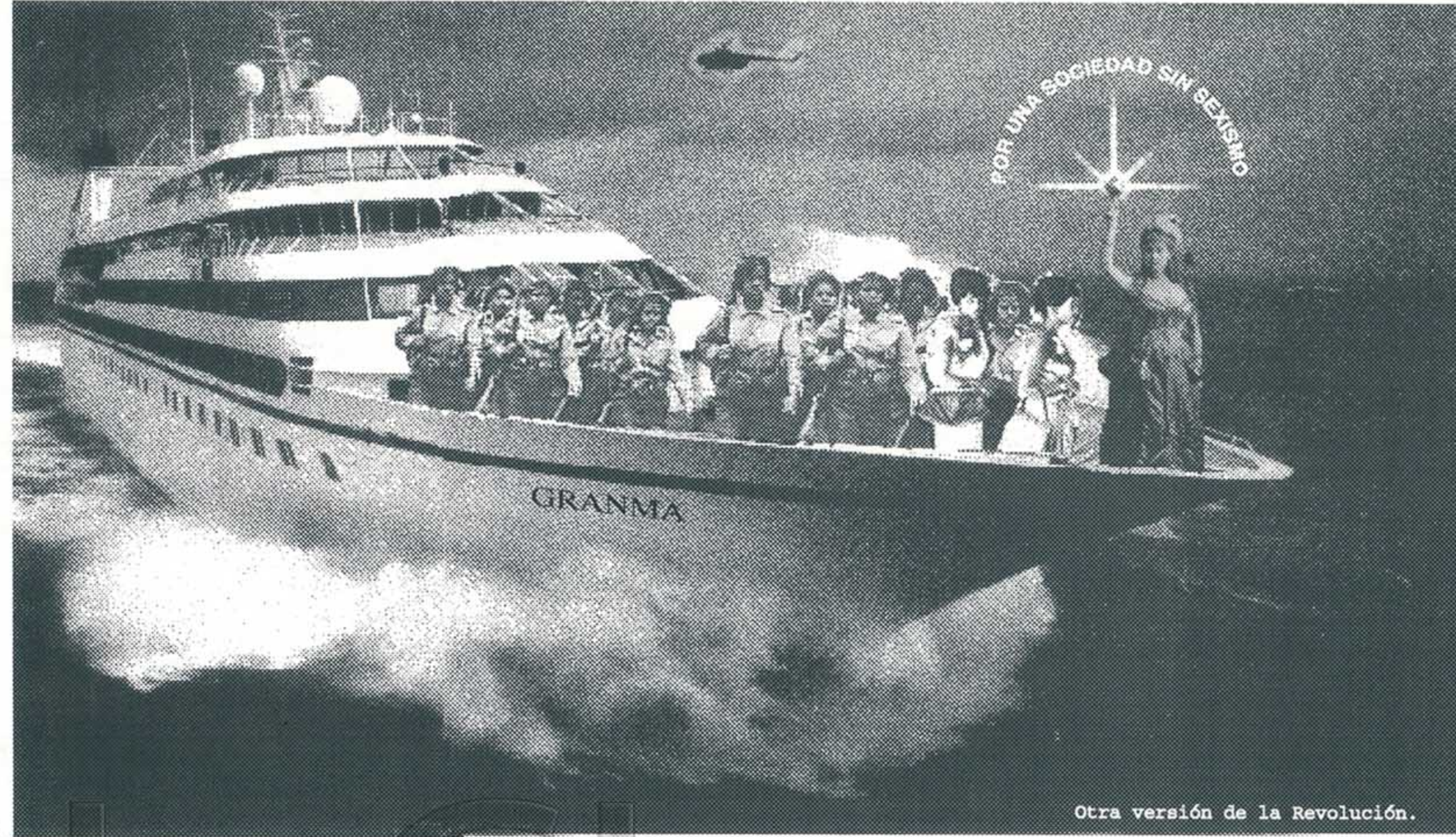
Otra versión de la Revolución.