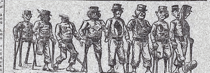
La Patria os saluda ¡oh, vencedores que supisteis cubrirlos de gloria en el campo del honor!