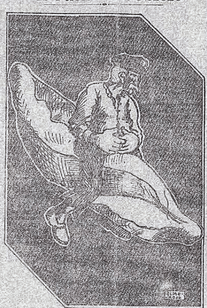
LA CONQUISTA DEL PAN