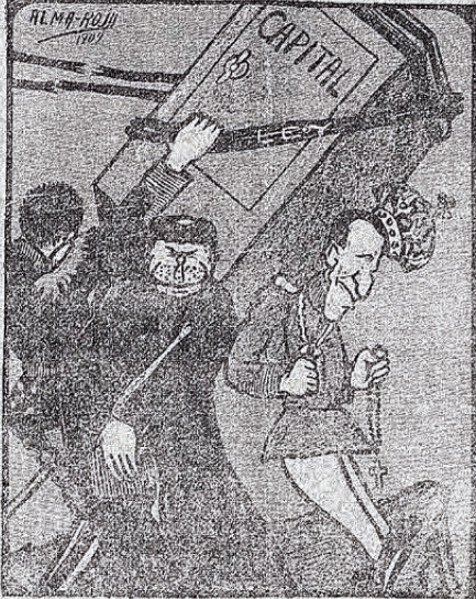
Perdió la ley su fuerza moral, é el capital se derrumba, amenazando sepultar monarquía, clero y militarismo.