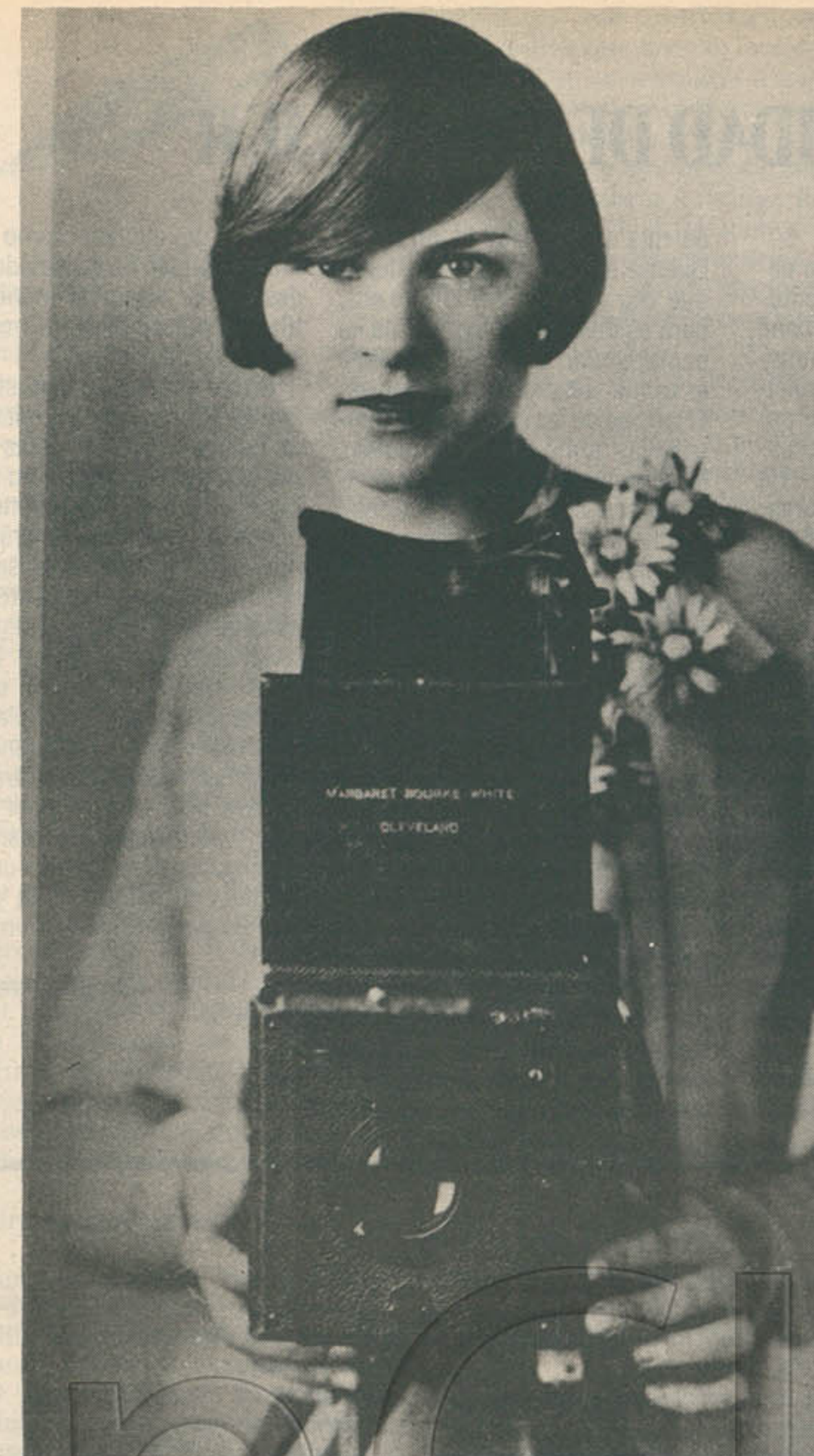
Margaret Bourke White 1928

Como último mentís a los jefes porteños, consignamos que la BW fue la creadora del reportaje "DURO". Fue la primera fotógrafa que mostró imágenes de la guerra en su verdad: horror y crueldad. En un principio había que