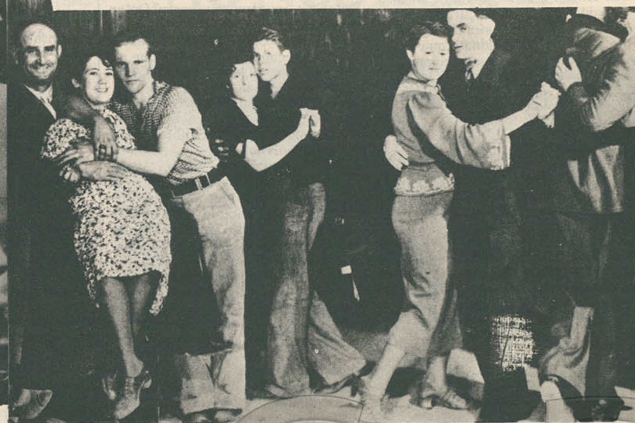
Primer número de Life. Tapa y nota de fondo de M.B.W.