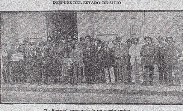
"La Protesta" resurgiendo de sus propias cenizas