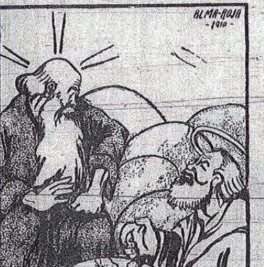
ALMA FUERA - 1910