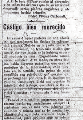
ALMA FUERA - 1910