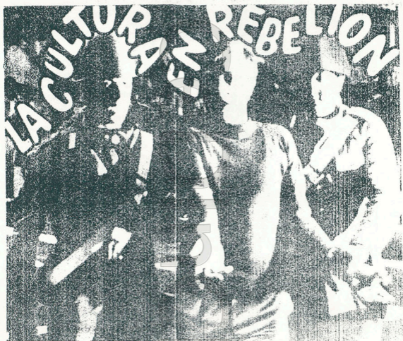
Grupo "Arte, cultura y política en los años '60" I.I.G.G. - F.C.S.