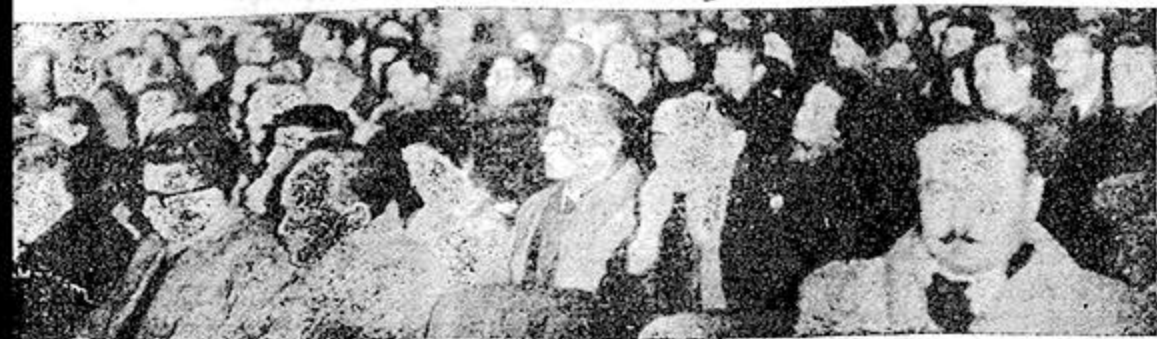
Ver Crónica Pág. 2