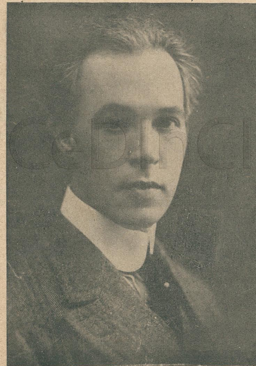
RAFAEL ALBERTO ARRIETA

AUTOR DE "ESTIO SERRANO", "LAS NOCHES DE ORO", "FUGA-CIDAD", "LAS HERMANAS TUTELARES", "ARIEL CORPOREO" Y OTROS LIBROS