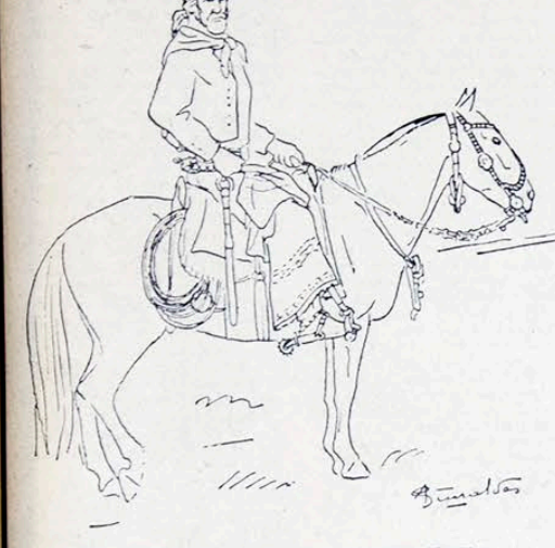
GUILLERMO ENRIQUE HUDSON, por Alberto Guiraldes