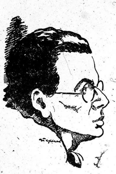
ALDOUS HUXLEY, por Naxos

"Canta el ave. Y sus frases transparentes, en la tarde, "La campana azul del mundo llenarán..."