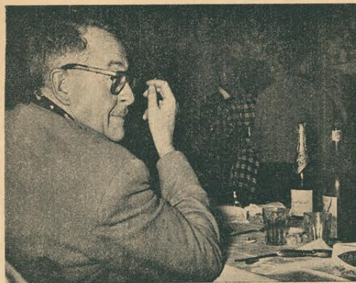
CAVALCANTI EN CAPRI

—Comenzaré por hacer una película policial porque tienen gran éxito. Pero tengo proyectos de magnitud: la vida de Sara Bernard y un Bolívar. Bolívar será una película cara y difícil y exigirá la cooperación de todas las repúblicas latinoamericanas. No será fácil encontrar actores para esas dos películas: cuanto más legendario es el