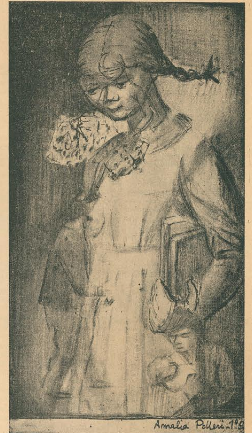
Amalia Polleri, 1951

—¿De modista? ¿Tú vas a trabajar de modista?— dice su madre con una voz que no es muy seria y en ese tono que emplean los ma-