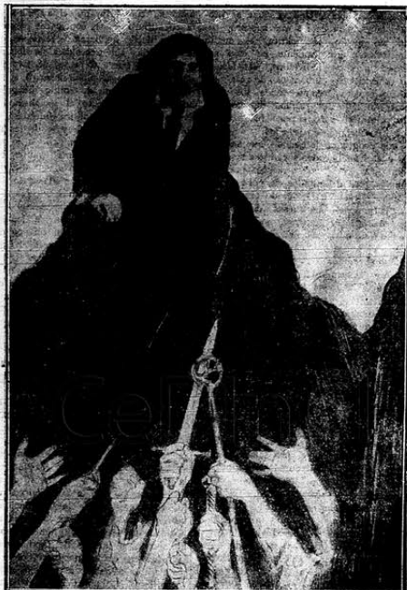
Y me dijo: «Llega hasta mí y no temas», y cuando estuve a su lado aún me dijo: «Mira».

Allá en el fondo, los viejos prejuicios se enroscaban amenazantes tratando de desastirse unos de otros por llegar los primeros a la altura.