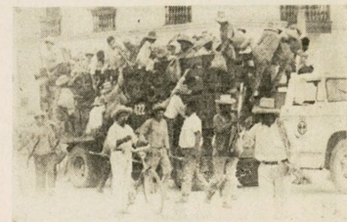
Para los militares peruanos, los empresarios no son explotadores sino trabajadores. Los obreros son convocados, pero no tiene poder de decisión.

Esa toma de conciencia, esa decisión para la lucha, extendida a capas amplias del proletariado —y también del campesinado pobre— hará que el gobierno peruano adopte formas cada vez más represivas, desnudando ante las masas su verdadero rostro.