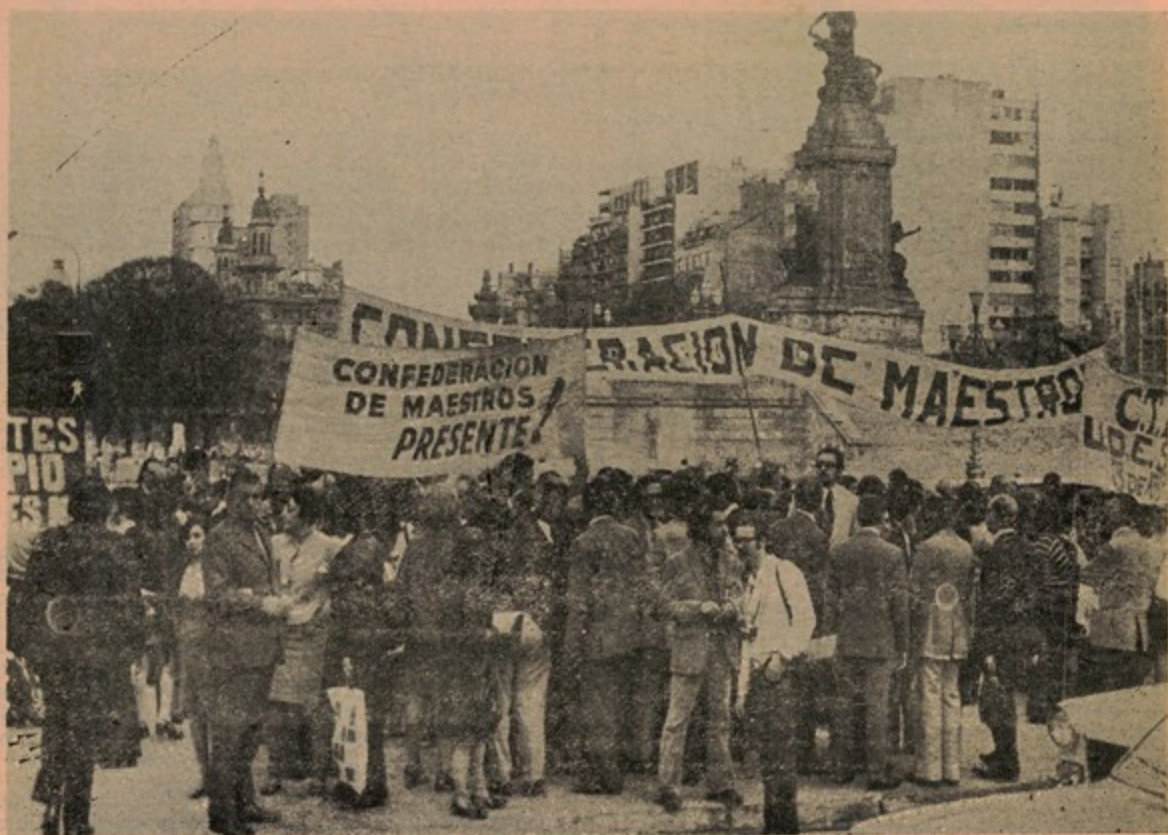
En su firme decisión de llevar a cabo el paro, la abrumadora mayoría de los 180.000 docentes nucleados en CTERA demostraron con su disciplina la voluntad de avanzar por el camino de la lucha, despreciando así los llorosos llamamientos del ministro de Educación Ivanishevich para que claudicaran.

Con su último paro de 48 horas, los docentes de todo el país brindaron a los niños y jóvenes de nuestra patria el ejemplo de una lucha sin claudicaciones, en su convicción de que éste es el único camino que los llevará a obtener satisfacción para su legítimo reclamo de un mejor nivel de vida.