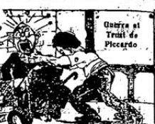
Comité pro Presos Poal de Santa F.

Por el momento de los compañeros que se encuentran en Bahía Blanca, que se reúnan el día 4 de agosto, a las 10 horas, en el teatro J. Guasch 1211, para tratar de los asuntos que se les comunicarán.