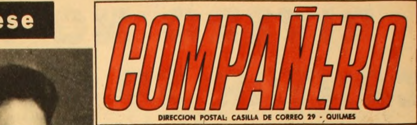
DIRECCION POSTAL: CASILLA DE CORREO 29 - QUILMES