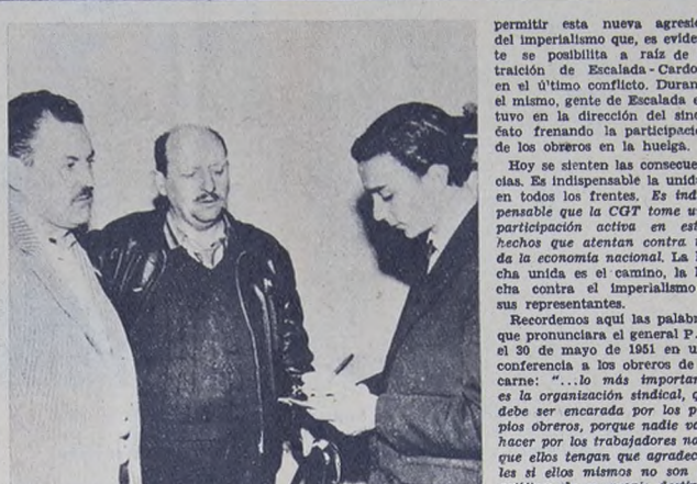
Los delegados sindicales de la Blanca hablan con nuestro cronista. El cierre del frigorífico es una maniobra que deja en la calle a miles de obreros del gremio de la carne.