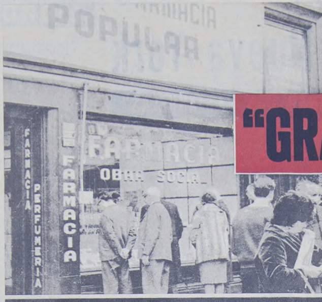
Los estafadores tienen sentido del humor. Las farmacias "populares", que dependen de los monopolios, tienen sus métodos para meternos el perro. Este divertido letrero es un buen ejemplo.

Un cuento del Tío Los grandes laboratorios cuando no intervienen directamente, favorecen y alientan todo aquello que leve agua (dolares) para sus molinos. Si en algunos casos dominan directamente a algunas farmacias habitadas por Salud Pública, la mayoría de las veces vuelcan su caudal económico hacia las farmacias mal llamadas mutuales, ya que en realidad son sucursales de venta al público. Estas actúan absolutamente al margen de la ley, pues usufructúan los beneficios que le competen a las verdaderas mutualidades. La antigua ley 4687 de Farmacias, proveía en el art. 56: "Los hospitales o casas de sanidad fundadas por instituciones de beneficencia nacionales, municipales y extranjeras son los únicos establecimientos que pueden tener farmacias propias. Las farmacias comprendidas en esta disposición no podrán efectuar despacho de medicamentos al exterior (al público) sino a título gratuito". Durante el gobierno P. . . . se creó la Dirección de Mutualidades para controlar y supervisar todo lo referente al desenvolvimiento de estos establecimientos. Y mediante el decreto 13.804/45 se facilitó a las empresas y sindicatos la propiedad de farmacias gremiales para el exclusivo uso de sus afiliados. Es decir que está pro-