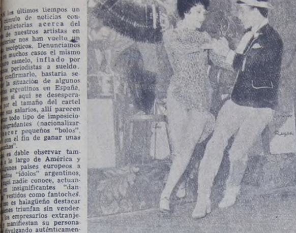
Juan Carlos Copes, bailarín argentino, terminó con el mito de los tangos con focones, "olé" y castañuelas, tan nefastamente difundidos en el extranjero. La revista "Variety" se hace eco de la actuación de nuestro compatriota en Nueva York.