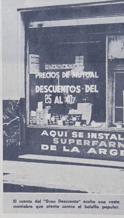
El cuento del "Gran Descuento" oculta una vasta maniobra que atenta contra el bolsillo popular.

Consecuentemente, al disminuir el poder adquisitivo de la población, el impacto lo sufrió la farmacia pequeña. En los últimos tiempos, más de 200 farmacias han debido cerrar sus puertas al no poder soportar la presión de los grandes trusts y testaferos. Como gremio de clase media, revelaron una total carencia de combatividad, y se sumieron en inútiles explicaciones científicas. En la Capital entraron al juego de las mutualidades en condiciones desfavorables, pues los descuentos debieron pagarlos de sus propios bolsillos. Al mismo tiempo, ante la opinión pública apocrieta como los principales causantes de los altos precios en los medicamentos, al no efectuar descuentos antes que las falsas mutualidades. Si bien en su principio reaccionaron contra los laboratorios boicoteando a algunos de ellos, temieron las consecuencias y transaron. La CAE ME (los laboratorios), inició juicio a un grupo de farmacéuticos por el monopolio de medicamentos (algo así como afirmar que el pez monopoliza el agua), y estos no tuvieron la suficiente bravura como para alinearse junto al pueblo explotado por la CAEME, patrocinada por L. Landaburu "el libertador" apelaba a acciones manobras para ganar el juicio, interviniendo a su favor personas allegadas al ex-senador Racedo, quienes eran apoderados de las