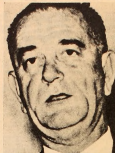
JOHNSON: El heredero