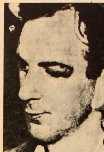
OSWALD: El chivo emisario