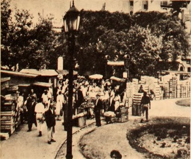
Los puestos callejeros: los precios subieron hasta tres veces en un día.

DIRECCION POSTAL: CASILLA DE CORREO 29 - QUILMES