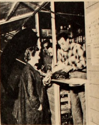
Hay que comer saltado.

Por eso clamamos al comienzo una carta de molinero del pueblo. Los extremos se tocan; las medidas propuestas son las mismas. La divisiiva es bien clara. Por un lado, están las familias humildes, atadas a sueldos de acero, que no se inflan ni se estrinan más, inmovilizados de hace un tiempo inmemorial, y que cada día deben luchar algo indispensable en el presupuesto familiar. Por el otro lado están los que protestan pero cobran más caro, que obtienen ganancias y siempre están "a tiro" con la situación actual. Es una guerra sin cuartel, donde algunos tienen armas para hacerle frente, y los otros, los más, aún no saben cuáles son las armas que tienen para emplear, y esas armas tienen un nombre: revolución.