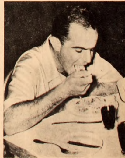
¿Cuánto le cuesta comer a este señor?