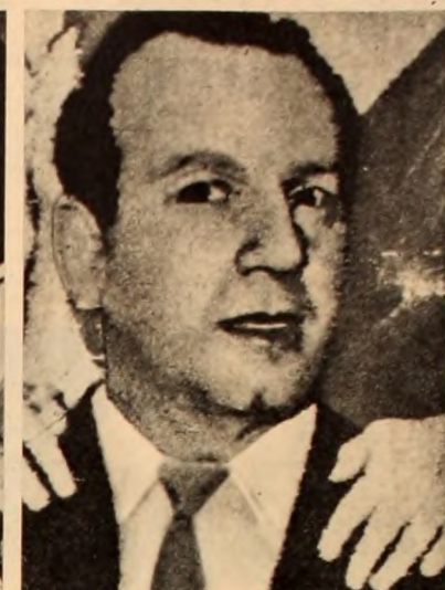
RUBINSTEIN: El gangster sensible