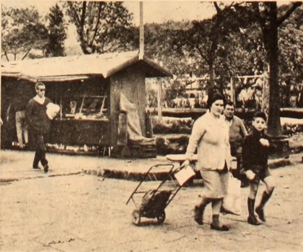
El changuito vuelve casi vacío. No es para menos.